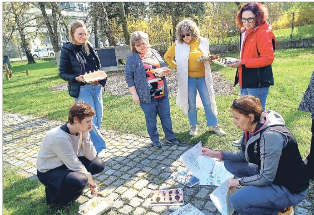
Pedagogové, kteří absolvovali v dubnu workshop, se učili, jak co nejjednodušeji vyučovat děti v přírodě, aniž by to vyžadovalo využití složitých pomůcek.

„Pedagogové si během tříhodinového programu sami vyzkoušeli, jak lze venkovní prostředí propojit s různými vzdělávacími oblastmi. Praktické ukázky zahrnovaly aktivity zaměřené na čtení s porozuměním a jazykové dovednosti, matematiku v reálných situacích, například měření či odhad, ale také pozorování přírody, badatelské činnosti a budování vztahu k místnímu prostředí. Nechyběl ani důraz na rozvoj spolupráce mezi žáky, soustředění a celkovou po-