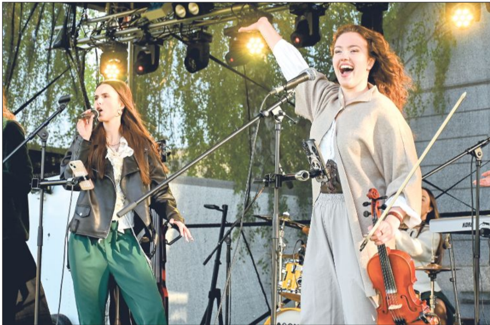
Součástí programu letošní filipojakubské noci v Kopřivnici bylo i energické vystoupení dívků kapely Beltane Girls hrající irský folk.