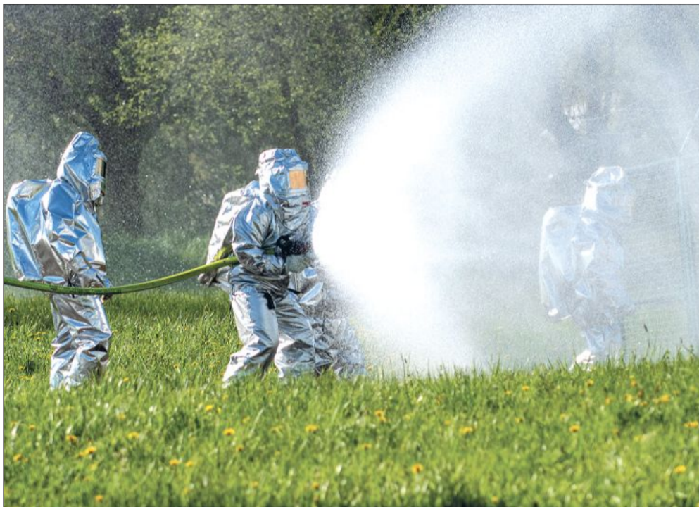
Před týdnem proběhlo cvičení složek IZS, jehož námětem byl masivní únik plynu z provozní sondy podzemního zásobníku společnosti Gas Storage CZ ve Štamberku.

Celý záměr je připraven. Ředitelka Mateřských škol Kopřivnice o něm v nejbližší době bude informovat nejen rodiče dětí v místních školkách, ale také Radu města Kopřivnice, která by změnu měla pouze formálně vzít na vědomí.