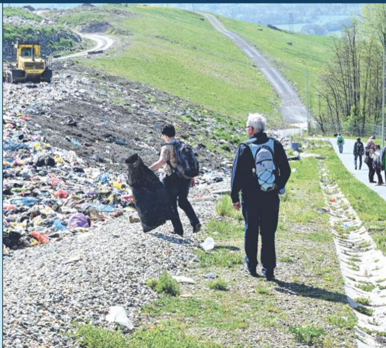
Exkurzi na skládku komunálního odpadu v Životicích u Nového Jičína absolvovali senioři i žáci z místních základních škol.