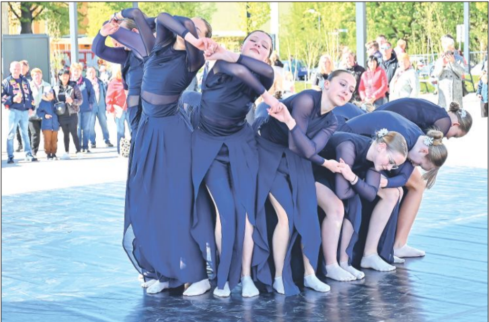
Ve středu 29. dubna Nové náměstí ožilo Dnem tance. Na ploše pod Lašskou bránou vystoupily mimo jiné tanečnice ze zdejší ZUŠ Zdeňka Buriana.

ní závodem s časem i světlem. „Tím, jak se mění světlo, mám přibližně hodinu na to obraz dovést,“ vysvětlila s tím, že postupem času, až bude zručnější malířkou, ráda by přešla na větší formáty. Výtvarnice používá k malbě takřka výhradně olejové barvy a například akrylu se cíleně vyhýbá. Kromě olejomalby se občas věnuje také kvaši, akvarelu či grafice. K malování vyráží se stativem, barvami a kufříkem do přírody, kde trpělivě zachycuje atmosféru konkrétní chvíle. Součástí doprovodného programu budou také výtvarné workshopy, které se uskuteční 15. května. Dopolední část bude určena školám, od 16 hodin pak široké veřejnosti. Zájemci se seznámí se základy krajinnomalby a naučí se, jak v obraze zachytit hloubku prostoru a vyhnout se plošnému dojmu. Autorka zároveň naznačila, že se před muzeum může objevovat častěji i přímo s malířským stojanem. „Budu takový živý poutač. Ráda dělám věci netradičně a ráda interaguji s okolím, i když jsem tak trochu introvert,“ řekla s úsměvem. Výstava Plenéry potrvá do 28. 6.