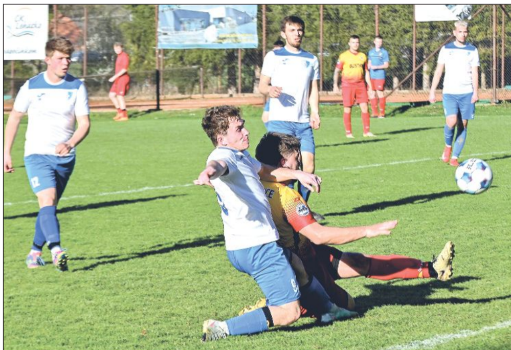
Fotbalisté Vlčovic-Mniší (bílé dresy) chtěli ze dvou zápasů 7. ligy během 48 hodin vyždímat více než pouhý bod za remízu s Nošovicemi.

Vlčovice (mha) – Pouhý jeden bod vydolovali fotbalisté Vlčovic-Mniší z „anglického týdne“, ve kterém nejprve v dohrávce 15. kola po boji těsně padli v Janovicích a poté doma remizovali s Nošovicemi 2:2. Šest kol před koncem soutěže tak mají poslední Vlčovice na své soupeře už nebezpečnou ztrátu, a pokud nepřijdou tříbodové injekce, začne se schylovat k nejhorsímu. V dalším utkání přivítají Vlčovice v sobotu 9. 5. od 16.30 h Palkovice.