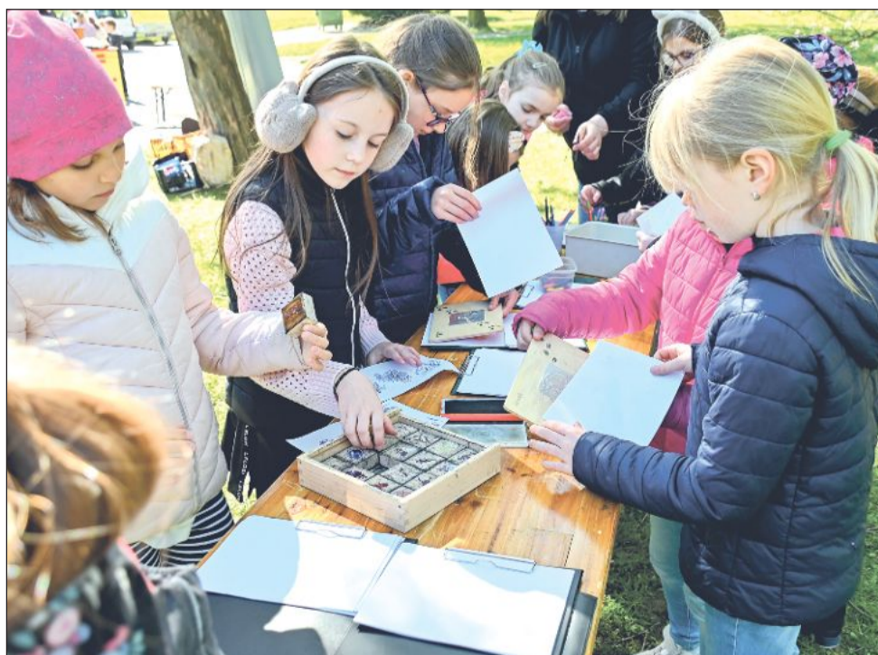
Žáci prvního stupně kopřivnických základních škol před týdnem na akci ke Dni Země v sadu E. Beneše podrobně zkoumali živočichy, kteří u nás žijí.

Kopřivnice (hod) – Ve středu 29. dubna proběhla v sadu E. Beneše Biodiverzita kolem nás, jedna z posledních akcí konaných v rámci Dnů pro Zemi 2026, jejichž cílem bylo připomenout důležitost ochrany životního prostředí. Zábavné-vzdělávací dopoledne pro žáky prvního stupně kopřivnických základních škol s názvem Sousedská slavnost ke Dni Země připravil odbor životního prostředí ve spolupráci se spolkem Stromov. Připraveno bylo sedm úkolů, které školáci postupně plnili. „Všechny úkoly jsou na téma biodiverzita a pojali jsme to tak, aby děti viděly, že ve městě jsme všichni sousedé, nejenom lidé, ale i stromy, zvířata a hmyz. Na jednotlivých stanovištích se seznamují se sousedy a plní různé úkoly k těmto tématům a hledají provázanost mezi sebou, sousedy ze světa zvířat a rostlin a vidí, jak jsme na sobě závislí,“ popsala program Kristýna Nováčková ze spolku Stromov. Děti se bavily například při určování druhu ptáka, sestavování obrázků zvířat, poměřování stromů, vyrábění svíček ze včelího vosku.