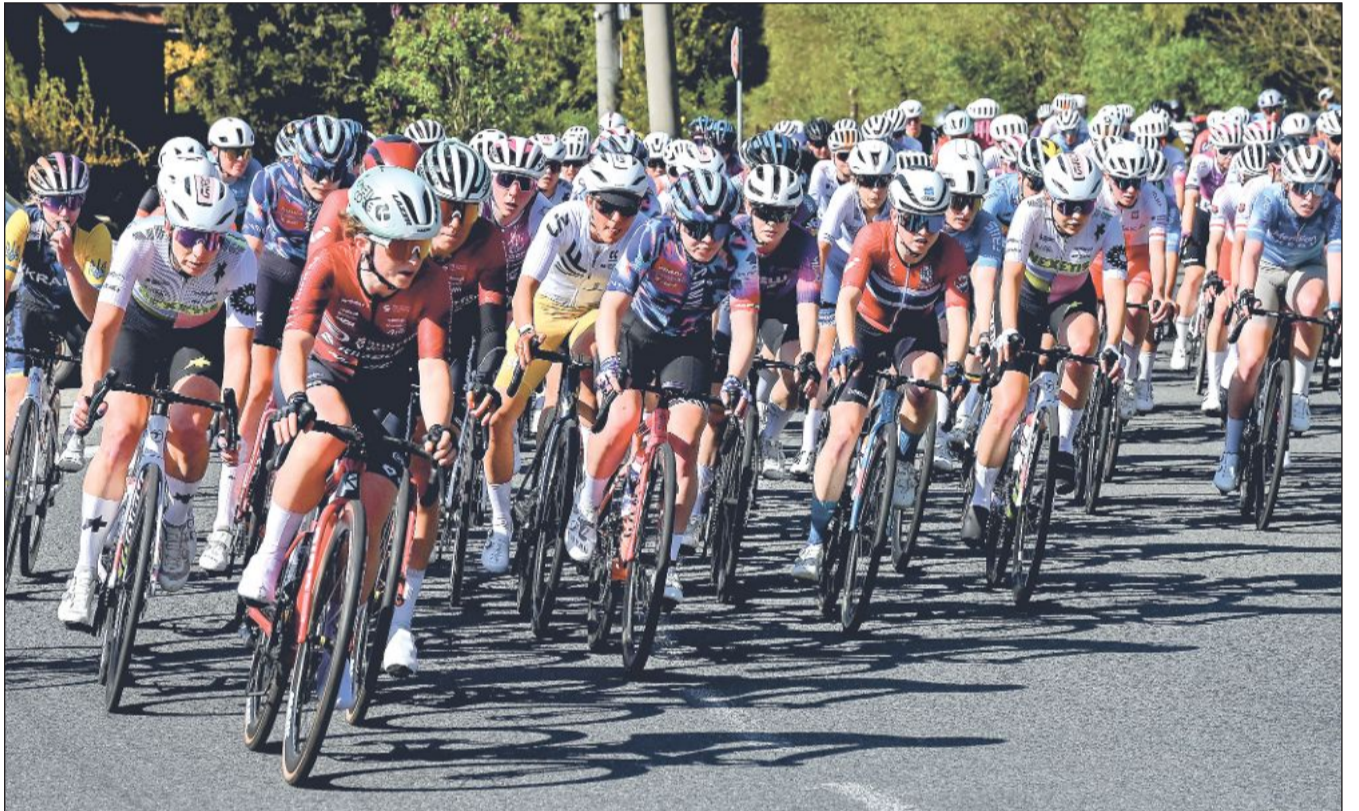
Kopřivnici o uplynulém čtvrtečním odpoledni prolétl cyklistický závod žen Gracia Orlová. Silniční etapový závod žen v 15.30 h prosvištěl tentokrát nikoliv centrem Kopřivnice, ale přes místní části Mniší a Vlčovice. Poté cyklistky přes Lichnov, Veřovice a Ženklovu svižně zaimpily do cíle na náměstí ve Štramberku. Více informací na straně 8.

Připravovaná změna by měla mít nulové nebo jen zanedbatelné dopady do ekonomiky provozu kopřivnických mateřských škol. Prodloužení provozní doby má být zajištěno prostřednictvím úpravy směn a organizace práce stávajících zaměstnanců. (Pokračování na straně 2)