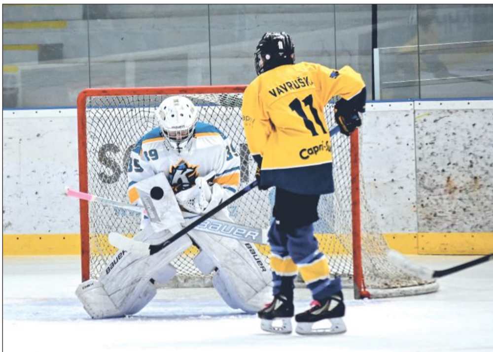
Hokejoví sedmáci Kopřivnice (bílé dresy) na domácím turnaji O kopřivnický puk v obou zápasech vždy těsně porazili silný Zlín.