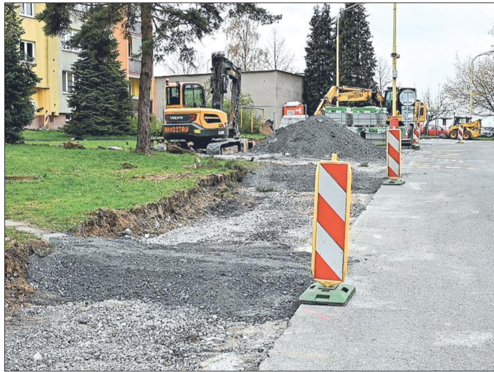
Budování nových chodníků na ulici Polní je jednou z akcí, které zkomplikovaly parkování v lokalitě. To by mělo v budoucnu zlepšit nové dočasné parkoviště.

Spolupráce mezi kopřivnickým podnikem a automobilkou Škoda Auto trvá více než tři dekády a Tawesco se za tu dobu vypracovalo mezi stabilní strategické dodavatele karosářských dílů. Společnost Tawesco je součástí strojírenské divize skupiny Promet Group a sídlí v areálu Tatry Trucks.