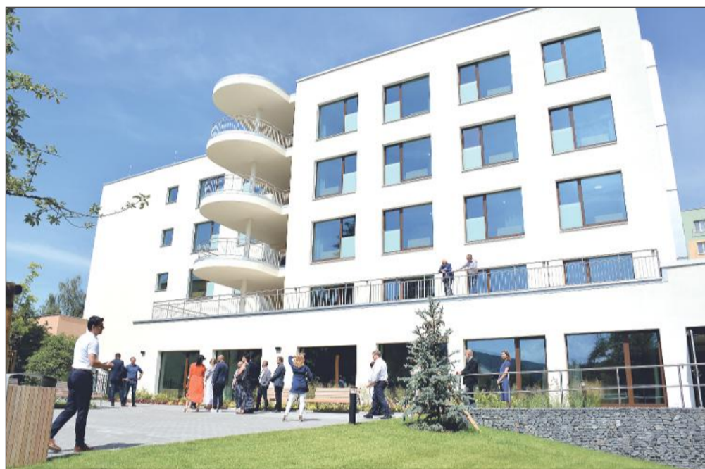
Součástí jednání zastupitelstva bude i rozhodování o dotacích v sociální oblasti. Největším příjemcem by měl být zdejší domov pro seniory.

Rada města rozhodovala o dalších žádostech organizací působících v sociálních službách. „Mezi 17 žadatelů jsme rozdělili celkem 849 445 korun, například Renarkon, o. p. s., spolek Andělé Stromu života či Domov Příbor. Na závěr bych chtěl moc poděkovat všem pracovníkům v této oblasti. Tato náročná práce, u někoho posláni, není často řádně finančně ohodnocena, a proto ještě jednou velké děkuji,“ okomentoval Stanislav Šimíček.