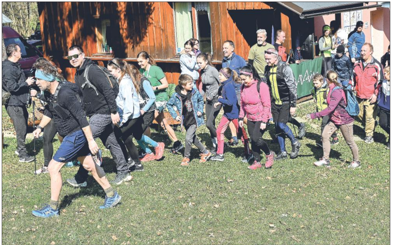
Na osm desítek sportovců se vydalo o uplynulé sobotě na Everesting 2026, tedy akci, na které bylo cílem zdolat 8 848 výškových metrů, které má nejvyšší hora světa Mount Everest. Více informací na str. 8