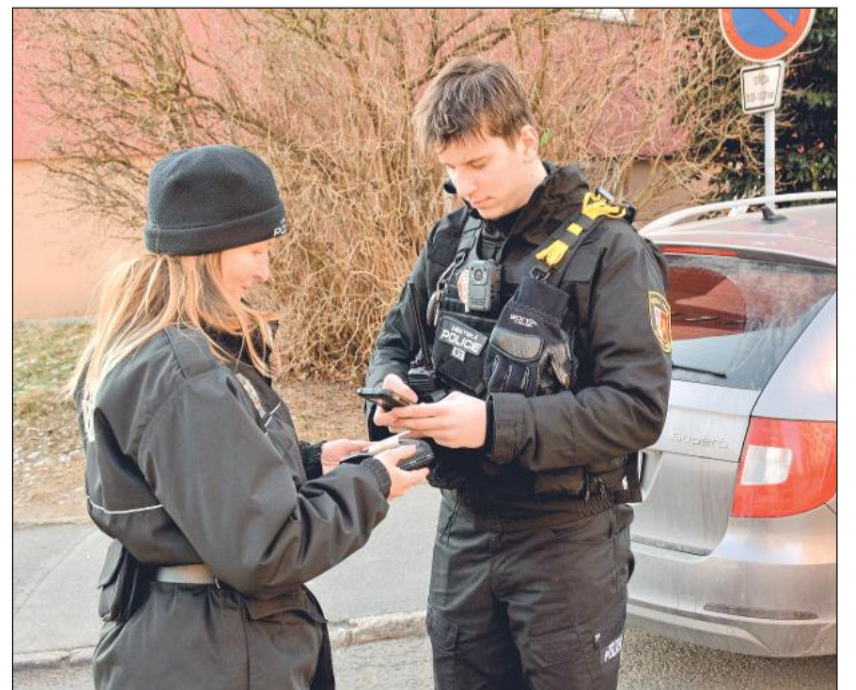
Dohled nad dopravou a zajišťování veřejného pořádku tvořilo gró činností městských strážníků v uplynulém roce.

Letošní výsledek tak naznačil, že Kopřivnice si udržela dobrou pozici mezi městy Moravskoslezského kraje a zároveň dokázala posílit i v republikovém srovnání. Výzvou do dalších let zůstane především zlepšení demografického vývoje a větší schopnost města přilákat nové obyvatele. Naopak dobrá dostupnost některých zdravotních služeb a relativně příznivá vzdělávací struktura ukázaly, že je na čem stavět.