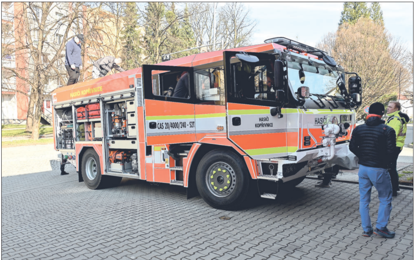
Po dvaceti letech získala místní jednotka dobrovolných hasičů nové prvosledové výjezdové vozidlo. Hasičský speciál na podvozku Tatra stál bezmála 11 milionů korun a město jej pořídilo i za pomoci dotace od ministerstva vnitra.