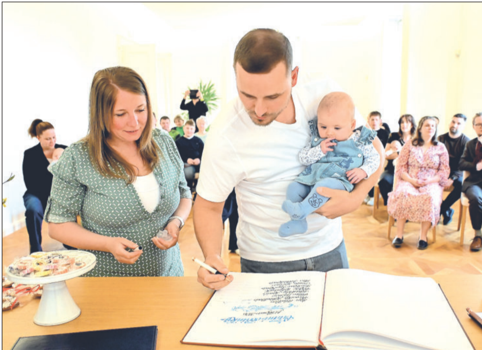
Letos poprvé proběhly v Ringhofferově vile tři slavnostní ceremonie, během kterých byli přivítáni noví občani Kopřivnice.