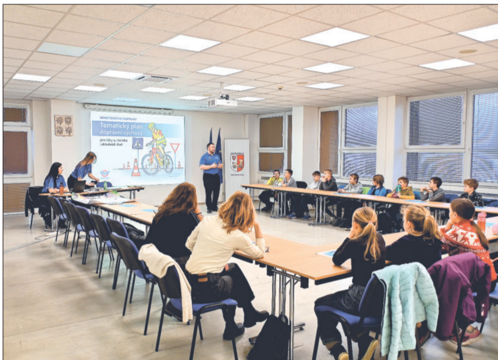
Strážníci městské policie začali s výukou dopravní výchovy určenou místním školákům. Kromě teorie žáky čtvrtých tříd čekají i praktické lekce na dopravním hřišti.

Tematický plán ministerstva dopravy vázaný k tomuto programu zahrnuje minimální rozsah požadovaných znalostí pravidel provozu na pozemních komunikacích k získání průkazu cyklisty pro žáky 4. ročníků základních škol. V následujících týdnech si dopravní výchovou v režii místních strážníků projdou všichni čtvrtáci z Kopřivnice i místních částí. Od programu pod záštitou BESIP si slibují zejména zvýšení bezpečnosti na cestách.