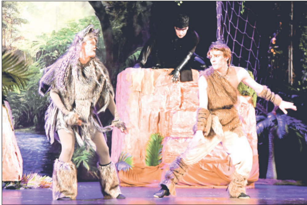
Sobotní podvečer 21. března patřil v KDK rodinnému muzikálu Knihy džunglí . Výpravné představení na motivy legendární předlohy bylo plné úprav populárních hitů.

Program však nekončí spuštěním opony. V rámci off programu v prostoru Múza se návštěvníci mohou těšit na další taneční vystoupení, vypravěčský „jukebox“ i koncert Honzy „Comara“ Ražnoka. Většina akcí v rámci Noci divadel bude zdarma, vybraná představení bude možné navštívit za symbolické devadesátikorunové vstupné, které je zároveň připomínkou letošního Havlova výročí.