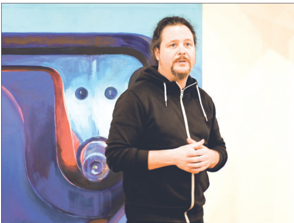
Obrazy malíře Ondřeje Tkačíka budou v Muzeu na Fojtství k vidění už jen do konce tohoto týdne.

Často to poznám až zpětně. Kdysi jsem obrazy často přemaloval a ničil dřívě, než se mohly zařadit do širšího kontextu. Proto mi toho například moc nezbylo z dob studií na AVU. Dnes,