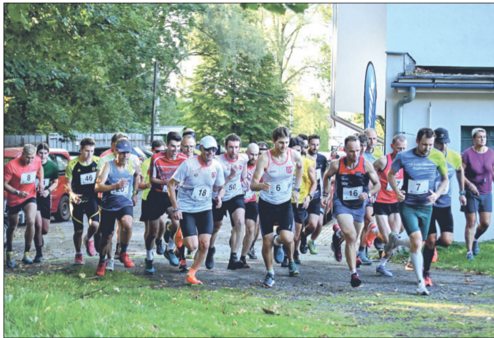
Mezi regionálními běžci oblíbený seriál LBL začíná tradičně v Mořkově, novinkami sezony jsou závody ve Vysoké u Val. Meziříčí a v Rožnově p. R.

Lašská běžecká liga 2026 začíná v sobotu 14. března závodem Mořkovský zajíc (10 km), jehož 17. ročník odstartuje v 9.30 hodin nad vlakovým nádražím Mořkov, tedy cca 1,3 km od místa prezentace, která je v den závodu od 7.30 do 9.00