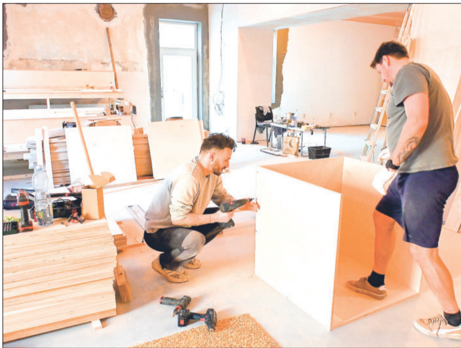
Práce na interiéru herny Köstka jsou v plném proudu. Nový podnik v budově Kasáren na ulici České byl měl otevřít v závěru dubna.

Příbor (hod) – Výměna vodovodního řadu na ulici Jičínské v Příboře zapříčinila dopravní omezení. SmVaK už vloni zahájil výměnu vodovodního řadu v Příboře. Po zimní pauze se práce rozjely naplno a od pondělí došlo k uzavření ulice Jičínské v úseku od křižovatky ulic Komenského u gymnázia až po křižovatku s ulicí Karla Čapka, tedy k vjezdu na náměstí. Tento úsek bude uzavřen až do 10. května. Objízdná trasa pro automobily bude vedena po ulicích Komenského, Frenštátská, Čs. armády a Karla Čapka. V souvislosti s dopravní uzavěrou dojde i ke změnám v autobusové dopravě. Pro spoje ve směru do Ostravy se zastávka „Příbor, u pošty“ přesune na zastávku „Příbor, u škol“ (stanoviště č. 7). V opačném směru zůstává provoz beze změn. Zastávka „Příbor, u škol“ ve směru od Kopřivnice je přesunuta na ul. Čs. armády, v opačném případě se nic nemění.