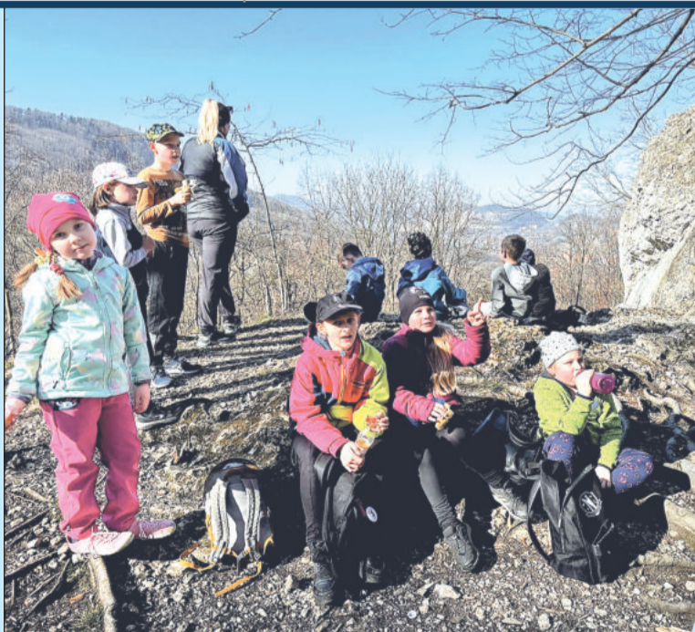
Účastníci příměstského tábora během minulého týdne stihli mimo jiné i řadu výletů do okolí.

Příměstský tábor se nesl v duchu dobrodružství Asterixe a Obelix. „Náš tábor má od každého trošku. Máme tady kreativní chvíli, ale snažíme se to hodně zaměřit i na sport a na venkovní aktivity,“ řekla vedoucí Denisa Černošková. (Pokračování na str. 3)