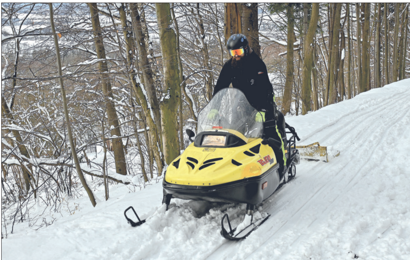
Díky sněhové nadílce Správa sportovišť Kopřivnice mohla pro běžkaře připravit také oblíbenou trasu okolo Červeného kamene. Příznivci bílé stopy využili i dráhy na letním stadionu. Více na straně 2.

Starosta Štramberka David Plandor již dříve naznačil, že město má o pokračování spolupráce zájem, přestože se k ní kriticky staví část opozice. „Město Štramberk má nadále zájem o spolupráci v oblasti poskytování služeb městské policie. Veřejnoprávní smlouva by měla zajistit stejný rozsah služeb, tedy minimálně dvakrát denně pravidelnou kontrolní činnost, obsahuje i výjezdy na ohlášení či vyšší počet hlídek při kulturních akcích či mimořádných situacích. Cena samozřejmě reflektuje inflaci,“ vysvětluje postoj vedení sousedního města David Plandor. (Pokračování na straně 2)