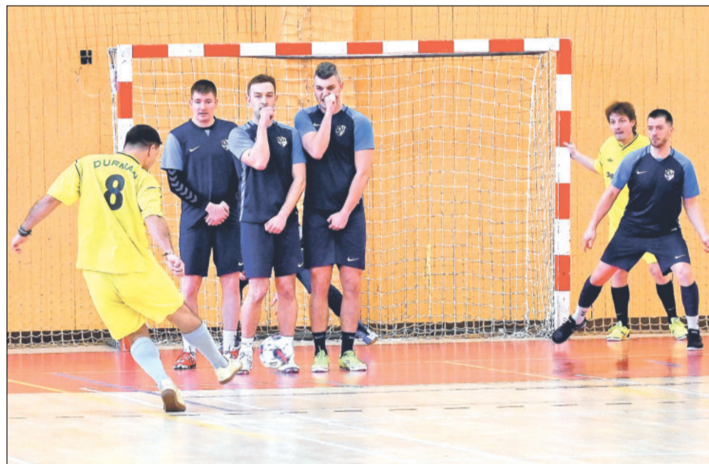
Futsalisté FU Kopřivnice C (modré dresy) v tomto utkání posledního kola sice porazili SKP Frýdek-Místek (5:3), ale v součtu jim na vítězství Wespen Nový Jičín chyběly tři body.

Novým mistrem 1. okresní futsalové třídy se stal Wespen Nový Jičín. O titulu se rozhodovalo až v posledním kole (turnaji). Na titul mohly dosáhnout Wespen Nový Jičín, FU Kopřivnice C a Dragons Nový Jičín. A právě Wespen zvládl dramatický finiš nejlépe, když uspěl i v přímém souboji s céčkem