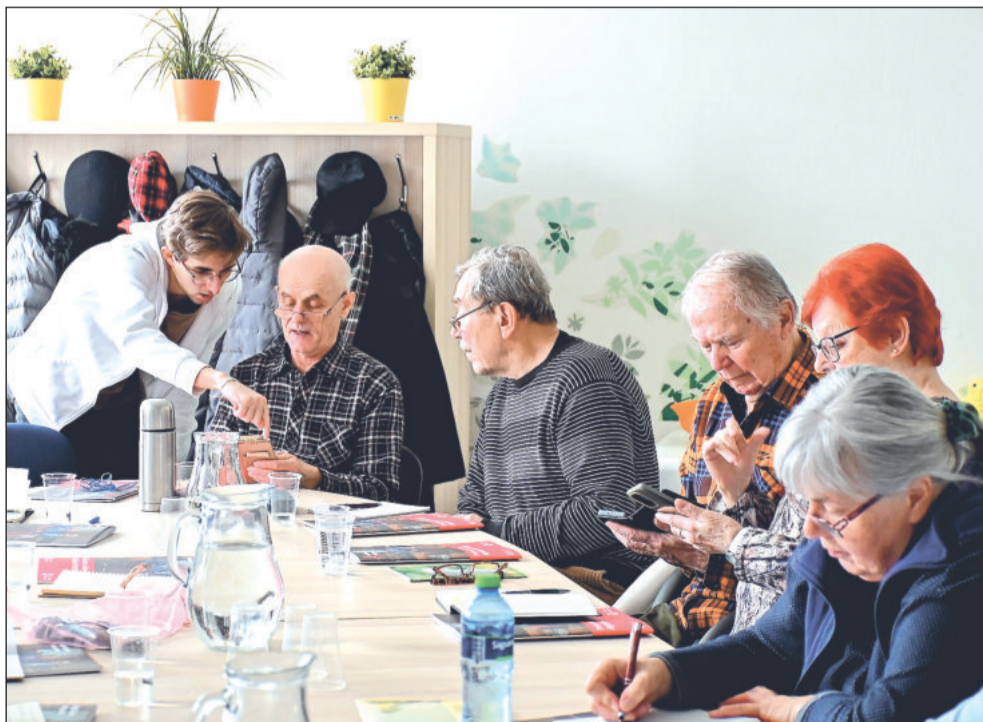
Před týdnem se ve dvou skupinách uskutečnily dva čtyřhodinové kurzy, na kterých se senioři učili ovládat chytré mobily.

Radnice organizovala kurzy ve spolupráci s Moudrou sovičkou už počtvrté. „Kurzy pořádáme nejen ve spolupráci s Moudrou sovičkou, ale i Vanaivanem a vždy jsou plné. O kurzy mají senioři velký zájem, neboť dnes se čím dál víc komunikuje přes mobilní aplikace,“ poznamenala Pavla Žáčková, pracovnice sociálního odboru kopřivnické radnice, která má akce pro seniory na starosti, a dodala, že tento kurz není letos poslední.