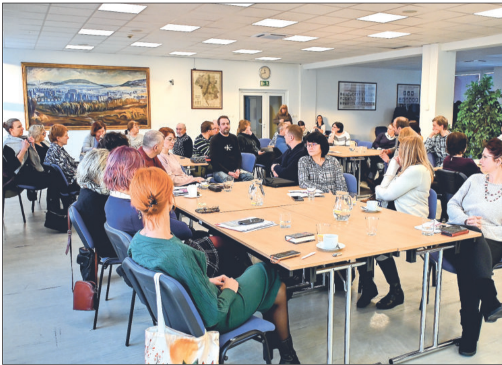
Na veřejné projednání IV. střednědobého plánu sociálních služeb přišly do zasedací místnosti na radnici čtyři desítky lidí, které daná problematika zajímá.

Kromě kondičního oválu na stadionu je podle potřeby a množství sněhu upravován také běžkaři oblíbený zhruba osmikilometrový okruh se startem a cílem na Janíkově sedle. Stopa okolo Červeného kamene je připravována i přes opakované problémy s letitým sněžným skútre, který zaměstnanci správy sportovišť museli během sezony už několikrát komplikovaně opravovat přímo na trase.