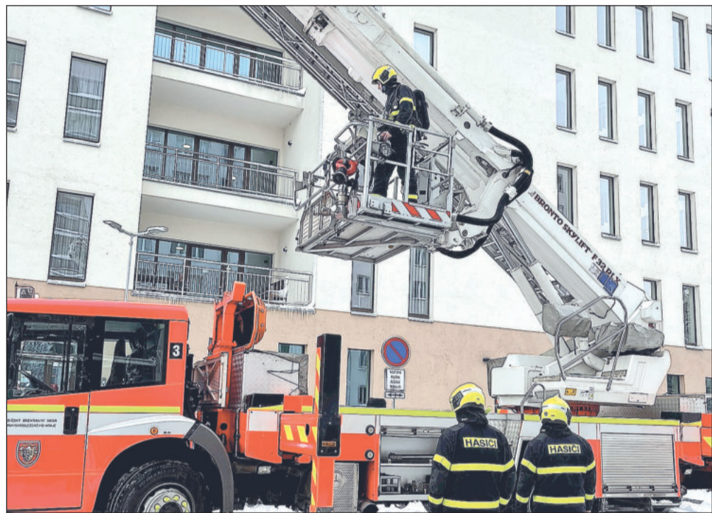
V Domově pod Bílou horou proběhlo taktické cvičení, jehož cílem bylo prověřit připravenost jednotek požární ochrany a personálu zařízení na krizové situace.