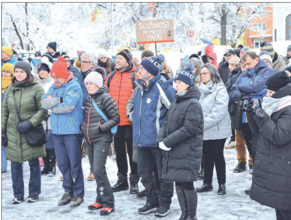
V neděli odpoledne se na kopřivnickém Masarykově náměstí sešli lidé na shromáždění, pořádaném na podporu demokracie, slušné politiky a prezidenta Petra Pavla.

Od září otevře tři první třídy ZŠ 17. listopadu, z toho dvě běžné a jednu ve spolupráci se Světem poznání. Ve škole Emila Zátópka počítají s tím, že v září otevřou dvě první třídy, ale v případě, že by neotevřeli přípravnou třídu, pak by prvňáčci byli ve třech třídách. Po dvou prvních třídách budou mít školy dr. Milady Horákové a Alšova, ostatní základní školy po jedné.