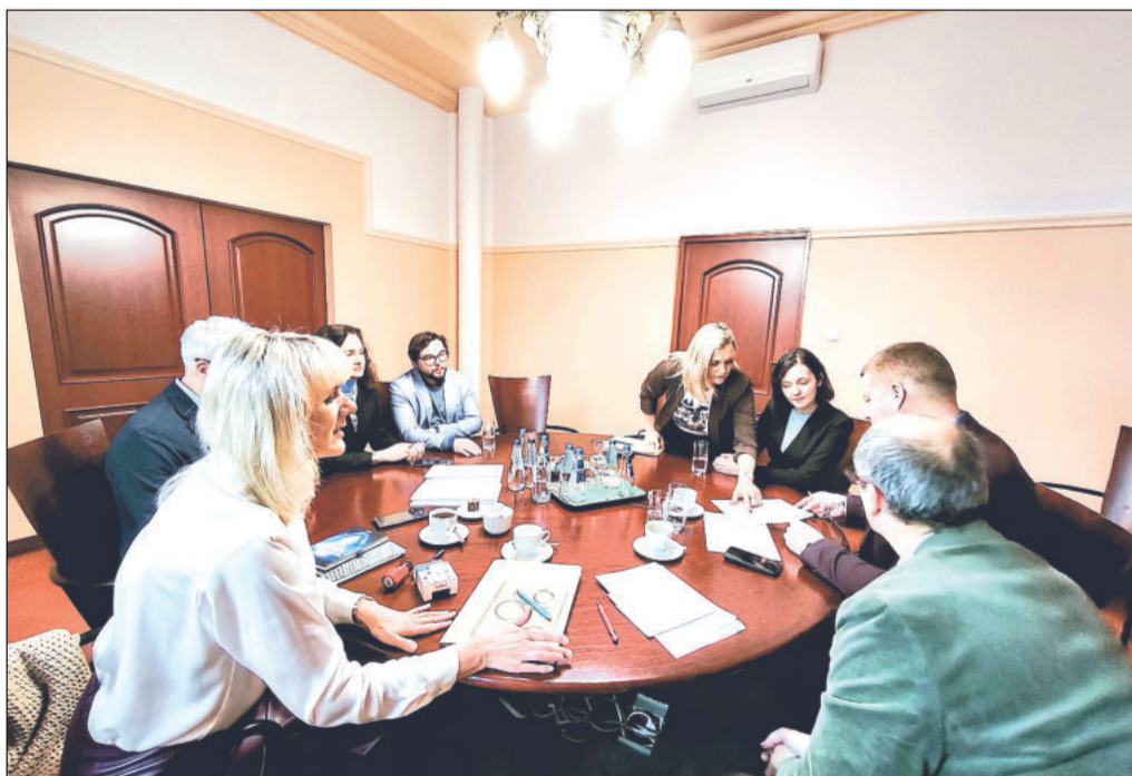
Na radnici v polské Ratiboři byla podepsána dohoda o spolupráci, díky které obě města mohou dosáhnout na dotační peníze pro opravu vyhlídek.