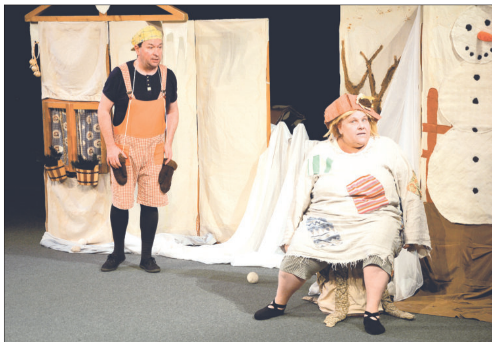
Únorovou nedělní pohádku přivezlo činoherní Divadlo Kapsa. Na zpola zaplněný sál místního kina čekalo 15. února tematické představení k masopustnímu období.

tého výročí narození zakladatele zdejšího kočárovec. Přednáškový triptych bude pokračovat ve zhruba měsíčním cyklu. 19. března se program nazvaný Nesselsdorfer Wagenbau-Fabriks-Gesellschaft zaměří na proměnu rodinné firmy v akciovou společnost. Přinese málo známé informace o jejím vzniku a bude pokrývat období od jednání o transformaci až po zahájení výroby automobilů. Závěrečná část trilogie je připravena na 16. dubna a pod titulem Zrození legendy „TATRA“ se lidé s Liborem Vojtkem vydají pátrat po původu vzniku označení TATRA.