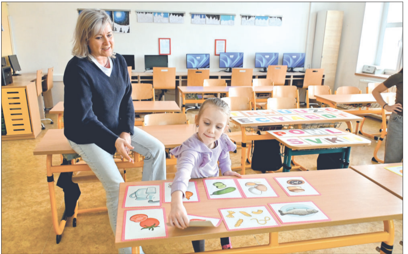
Nejen v Základní škole v Lubině proběhly před týdnem zápisy dětí do prvních tříd. Z 308 dětí, které byly u zápisů přezkoušeny, u 58 avizovali rodiče možnost odkladu. Kolik jich nakonec v září usedne do lavic, bude jasno koncem prázdnin.

školy prokázalo měření, které po stížnostech zaměstnanců MŠ objednala zdejší radnice. Následovalo rychlé vyklizení školky a zahájení pátrání po původu kontaminace. Vzhledem k tomu, že látka se velmi často používá jako změkčovadlo v podlahových krytinách, je tento původ nejpravděpodobnější. „Museli jsme ale vyloučit všechny možné důvody výskytu 2-ethylhexanolu, ten je obsažen například i v materiálech, ze kterých se vyrábí nábytek, proto po uzavření školky došlo k vystěhování a následnému opětovnému přeměření, které znovu prokázalo nadlimitní výskyt. Nábytek tedy můžeme vyloučit. Po odstranění podlahové krytiny a zbytků lepidla bude následovat další kontrolní měření a následně bude stanoven další postup,“ vysvětluje komplikovanou pátrání po původu chemikálie ve vzduchu Magda Šebestová z odboru majetku města. To je také důvod, proč si odstranění problému vyžádá více času. Po odstranění původní vinylové podlahy totiž není možné hned instalovat novou. „Musíme počkat na výsledky dalších měření. Pokud by i bez vinylu na podlaze byly koncentrace nadlimitní, znamenalo by to nutnost hledat příčinu jinde v podlahové konstrukci. K položení nové krytiny dojde, až si budeme stoprocentně jistí, co problém způsobilo,“ vysvětlila Magda Šebestová. (Pokračování na straně 2)