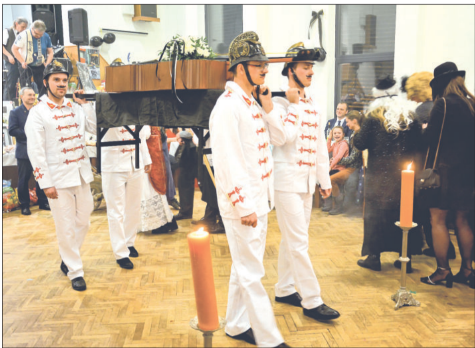
Na končinovém plese v Mniší nechyběl tradiční rituál pochování basy. Na další se lidé mohou těšit až za dva roky.

Mniší (dam) – Na končinovém plese v Mniší v sobotu večer pochovali basu a ukončili masopustní období hodování, tancovaček a průvodů masek. Program v režii místních dobrovolných hasičů byl taneční zábavou, na které se o hudební složku večera postarala dechová hudba Javořinka a kapela Escape Music Jirky Švidrnocha. Zlatým hřebem zábavy byl samotný rituál pochování basy. Recesní vystoupení, ve kterém se nad katafalkem s basou zpívaly drby o obyvatelích vesnice, trvalo víc než hodinu a kromě škraloupů svých sousedů si vystupující vzali na paškál například odpor některých obyvatel Mniší proti úpravám hasičské cvičné dráhy nebo liknavost radnice ve věci zastřešení terasy a rekonstrukce elektroinstalace v kulturním domě.