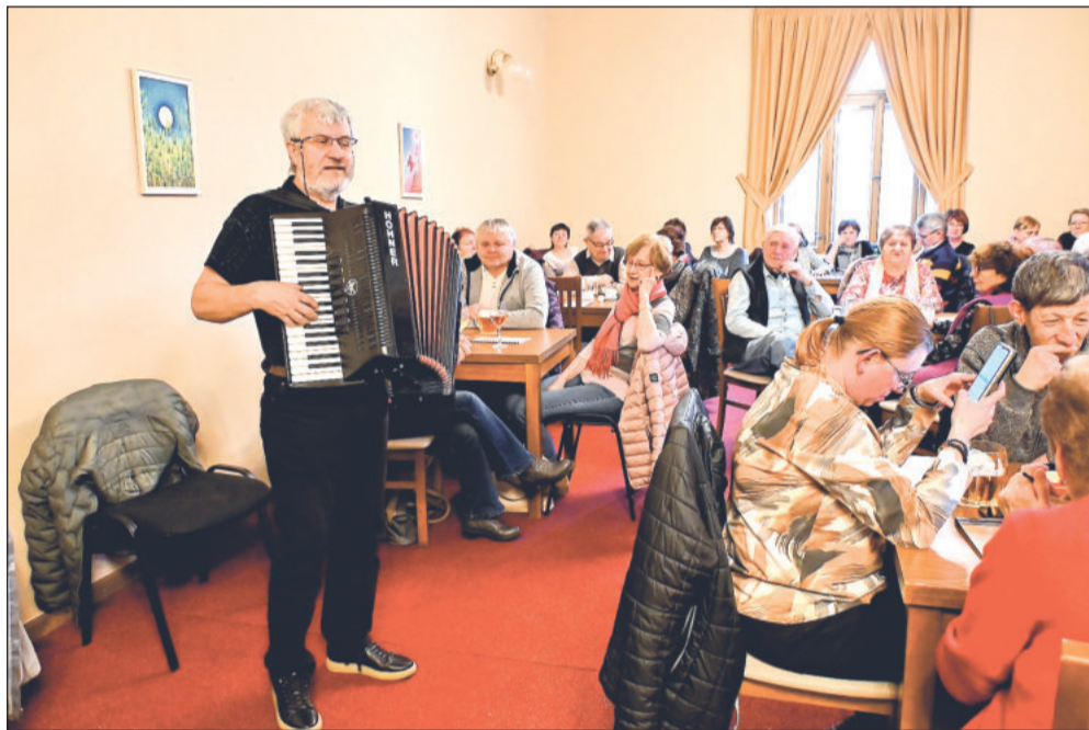
Tradiční akce pro seniory se těší velkému zájmu. Do Vily Machů jich přišlo víc než sedm desítek.

Další akce se uskuteční 10. března, a to přednáška s názvem Bezpečí v on-line prostoru. „Protože vloni byl o tuto tematiku velký zájem, ta letošní se uskuteční v zasedací místnosti v desátém patře na radnici a policisté budou seniory upozorňovat na novodobé nástrahy a podvody na internetu,“ přiblížila další akci Pavla Žáčková.