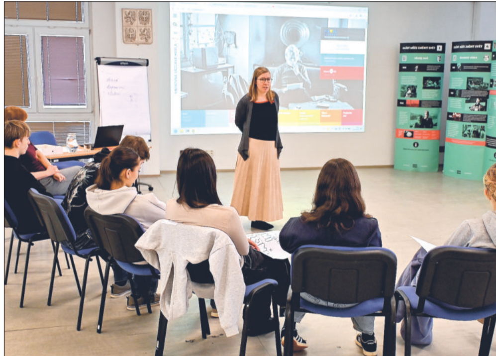
Žáci ZŠ Alšova využili možnosti hostování pracovníků Knihovny Václava Havla v regionu a zúčastnili se vzdělávacího programu Lidská práva aneb do vězení za písničku?

Město, které pozemek o rozloze necelých 1 900 m 2 prodalo, projekt podporuje, protože nedostatek zubních lékařů patří mezi palčivé problémy regionu. A otevření nových ordinací by mělo přispět ke zlepšení dostupnosti stomatologických služeb pro místní obyvatele.