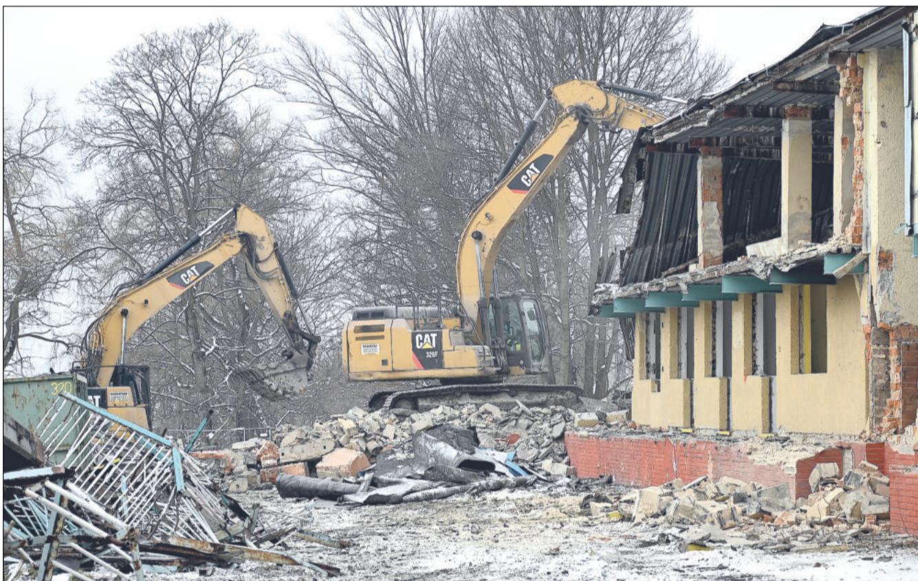
V úterý 3. února se těžké demoliční stroje zakously do provozní budovy koupaliště. Do konce týdne byl objekt zbourán a nyní bude firma pokračovat částečnou demolicí bazénových van.