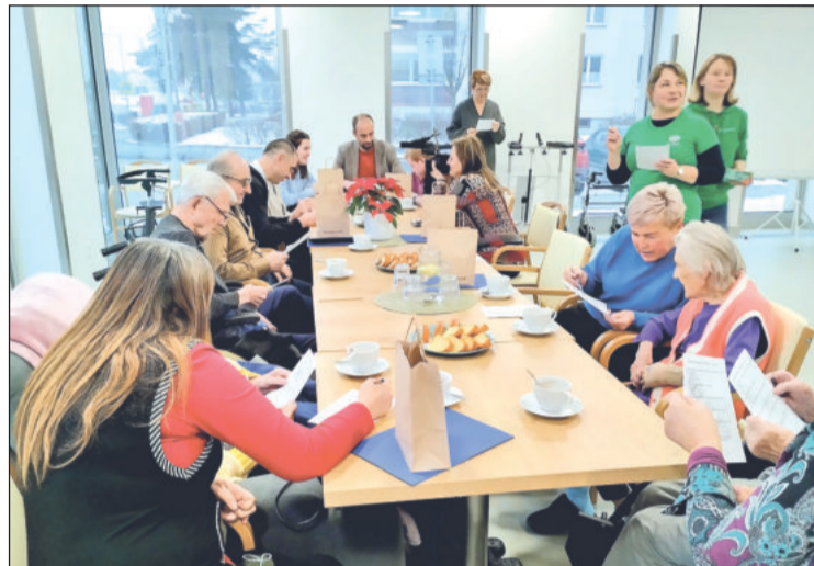
Před týdnem obdrželi lidé, kteří se v rámci dobrovolnictví starají o klienty domova seniorů, drobný dárek s poděkováním.