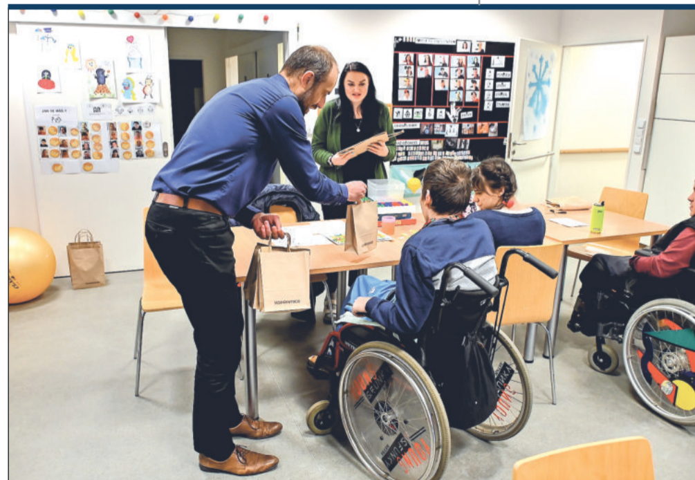
Denní stacionář Kopretina slavil čtvrtstoletí fungování v Kopřivnici. Aktuálně služba pomáhá 18 klientům se středně těžkým a těžkým postižením.