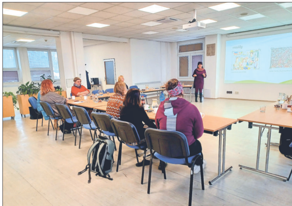
První akcí, která proběhla v rámci MAP V, byl seminář s názvem Mosty mezi ročníky i stupni anebo Přechody na základní škole s respektem a pohodou.

„Pro město jde o finančně zajímavé projekty zaměřené na místní akční plánování. Za tu dobu jsme získali na dotacích celkem víc než 20 milionů korun, a mohli tak realizovat spoustu aktivit, na které bychom běžně nedosáhli. Tentokrát získáváme z Operačního programu Jan Amos Komenský 2,6 milionu korun, přičemž spoluúčasť města činí 20 % z celkových způsobilých výdajů, což je cca 520 tisíc korun. MAP je přínosný zejména pro zapojené školy, protože díky němu mohou uskutečnit aktivity, které by bez finanční podpory nemohly realizovat,“ okomentoval přínos projektu