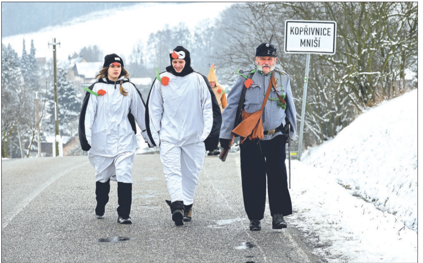
Obyvatelé Mniší si v sobotu užili masopustní průvod v zimních kulisách. Na obchůzku obcí vyrazilo několik desítek lidí v tradičních i netradičních kostýmech v doprovodu kapely i harmonikářů na voze taženém koňmi.