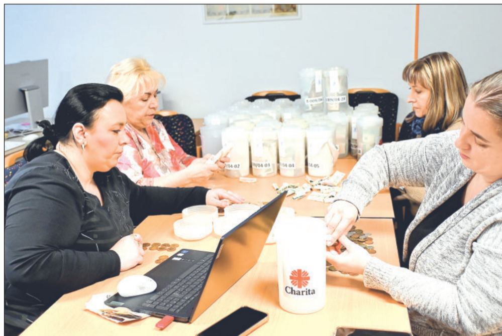
Letošní ročník Tříkrálové sbírky byl na území měst a obcí spadajících pod Charitu Kopřivnice opět rekordní. Lidé do kasiček vložili přes 1,6 milionu korun.

„Třetí oblast, kterou chceme podpořit z příspěvku, je projekt Pomocná ruka na dosah (70 tisíc korun), tento projekt pomáhá osobám v tíživé situaci, které čelí nenadálým výdajům, ztrátě příjmu nebo jiným problémům, jež je přivedly do finanční tísně. Poslední náš projekt, který chceme podpořit, se jmenuje Pod křídly Charity (450 tisíc korun). Jde o víceletý projekt směřující k pořízení domova pro osamělého seniora bez rodiny, který se ocitl v bezvýchodné životní situaci. Charita Kopřivnice mu chce nabídnout bezpečné a důstojné zázemí, kde nalezne nejen stře-