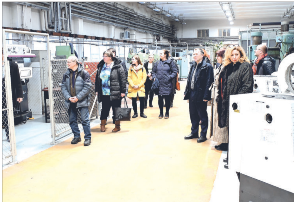
Členové Rady pro rozvoj lidských zdrojů si v úvodu prvního letošního setkání prošli dílny Střední školy a Vyšší odborné školy Kopřivnice.