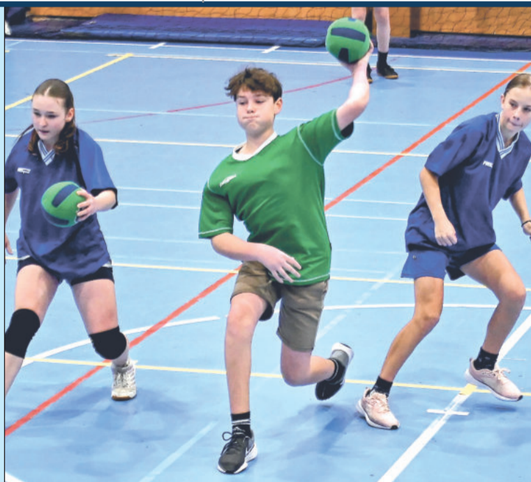
Dodgeballový maraton v Kopřivnici odstartoval turnaj základních škol, který hrálo ve dvou kategoriích deset smíšených družstev.