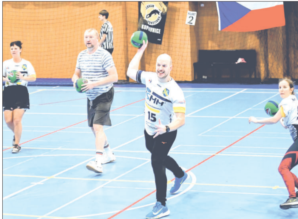
Dramatický starostův novoroční turnaj, na kterém bojovalo šest smíšených družstev, po zásluze opanoval tým ZŠ 17. listopadu.