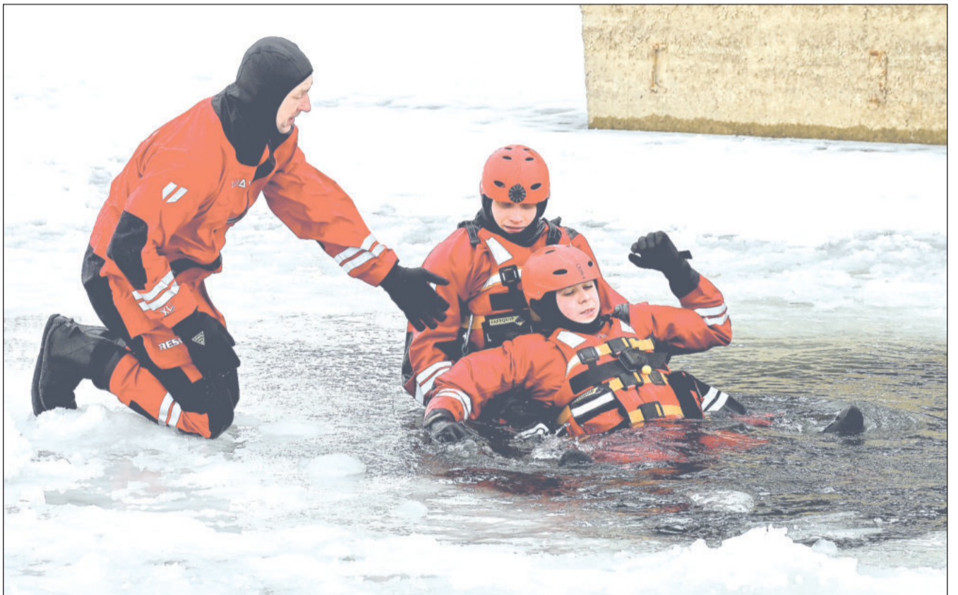
Kopřivničtí profesionální i dobrovolní hasiči využili mrazivého počasí k nácviku záchrany osob ze zamrzlé hladiny. Kromě různých technik vyzkoušeli také speciální vybavení. Více na straně 2