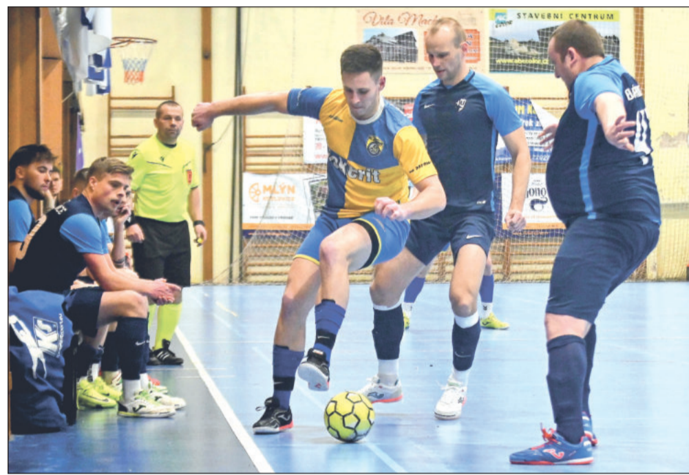
Pikantní kopřivnické divizní derby si přišlo užít přes 250 fanoušků dobrého futsalu, kteří nakonec viděli jen tři branky a těsnou výhru hostujícího Fučka (tmavší dresy).

Na první branku derby se čekalo do sedmé minuty, a přestože mělo míč více v držení Fučko, udeřilo na druhé straně.