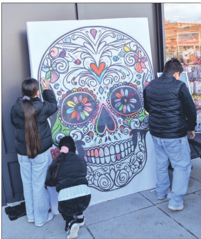
K výzdobě prostoru, kde se Fiesta v sobotu odpoledne konala, mohli přispět všichni její návštěvníci.

Kopřivnice (dam) – Stovky lidí si minulou sobotu užily první oslavu Día de los Muertos na Novém náměstí v Kopřivnici. Mexická obdoba našich Dušiček hýřila barvami, lidé se bavili hudbou, divadlem a pochutnávali si na španělské a mexické kuchyni. Akce se neodehrávala přímo na hlavní ploše náměstí, ale na ploše mezi výstavním pavilonem s gastro zónou a plochou pod schody. Díky tomu získala Fiesta příjemně kompaktní charakter a lidé byli neustále v centru dění. Atmosféru umocňovala tematická výzdoba, mexický oltář předků ve výstavním pavilonu i množství lidí, kteří dorazili v maskách a kostýmech nebo si na místě nechali typické motivy namalovat na obličej. Pouze projekce animáku Coco byla z technických důvodů přesunuta do KDK.