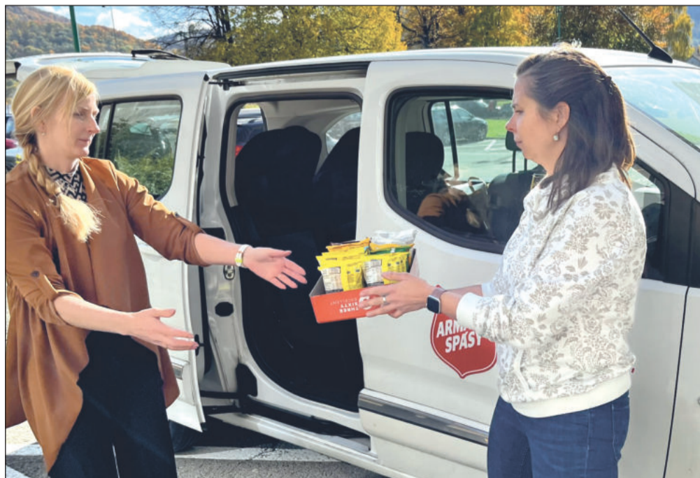
Před týdnem byly předány zástupcům kopřivnické pobočky Armády spásy ČR potraviny a hygienické potřeby, které byly nasbírány na radnici za pomoci hasičů.

Podpořit potřebné budou moci všichni v sobotu 8. listopadu, kdy probíhá celostátní sbírka potravin. Zapojit se do ní a podpořit organizace pomáhající potřebným bude možné v Kopřivnici v supermarketech Kaufland a Tesco. Zároveň v Kauflandu budou dobrovolníci z místní pobočky Armády spásy, z Tesca půjde pomoc do Charity Frenštát pod Radhoštěm.