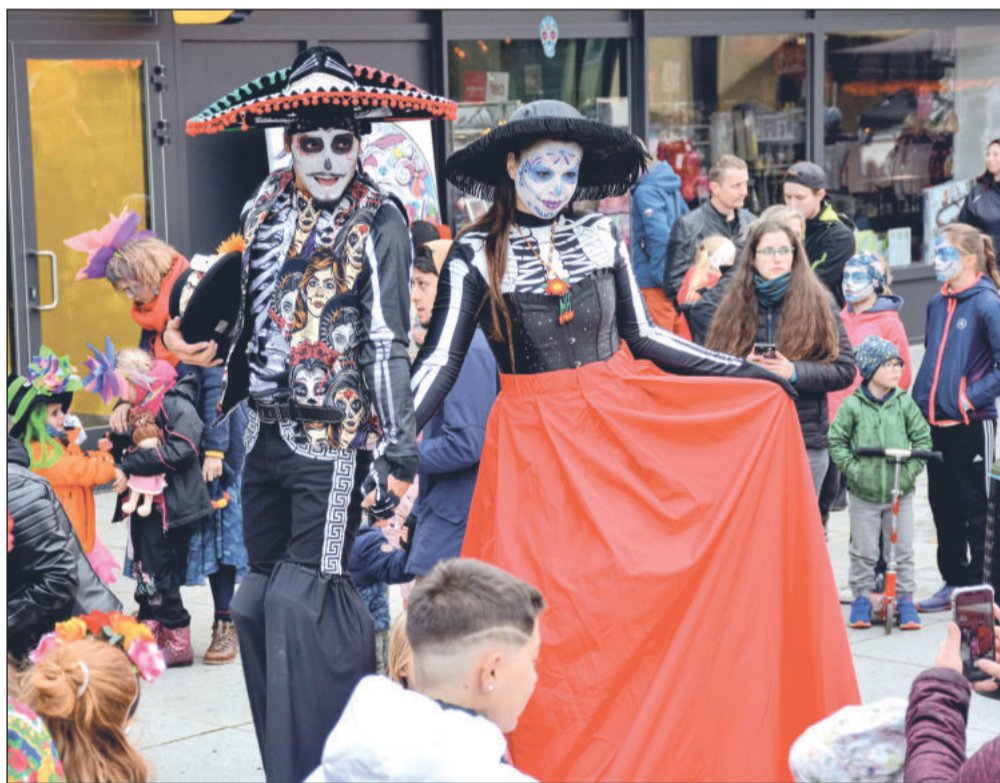
Příjemným tematickým zpestřením programu bylo i vystoupení chůďařů, kteří se v kostýmech ochotně fotili s příchozími.