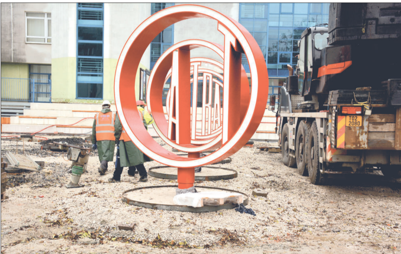
Pět bezmála dvoutunových kruhů s písmeny dohromady tvořícími logo Tatra bylo v závěru minulého týdne instalováno před vstupem do muzea osobních automobilů. Dokončení úprav prostranství se očekává v lednu.

Rozjíždějící se rekonstrukce zahrnuje kompletní přestavbu celého areálu. Po dokončení nabídne Kopřivničanům i návštěvníkům moderní sportovně-rekreační zónu splňující všechny současné hygienické i bezpečnostní požadavky. Hlavními prvky budou plavecký bazén o rozměrech 13 x 50 metrů se šesti drahami, splňující požadavky pro pořádání plaveckých závodů, a velký rekreační bazén o rozměrech 23,6 x 50 metrů. Letní vyžití u vody nabídne nový tobogán, skluzavky, dětské brouzdaliště, broditka a vodní herní prvky. Bazénové vany budou z nerezových plechů, a ten má mít pozitivní vliv nejen na jejich trvanlivost, ale usnadnit i jejich údržbu. (Pokračování na straně 2)