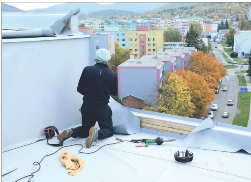
Oprava střechy bytového domu č. p. 891 bude nakonec o víc než 400 tisíc korun levnější, než se původně předpokládalo.

Kopřivnice (dam) – Aktuálně dokončovaná oprava střechy prvního výškového domu v Kopřivnici bude díky méněpracím o více než 400 tisíc korun levnější. Střecha domu č. p. 891 na ulici Obránců míru, který je ve vlastnictví města, prochází opravou za 2,4 milionu korun. V průběhu zakázky došlo k několika změnám. Například nebylo nutné odstranit všechny vrstvy střechy a spádová vrstva mohla zůstat zachována. Další významnou úpravou bylo upuštění od instalace stříšek nad balkony v nejvyšším patře. Jejich montáž by totiž vyžadovala lešení, což by předpokládalo cenu stříšek více než zdvojnásobilo.