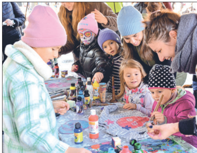
Součástí programu bylo i několik výtvarných workshopů. Děti si mohly například potisknout textilní trička a tašky.