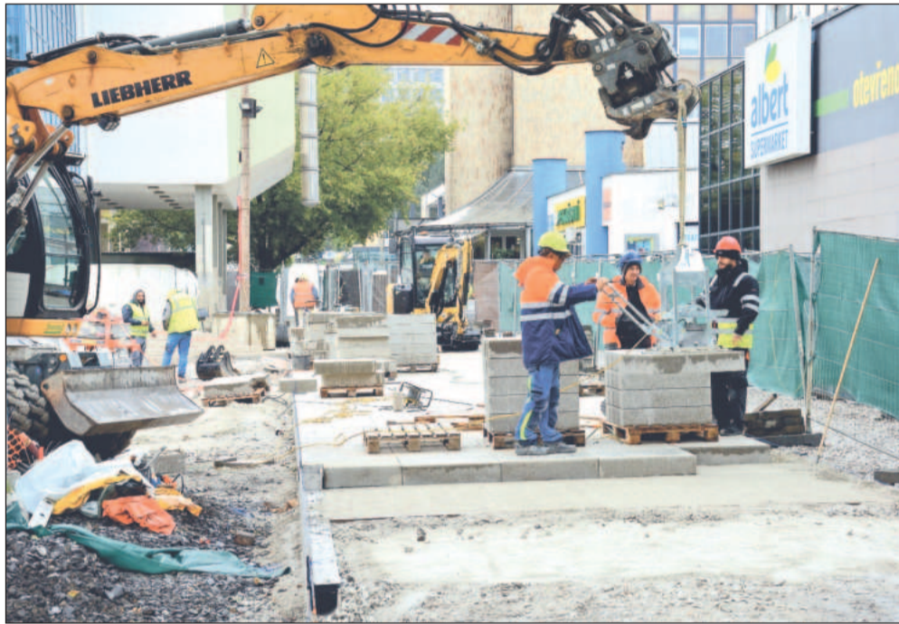
Úpravy projektu a stavby související s kryty pod objektem muzea jsou důvody, proč bude rekonstrukce předprostoru dokončena až v lednu následujícího roku.

Stavební firma se původně v souvislosti s celkem šestnácti změnami v projektu dožadovала prodloužení doby realizace stavby o 102 kalendářních dnů. S tím nesouhlasili zástupci investora ani technického dozoru a došlo k dohodě o prodloužení termínu o 62 dnů. Hotovo by tedy mělo být v polovině ledna 2026. Na stavbu město získalo dotace ve výši 22 milionů korun.