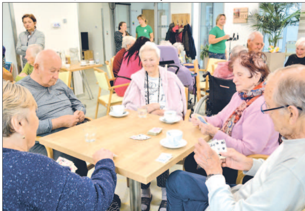
V Domově pod Bílou horou proběhla dobrovolnická akce s názvem KoprDobr, během níž kopřivničtí seniori společně strávili s klienty příjemné dopoledne.

Dobrovolníci z ADRY si chodí i povídat s lidmi, kteří pobývají v Theráponu na oddělení léčebny dlouhodobě nemocných, a také docházejí do chráněného bydlení Nanovo na ulici Záhumenní.