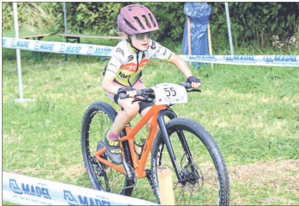
Devátý ročník „Drtíka“ se konal v Kopřivnici tradičně ve skautském centru Vanaivan, i přes změnu termínu měl závod velkou účast.