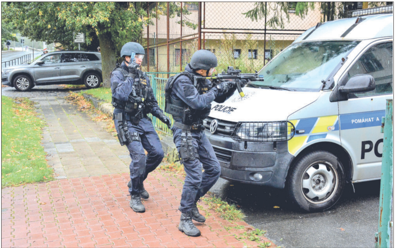
Objekt bývalé školy Náměstí se minulou středu stal dějištěm cvičení policejního zásahu proti aktivnímu střelci. V budově a jejím bezprostředním okolí cvičilo asi pět desítek policistů z celého Novojičnska.