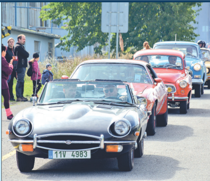
V Kopřivnici pořadatelé Svatováclavské jízdy udělili pohár nejstaršímu a nejvzdálenějšímu účastníkovi veteránské akce.

Kopřivnice (dam) – Víc než 130 položek měla startovní listina letošní Svatováclavské jízdy. Stovku historických vozů a několik desítek motocyklů si mohli lidé prohlédnout i v Kopřivnici, když si účastníci veteránského setkání, které se v našem regionu koná už patnáctým rokem, zastavili ve městě, aby si prohlédli Muzeum nákladních automobilů Tatra. Kolony veteránů navštěvují Kopřivnici pravidelně, ale Svatováclavskou jízdu charakterizuje největší pestrost startovního pole. K vidění byly vozy řady světových značek a také technika různého stáří. Nejstaršími kusy byla Tatra 12 a motocykl Praga 350, oba z roku 1930, ty ale jely například vedle Škody Favorit, která se ještě tu a tam objevuje v běžném provozu.