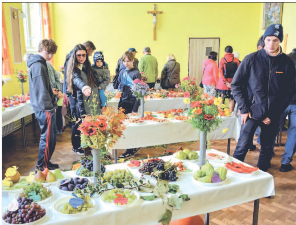
V neděli proběhla v Katolickém domě v Lubině tradiční výstava tamních zahrádkářů, na které nechyběly tradičně ani houby a květinové vazby.

Kriminalisté současně prováděli výsledky zhruba pětáctičti figurantek z řad studentek střední zdravotnické školy. Figurantky měly za úkol předávat vyšetřovatelům různé indicie, na základě kterých pak policisté činili další úkony. Podobná cvičení probíhají zhruba dvakrát ročně. Letos už policisté trénovali například i na Okresním soudu v Novém Jičíně, kde se do akce zapojilo na dvě stě figurantů.