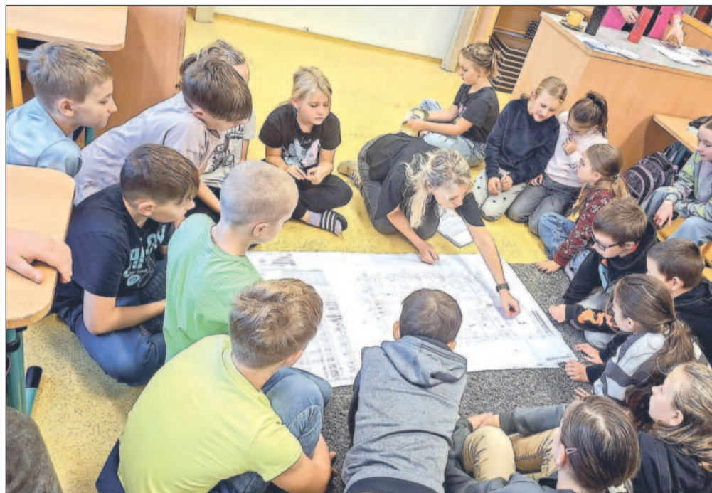
Během speciálního vzdělávacího programu mohli žáci ZŠ Lubina poznat některá specifika práce architektů.