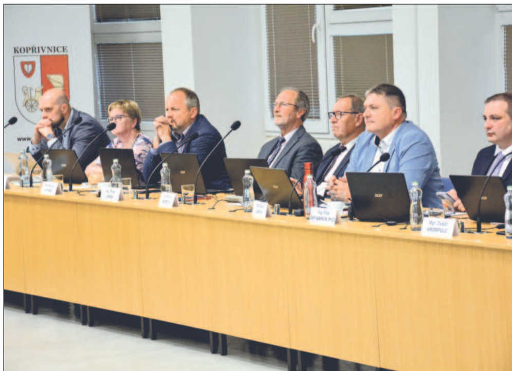
Zastupitelé před týdnem schválili nejen úpravy koeficientů pro výpočet daně z nemovitosti, ale i změnu podmínek dotační podpory sportu ve městě.

Pokud mají nemocní či jinak nepohybliví občané zájem, aby je navštívila volební komise s přenosnou volební schránkou, mohou požádat příslušnou okrskovou komisi prostřednictvím svých rodinných příslušníků nebo sousedů, nebo mohou volat v době voleb přímo volební komisi. „Telefonní čísla na jednotlivé volební okrsky budou zveřejněna na webových stránkách města. Doporučuji dohodnout se s příslušnou volební komisí v průběhu prvního dne, aby si volební komise mohla navštívit voličů v domácnosti zorganizovat,“ uvedla Jana Sopuchová.