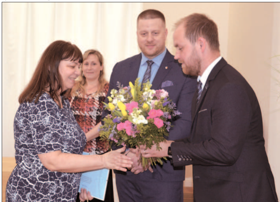
Před týdnem proběhlo tradiční ocenění pedagogických pracovníků za jejich práci. Součástí ceremoniálu bylo i poděkování dvěma končícím ředitelkám škol.