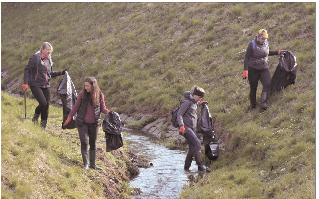
V minulém týdnu se občané, organizace i spolky zapojili do celostátní dobrovolnické akce Uklidme Česko. Uklízelo se v přírodě nejen ve městě, ale i v místních částech.