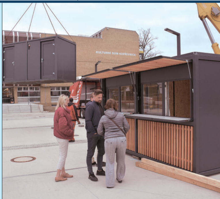
Od minulého týdne jsou v centru Kopřivnice instalovány dva multifunkční stánky.