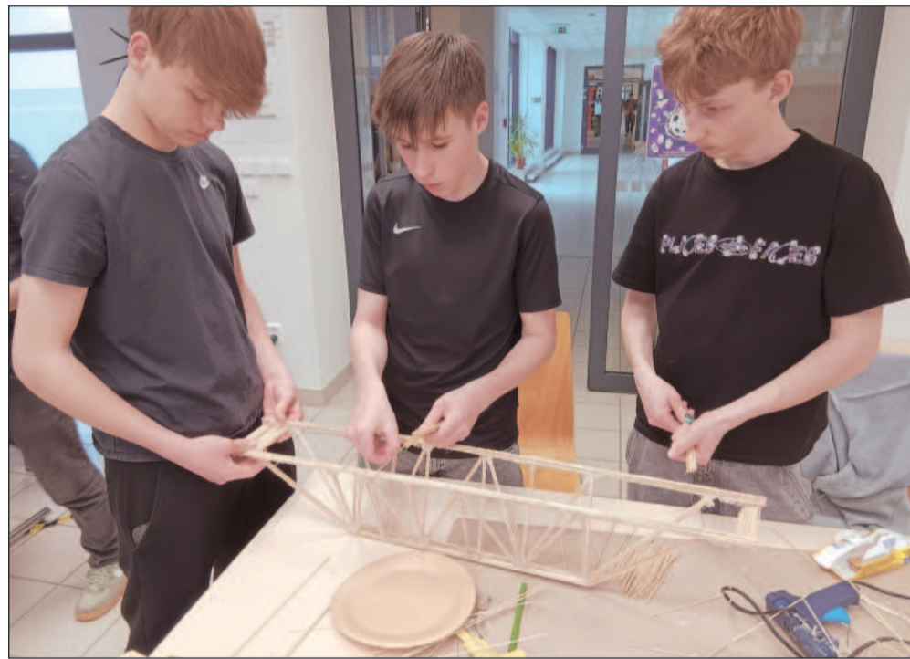
Žáci devátého ročníku ZŠ Alšova postavili na půdě ostravské VŠB-TUO nejpevnější most ze špejli. Vydřel pětaticetkilogramovou zátěž.