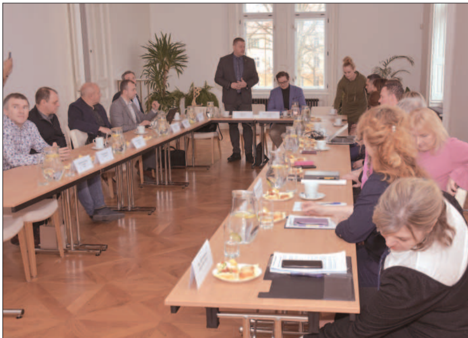
V pátek se sešli v Ringhofferově vile zástupci radnic kopřivnického ORP. Na programu jednání byla aktuální agenda i možnost budoucí užší spolupráce.