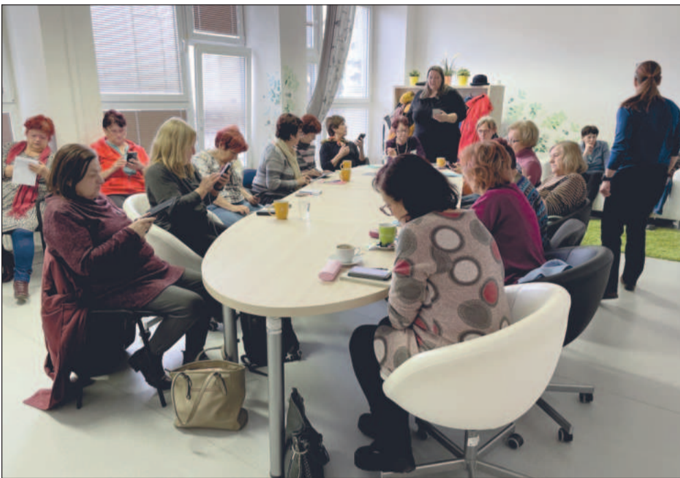
Osmnáct seniorů přišlo na první kurz, v němž se pod vedením dvou lektorek učili pracovat s chytrým mobilem.

Názory publikované v textu nemusejí být v souladu s názory redakce.