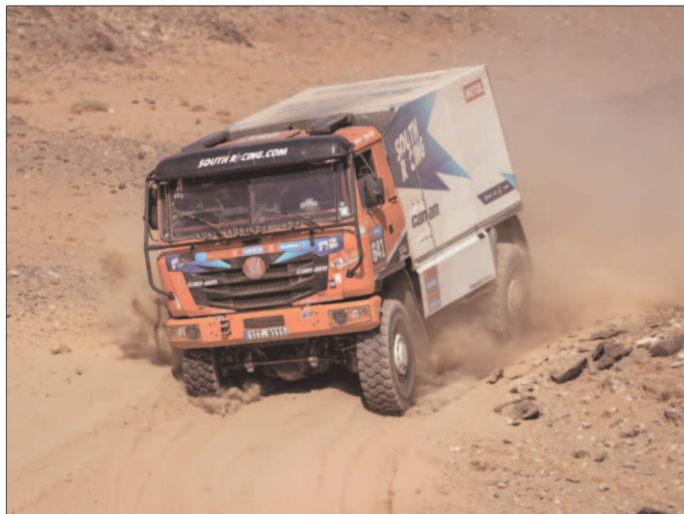
Tomáš Tomeček se svou Tatro 815 na trati Rally Dakar 2025, kde jeho tým bravurně zvládl roli rychlé asistence pro tým South Racing.

„Naše Tatra 815 už není nejmladší, ale zvládla to skvěle. Máme tam nějaké praskliny na korbě a pár dalších věcí, ale všechno se to dá opravit. Teď dáme vše dohromady, převažíme, vyztužíme, nalakujeme – zkrátka vše při-