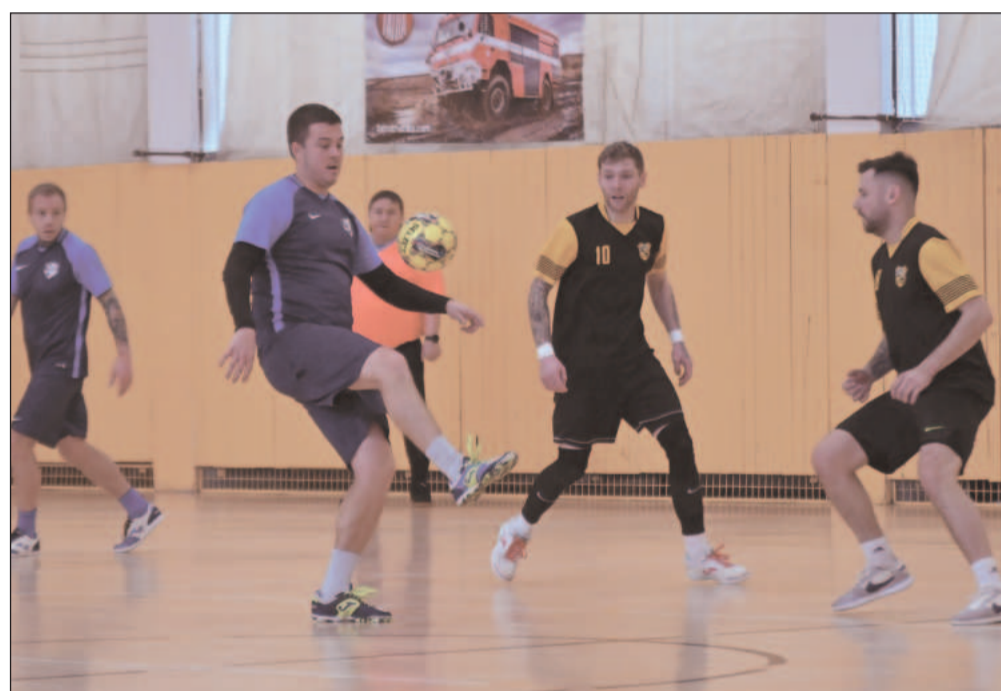
Futsalisté FU Kopřivnice C (modré dresy) na závěr sezony v 1. okresní třídě vyhráli dva ze tří zápasů. V tomto duelu porazili Wespen Nový Jičín 2:1.

V I. okresní třídě je jediným zástupcem tým FU Kopřivnice C, který se celou sezonu drží v horní polovině pořadí, ale osmé kolo týmu nevyšlo dle představ. Nejprve to byla prohra s Frenštátem a potom i s vedoucím Libhoštěm. V závěrečném 9. kole (hrálo se ještě 10. kolo bez účasti FU Kopřivnice C) hrálo céčko Fučka tři zápasy a hned dvakrát zvítězilo, když porazilo týmy z popředí tabulky Wespen Nový Jičín a Jethro Zašová, jediná porážka dne přišla až ve třetím duelu s SKP Frýdek Místek. V konečné tabulce skončilo céčko Fučka na čtvrtém místě. V nejnižší 2. okresní třídě hrají dva kopřivnické týmy