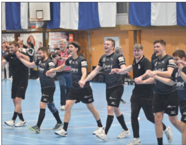
Kopřivnickí házenkáři otočili čtvrtfinále s Duklou Praha a po 29 letech postoupili do semifinále extraligy.

Bylo schváleno memorandum s městem Štramberk na přípravě a realizaci úprav křižovaty pod Palárnou, které se mají uskutečnit v letošním roce.