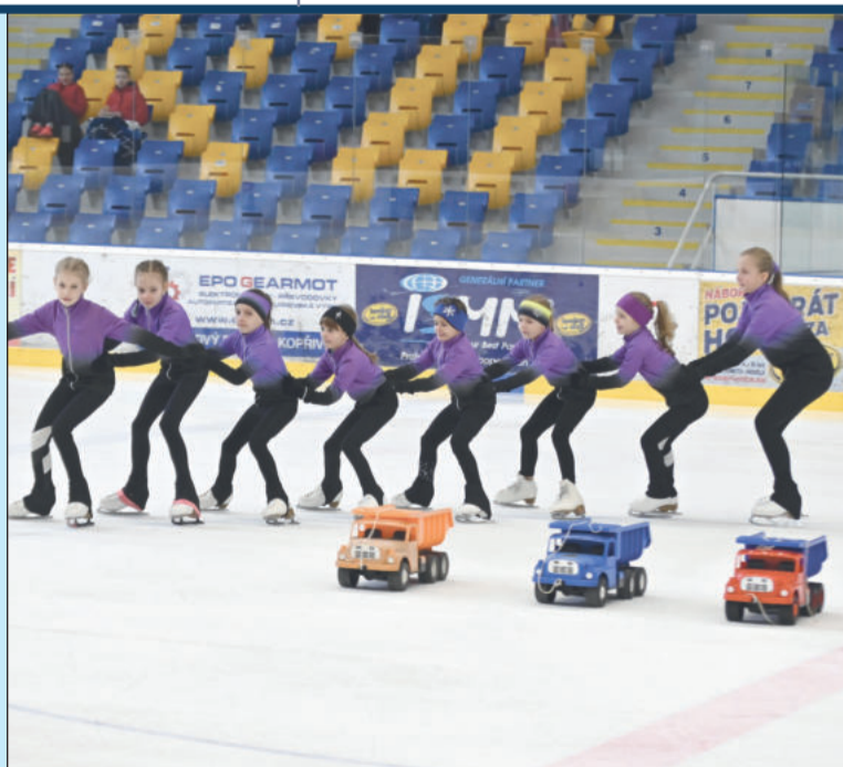
Při zahájení Tatra Cupu hrály prim modely (hračky) automobilů Tatra, na snímku s malými krasobruslařkami FSC Kopřivnice.