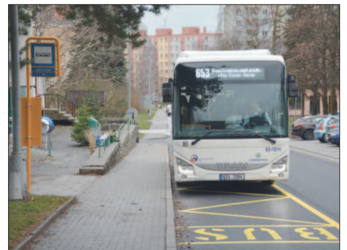
Před koncem roku začal zkušební provoz autobusových linek, které mají částečně nahradit plnohodnotnou MHD.

Součástí připomínky letošního 35. výročí listopadových