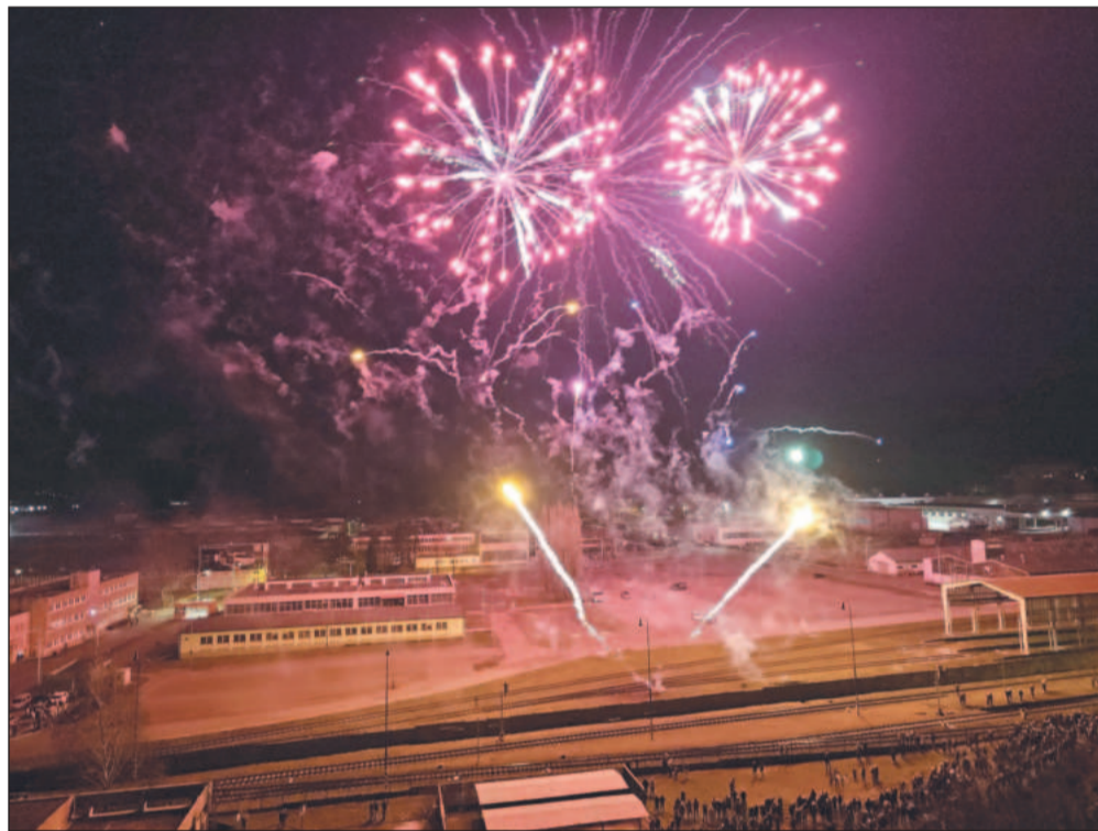
Oficiální novoroční ohňostroj byl prvního ledna odpálen tradičně z areálu Tatry. Hasiči se potýkali s drobnými požáry způsobenými pyrotechnikou v rukou amatérů.

Jen pár minut po příchodu Nového roku strážníci postupně obdrželi hlášení o kouři, které způsobily požáry. Před příjezdem hlídky byly všechny požáry hasiči zlikvidovány. Krátce před druhou hodinou ranní obdrželi strážníci oznámení, že v restauraci Mates muž napadá další hosty. Na místě strážníci zjistili, že opilá skupinka osob se hádala a postrokovala. Protože nedošlo ke zranění, nikdo nechtěl nic řešit. Novoroční ohňostroj v 17 hodin opět vyvolal poplach. Na Nový rok ve 21:20 volal na stálou službu MP člověk, který oznámil, že k jeho vozidlu přiběhl muž s sátkem přes obličej a vyhrožoval mu. Hlídka podle popisu muže našla a zjistila, že měl krvavé zranění, nabízené ošetření ale odmítl.