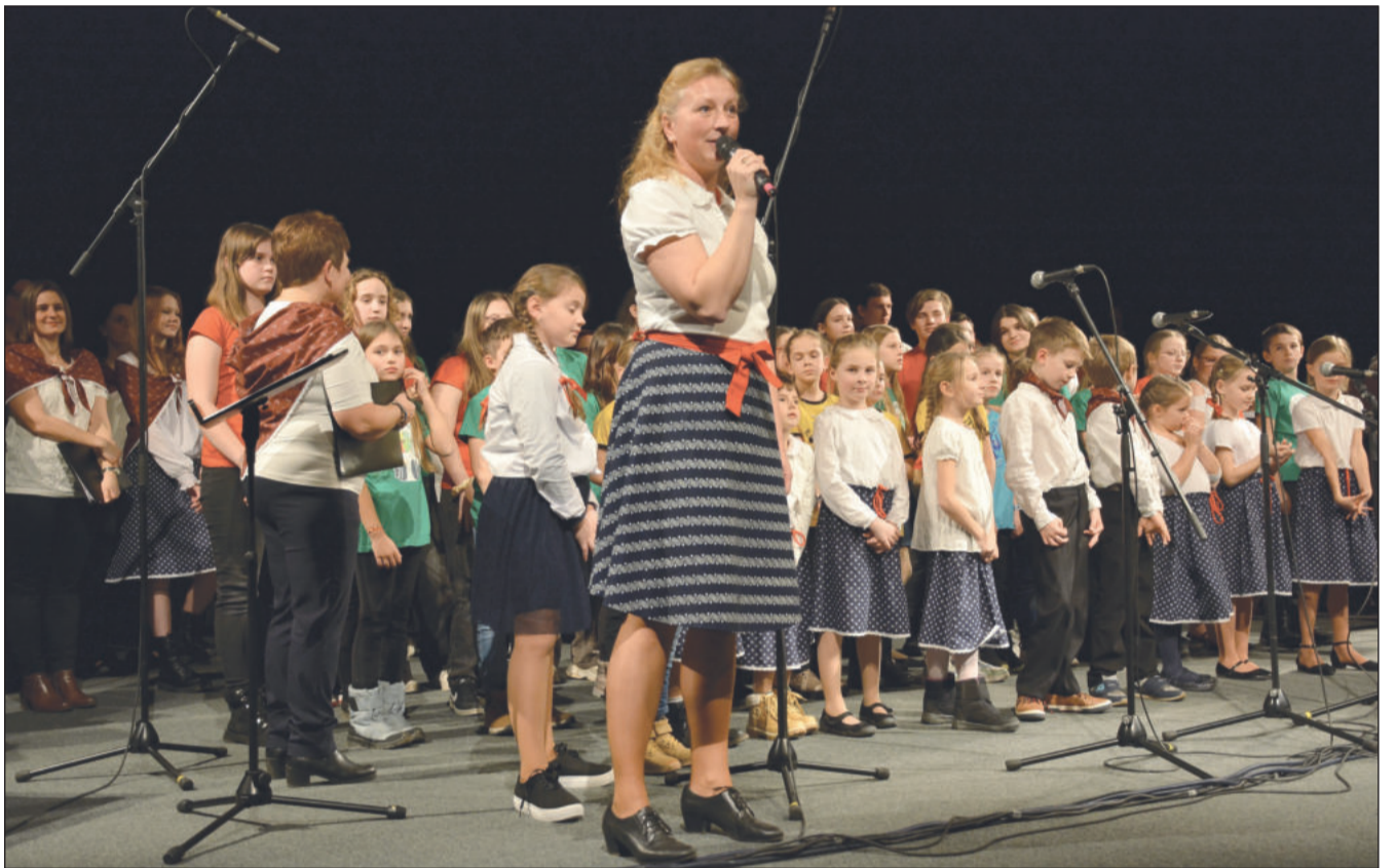
Na závěr Tříkrálového hudebního večera v kulturním domě byl pokřtěn zpěvník Příběželi do Betlema pastýře obsahující čtyřadvacet regionálních koled a žertovných písní. Více informací o celém projektu přineseme v příštím čísle KN.