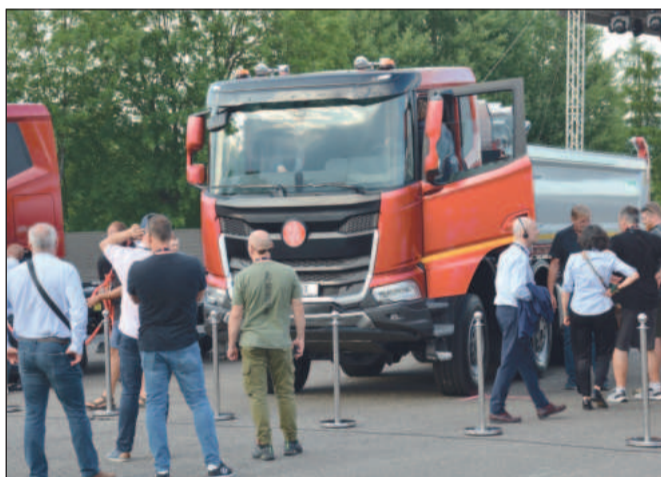
Po 13 letech premiéry od původní verze představila automobilka Tatra modernizovaný Phoenix.

V místním muzeu nákladních automobilů pokřtili 7.