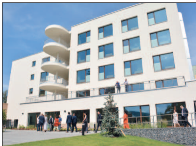
V polovině roku se Kopřivnice po letech dočkala otevření domova pro seniory.

Zastupitelé se dlouze přeli o navýšení rozpočtu na přestavbu schodiště do kulturního domu. Koalice a opozice se shodly na vysoké ceně, ale roz-