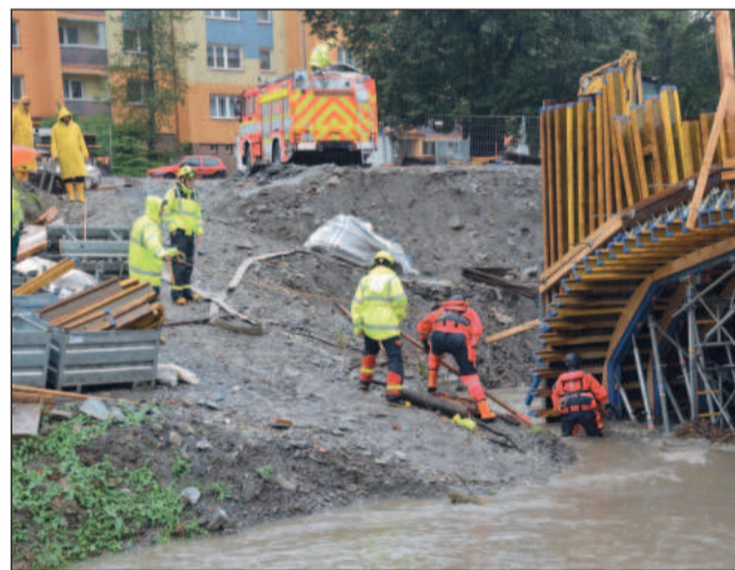
Ničivě povodně se nevyhnuly ani Kopřivnici. Obavy byly například o rozestavěný most na Erbenově ulici.

Více než tři desítky jednotlivců a k tomu dvojice i vícečlenné týmy se vydaly na kopřivnický Everesting 2024, akci, která se vrátila do sportovního kalendáře po třech letech a konala se na Červeném kameni.