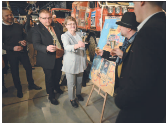
U příležitosti nedožitých pětasedmdesátin Karla Lopraise vydala pošta známku, kterou pokřtili ve zdejším muzeu.

V Kopřivnici začal fungovat bikesharing. Provozovatel Nextbike nabídl 75 kol na 30 stanicích. Prvních 30 minut mají obyvatelé zdarma. Stanoviště se sdílenými koly byla vytvořena u škol, sportovišť, obchodů i v místních částech. Služba, přístupná prostřednictvím mobilní aplikace, se rychle stává oblíbenou. Cílem projektu je snížit přepravní časy i počet aut ve městě.