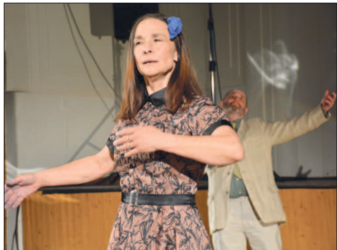
Cenu pořadatelů Kopřivy si odvezlo Studio G za inscenaci Molly Sweeney.