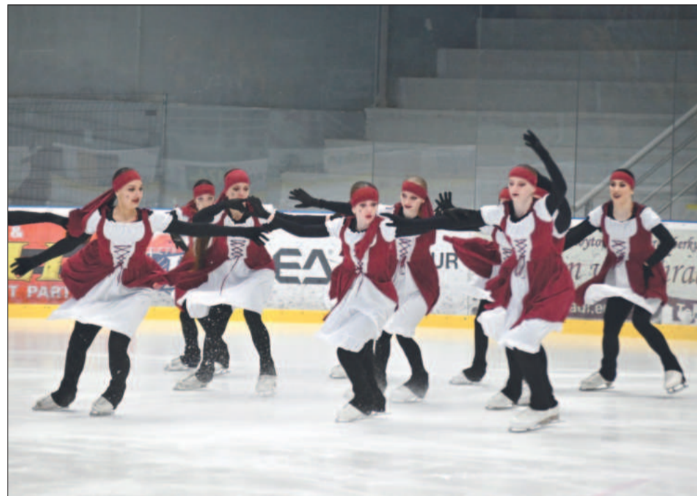
Kopřivnický tým Black Angels předvedl krásnou choreografii na hudbu z filmu Piráti z Karibiku a po zásluze s velkým náskokem zvítězil v kategorii Mixed age.

Velkou radost jemu i fanouškům na zimním stadionu udělal i druhý kopřivnický tým, který soutěžil v kategorii Adults, kde startují dospělí nad 26 let. Patnáctičlenný kopřivnický tým Angels Gang, ve kterém jsou také tři muži, se zaskvěl třetím místem, když bronz vybojoval s neskutečně malým rozdílem pouhých tří setin bodu. „Třetí místo je o to cennější, že oproti většině soupeřů máme téměř výhradně čistě amatérský tým nadšenců,