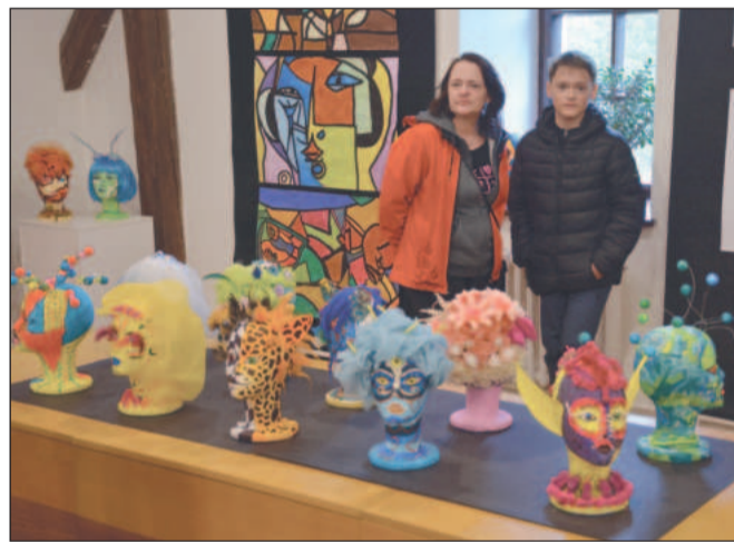
Velká výstava v Muzeu na Fojtství byla první z akcí, kterou si ZUŠ Zdeňka Buriana připomněla několik kulatých výročí.

Domov pod Bílou horou v Kopřivnici začal s příjmem žá-