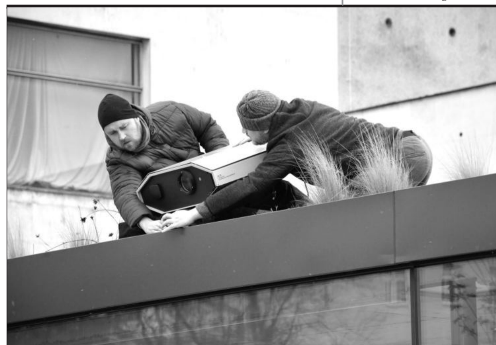
Součástí letošní vánoční výzdoby bude i videomapping promítaný na bok Lašské brány. Před týdnem proběhla instalace speciálního outdoorového projektoru na výstavní pavilon.