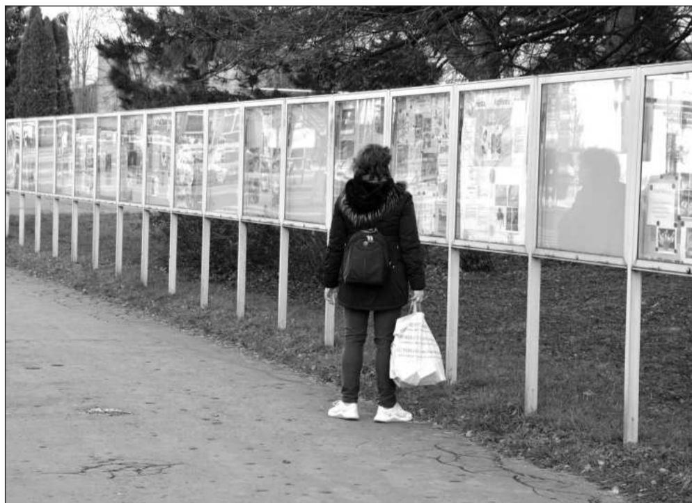
Od Nového roku se mění systém výběru nájemců vitrín na Štefánikově ulici. Zcela zmizet mají prezentace politických stran.

Alzheimer Home Kateřinice funguje teprve od března, ale už pomáhá sedmi osobám s trvalým pobytem v Kopřivnici. Stejná služba v Ostravě má dva kopřivnické klienty a byla jí poskytnuta desetitisícová neinvestiční dotace. Společnosti pro ranou péči, jejíž služby pro děti se zrakovým a kombinovaným zrakovým postižením využívají dvě místní rodiny, poslalo město 8 tisíc korun.