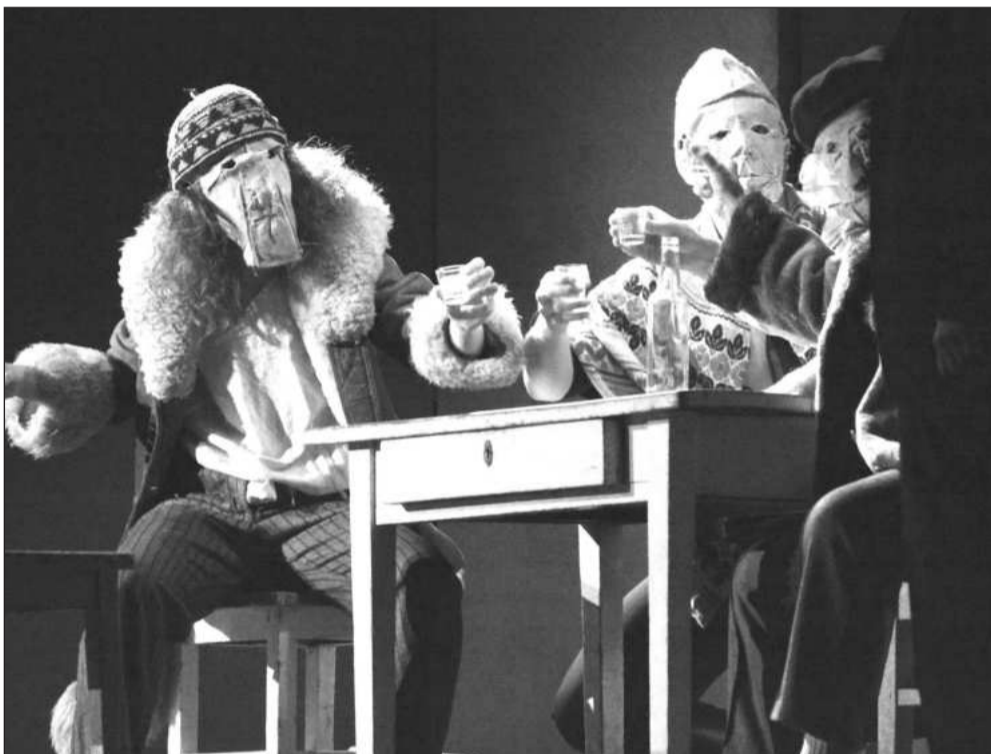
Dramatizace Hordubala Karla Čapka v podání ostravského Studia G zahájila minulý týden letošní předplatitelskou sérii kulturního domu.