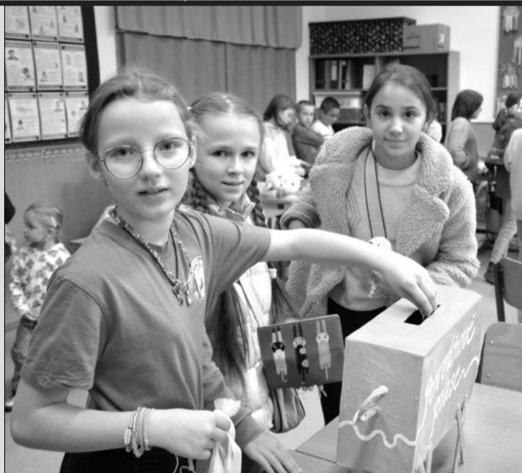
Účastníci charitativního prodeje mohli do sbírky přispět zakoupením vybrané věci nebo vhodit do prasátka hotovost.

Podnět na realizaci dvouměsíčního projektu s několika akcemi vzešel od učitelky Evy Nedjalkové. „Na konci září jsme se s kolegyněmi domluvíly na dlouhodobé akci, že během dvou měsíců, od poloviny října do vánočního jarmarku, který se uskuteční v polovině prosince, uděláme několik akcí a výtěžek ze všech půjde na pomoc zaplavené škole,“ uvedla učitelka Eva Nedjalková. (Pokračování na straně 2)