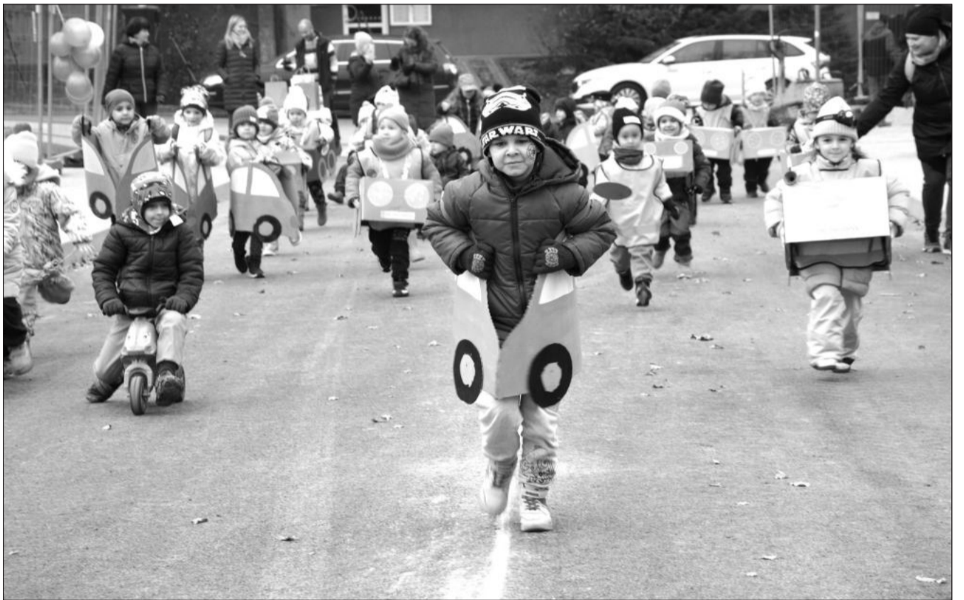
Jako první otestovaly nový most přes Kopřivničku na Erbenově ulici děti z blízkých mateřských škol Ignáce Sustaly a Záhumenní. Pro slavnostní otevření mostu, které proběhlo v pondělí před polednem, si vyrobily originální autička.

Město prováděcí firmě FIRESTA-Fišer, rekonstrukce, stavby, a. s., za demolici původního mostu a stavbu nového zaplatí konkrétně 16 103 507 korun, přestože během bouracích prací byl odhalen betonový základ pod původním kamenným obkladem koryta řeky, který musel být odbourán a suť odvezena na skládku. (Pokračování na straně 3)