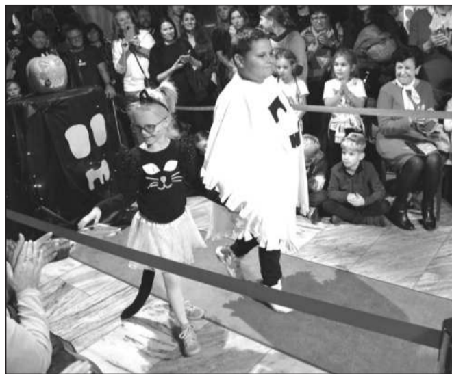
V přestávce sobotního galaprogramu proběhla tradiční módní přehlídka, která se těšila obrovskému zájmu diváků.