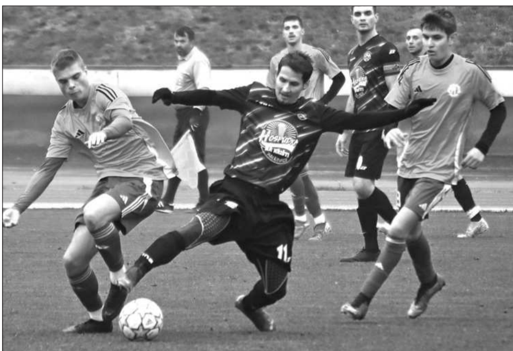
Fotbalisté Kopřivnice (světlejší dresy) se proti Palkovicím pomaleji rozjíždějí, ale nakonec převládají a zakončili tak podzim třibodovým ziskem.

Kopřivnice (mha) – Jasným vítězstvím se rozloučili s podzimní částí fotbalisté Kopřivnice. V dohrávaném 7. kole 1.A třídy, které se v září plošně odložilo kvůli povodním, Kopřivnice porazila Palkovice 4:0.