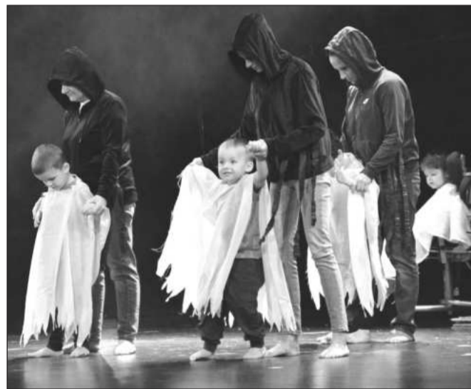
Jedním z programů, který připravili na pořádatel ZŠ a MŠ Motýlek, bylo vystoupení nazvané Město duchů.