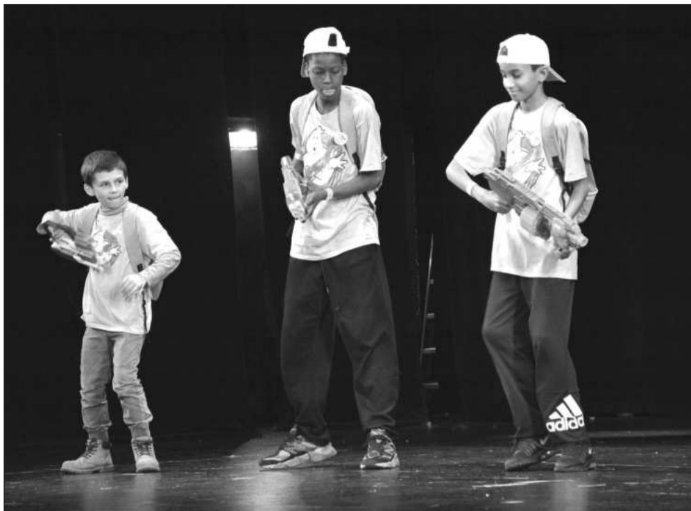
S vystoupením na ústřední píseň z legendární komedie Ghost Busters přijeli na Motýlka žáci navštěvující Itep De La Boissiere z partnerského Trappes.