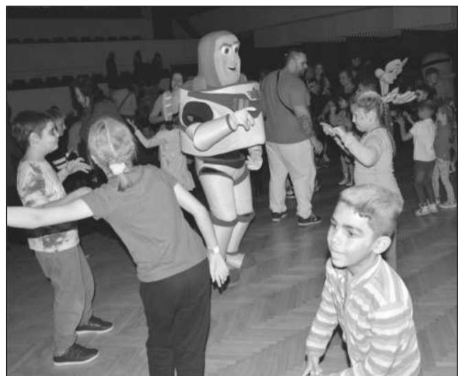
Na páteční diskotéce pro aktivní účastníky Motýlka se k velké radosti děti objevily i postavičky z animovaných filmů.