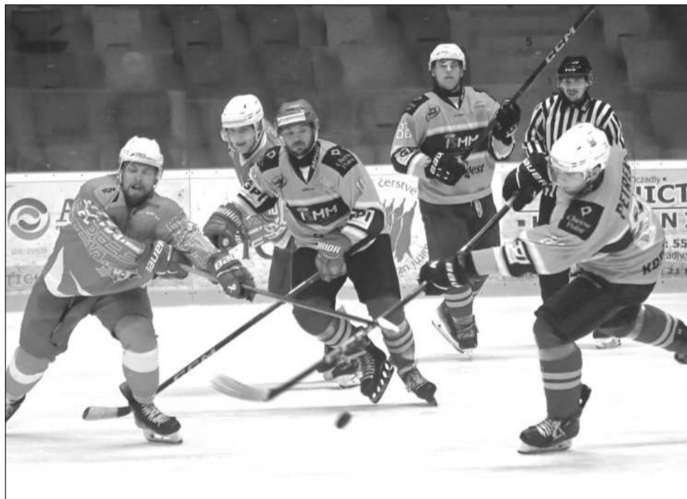
Hokejisté Kopřivnice (světlejší dresy) v tomto utkání s Opavou po divokém průběhu zvládli krátce před koncem vyrovnat a nakonec v nájezdech urvali vítězství.

Pětiminutové prodloužení hrané tři na tři již klasicky nabídl divočinu nahoru dolů a více gólovek než za celý předchozí zápas, ale oba gól-