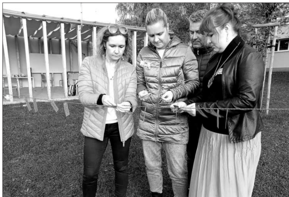
Účastnice semináře Učení venku, který proběhl v rámci MAP, si mohly samy vyzkoušet tento způsob výuky ve venkovní učebně v ZŠ Petřvald.

Do Vánoc se uskuteční i akce pro rodiče, a to seminář na téma Sociální síť. Ten by měl proběhnout začátkem prosince. Přesné informace budou prezentovány nejen v médiích, ale i prostřednictvím škol. „Vzdělávacích akcí, pořádaných v rámci MAP IV, už od září do října proběhlo 15, do nich se zapojilo přes 170 dětí a žáků a přes 90 učitelů mateřských i základních škol napříč územím. Důležitým aspektem není jen počet, ale také kvalita vzdělávacích a rozvojových programů, na kterou klademe v projektu zásadní důraz,“ dodala Eva Kytková s tím, že akce mohly proběhnout díky tomu, že projekt MAP IV je spolufinancován Evropskou unií.