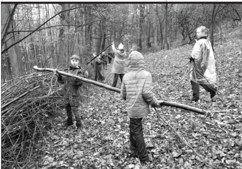
Skauti a skautky během sobotní brigády vyklidili část vyřezaných dřevín, které vyrostly v prostoru zaniklé samoty U Hurských.