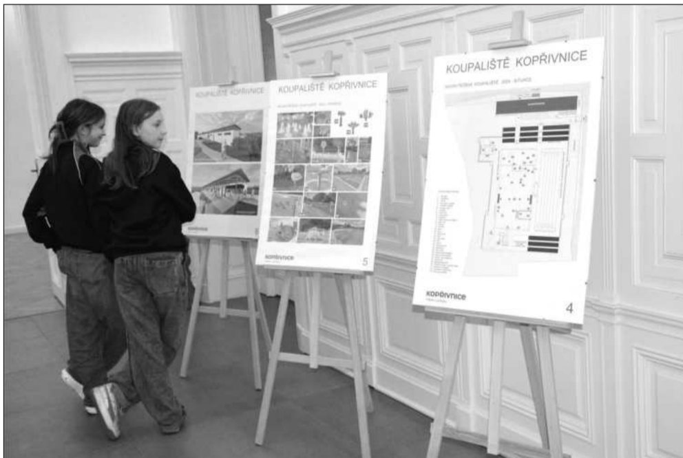
Před veřejným projednáním si lidé mohli prohlédnout vizualizace budoucího letního koupaliště.