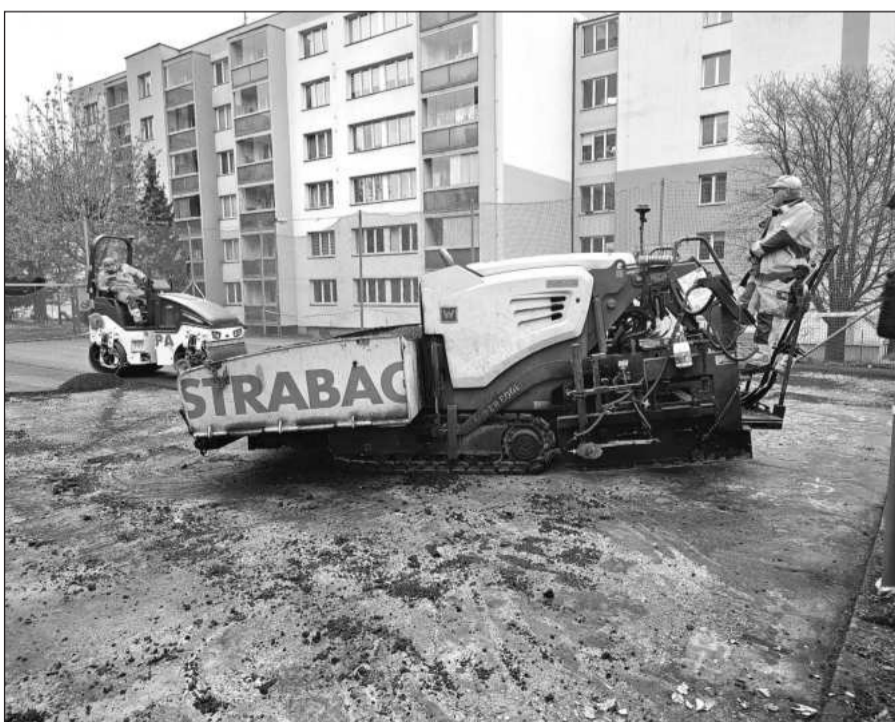
Zpevněný sportovní plácek na ulici Pod Zahradami se v minulém týdnu dočkal nového povrchu.