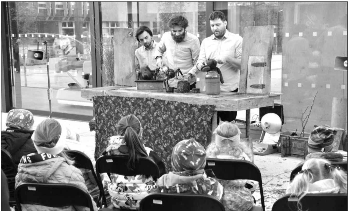
Státní svátek letos Kopřivnice slavila i jinak než tradičním kladením kytic u pomníku TGM. V centru města byl odpoledne připraven výtvarný workshop, následovalo loutkové představení Kde budeme bydlet v podání Divadla vi.TVOR a po něm proběhl ještě krátký koncert Městského dechového orchestru Kopřivnice.