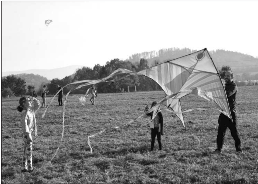
Zhruba 150 lidí a čtyři desítky draků využili krásného větrného počasí a sešli se na tradiční Vlčovické drakiádě.

pouze v instalaci dopravních značek, případně namalování vodorovného dopravního značení a instalaci označků čtyř zcela nových zastávek. Počítá se s novou zastávkou u ulice Družební, další nové zastávky vzniknou na ulici 17. listopadu, Ke Koryčce a Školní, při jejich navrhování radnice kromě dobré dostupnosti hledala také místa, kde nebude třeba rušit parkování. Kromě čtyř nově vyznačených zastávek budou autobusy zastavovat na dalších šesti stávajících zastávkách ve městě, jako jsou Čs. armády, Kolonie, počítá se se zastávkou na ulici Francouzské, u Kaufluandu nebo železniční stanice.