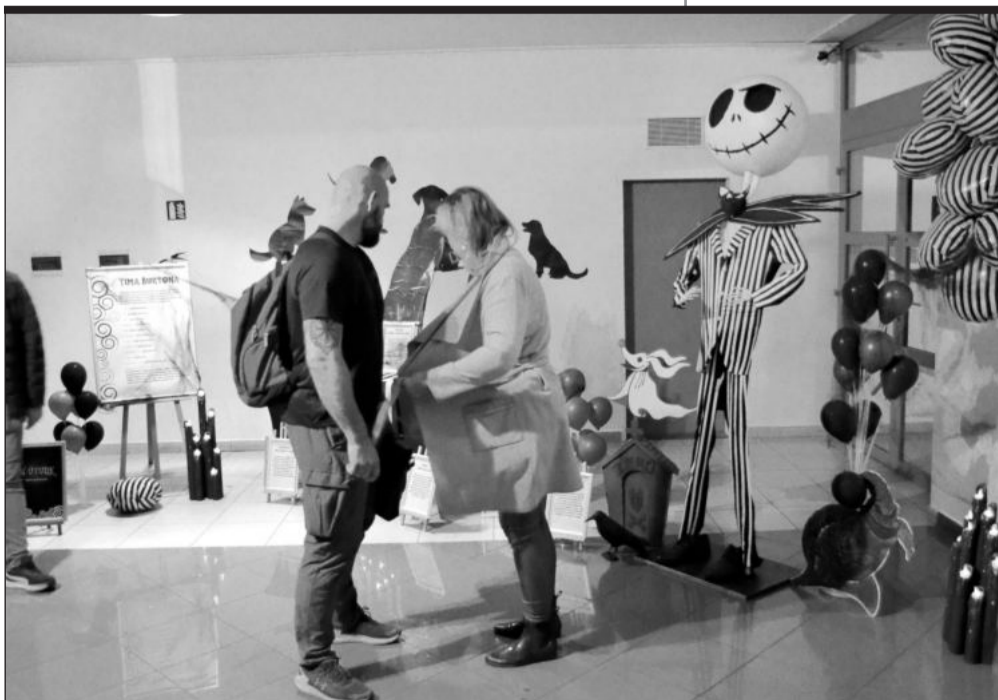
Víkendový filmový maraton v kopřivnickém kině lákal nejen na samotné projekce, ale také na originální výzdobu, kterou pořadatelé připravovali víc jak dva měsíce.