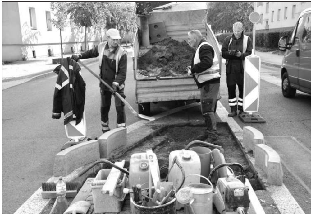
Ostrůvek u jednoho z přechodů na ulici Obránců míru musel být zkrácen, aby se usnadnil výjezd autobusů, které budou zajišťovat kopřivnickou MHD.