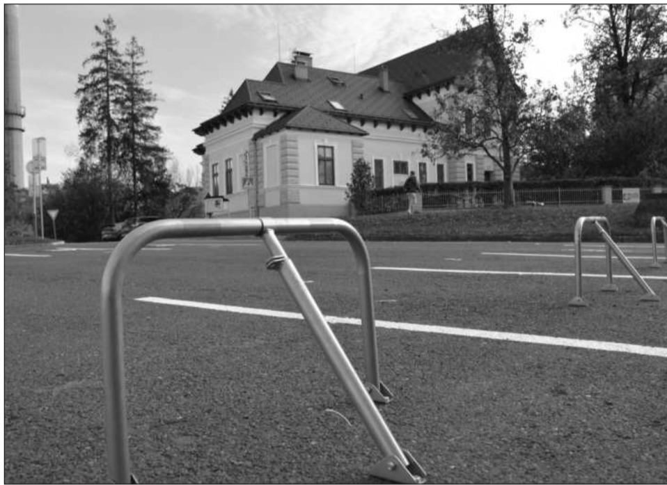
Parkoviště v sousedství výpravní budovy autobusového nádraží bylo nalajnováno a opatřeno vstupními zábrany. Dopravní firma jej plánuje pronajímat.