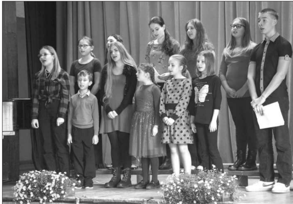
Součástí programu 25. ročníku kopřivnické přehlídky pěveckých sborů byl i dětský sbor Gaudium, působící při soukromé základní umělecké škole MIS music.

Kopřivnice (dam) – Už 15. října byl ukončen prodej abonentních vstupenek na divadelní předplatné kulturního domu. Hned následující týden byl zahájen prodej vstupenek na jednotlivá představení z nabídky představené během léta. Lidé mohou vybírat ze šesti představení, která se uskuteční v nepravidelných termínech od listopadu do května. Zdá se, že zatím největší zájem publika vyvolala životopisná koláž Špinarka z repertoáru ostravského Divadla Petra Bezruče. Na dubnové představení v Kopřivnici je k dispozici už jen několik desítek vstupenek. Lidé se ve větším množství chystají i na představení Zkušeni Havliští, se kterým budou herci Divadla Kalich hostovat v Kopřivnici ke konci dubna. Na další představení je zatím stále k dispozici zhruba polovina míst v hledišti. Lidé mají z čeho vybírat – na březven plánovaná komedie Pusťte mě ven slibuje například setkání s legendou tuzemského divadla Ivou Janžurovou. Úvodní listopadový Hordubal nabídne dramaturgii čítankového dramatu Karla Čapka. V únoru kulturní dům přiveze představení oceňovaného ústeckého Činoherního studia Hanzelkazikmund a atraktivní je i poslední titul sezony, komedie Fichtl s Pavlem Liškou a Michalem Isteníkem. Vstupenky za 480 nebo 450 korun jsou v předprodeji k dispozici jak on-line na stránkách kulturního domu, tak v informačním centru v přízemí kulturního domu.