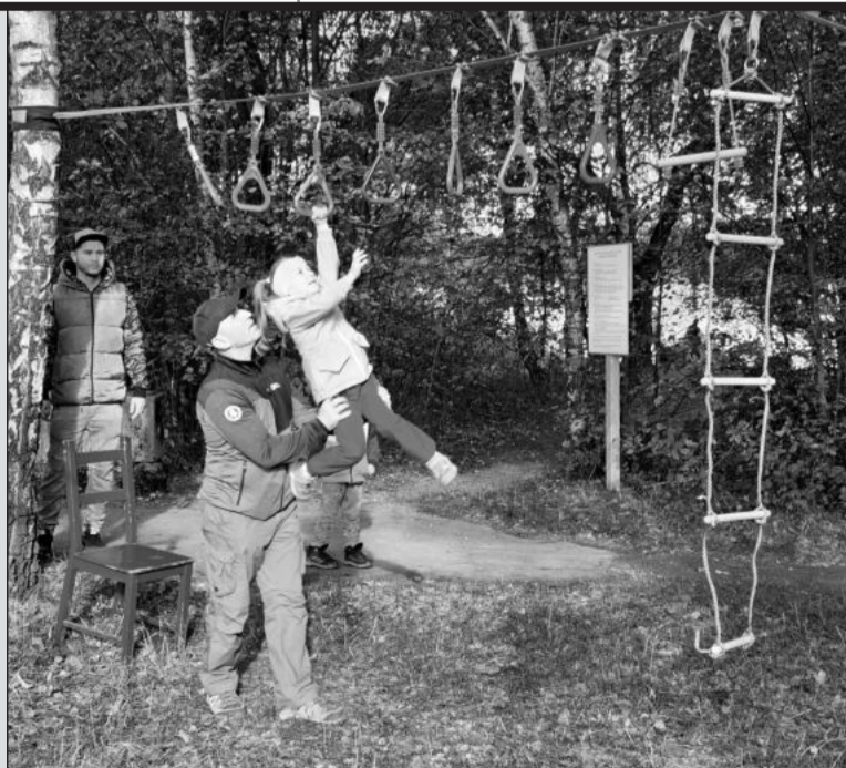
Součástí Dobrodružné stezky byly i překážky, které menší děti zdolávaly za pomoci rodičů.

Větrkovice (dam) – Asi 300 dětí s doprovodem si minulou sobotu užilo Dobrodružnou stezku. Tříkilometrový okruh v okolí Větrkovické přehrady s osmi zastaveními připravili organizátoři z ASK Tatra Kopřivnice. Pro účastníky stezky byly připraveny jak fyzické výzvy, jako ručkování po závěsích natažených mezi stromy nebo zdolávání svahu za pomoci lana, tak úkoly změřené na postřeh nebo prověřující znalosti přírody. Všechny úkoly byly navíc připraveny ve dvou variantách obtížnosti, což je činilo zábavnými jak pro nejmenší, tak odrostlejší děti. V cíli pak přichází čekala nejen sladká odměna, ale také tvořivé aktivity či možnost nechat si pomalovat obličej.