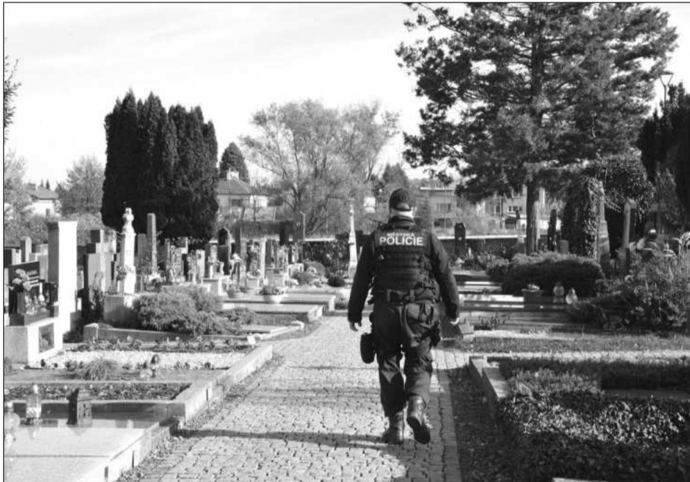
V období Dušiček budou na hřbitovech častěji hlídkovat jak strážníci městské policie, tak státní policisté.