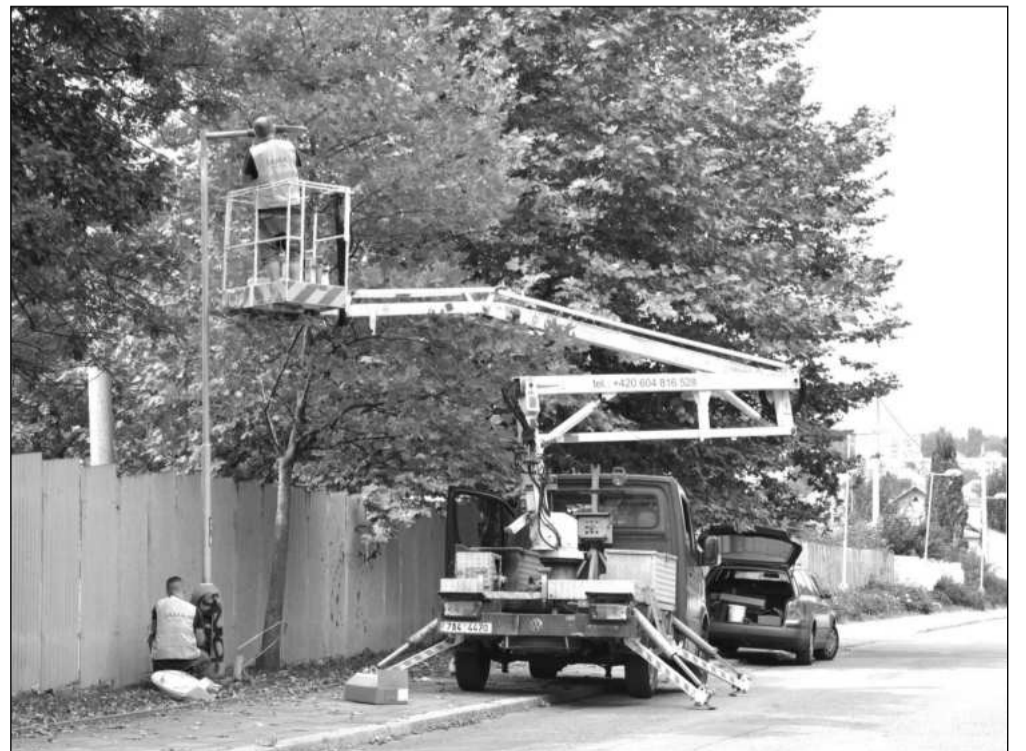
Ještě zhruba osmdesát svítidel musí být vyměněno, než skončí první fáze modernizace veřejného osvětlení v Kopřivnici. Ta přinese až půlmilionovou roční úsporu.

Poslední z připravených akcí je tradiční výstava finalistů celostátní ankety Strom roku, která se uskuteční od 19. listopadu ve vestibulu radnice.