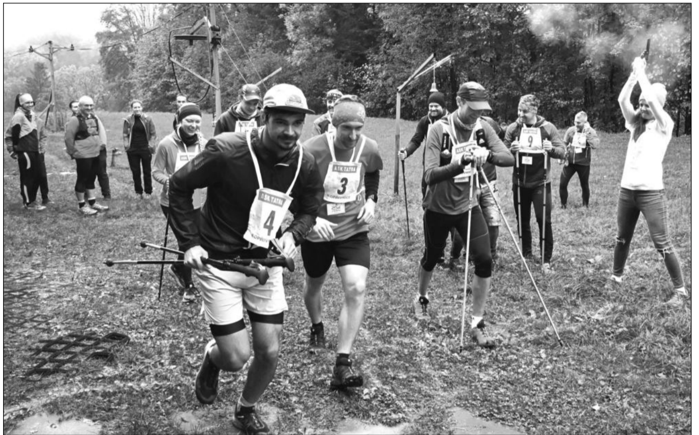
Po třech letech se do Koprivnice vrátil Everesting. Na sjezdovce Červený kámen se šlo několik desítek sportovců, kteří se vydali vstříc velkému dobrodružství. Nejlepší jednotlivci, dvojice i dva vícečlenné týmy zdolali všech 39 výstupů.

Průzkum zjišťoval například i to, jak se Koprivničanům líbí zrekonstruované centrum města. To pozitivně hodnotí více než 80 % dotazovaných. (Pokračování na straně 3)