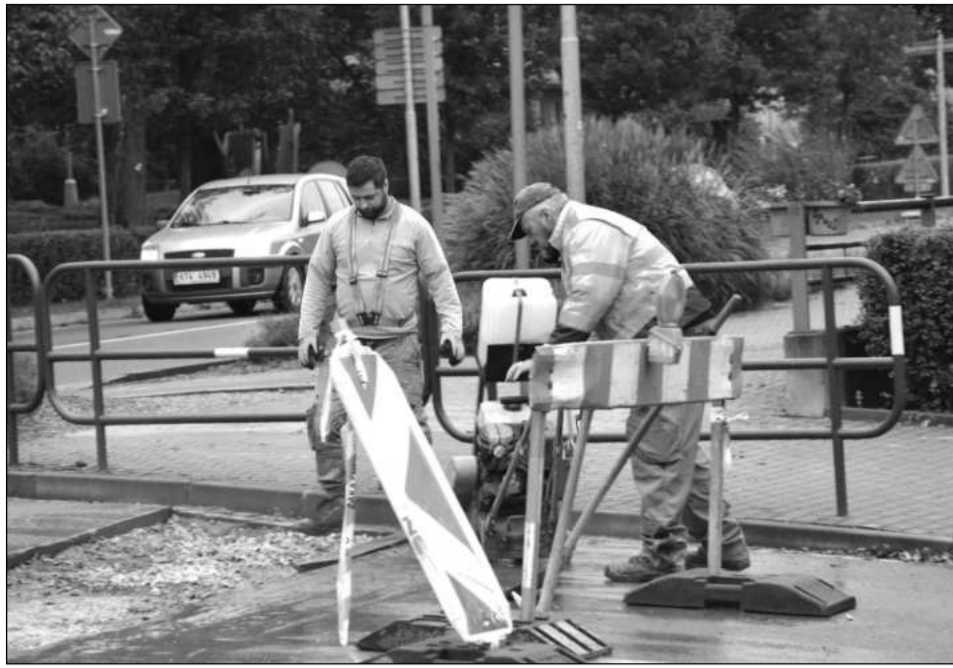
Potrubí v křižovatce ulic Kpt. Jaroše a Štefánikovy bylo vyměněno. V minulém týdnu pracovníci dokončili opravu komunikace a provoz na ní už je bez omezení.