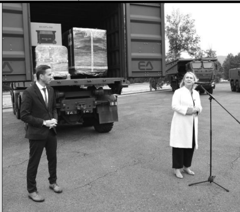
Na pomoci pro ukrajinské vesnice se ministryně Černochová dohodla během návštěvy tamních památníků československých vojáků.

Koprivnice (dam) – Dopravní kontejner naložený mobilními dobíjecími stanicemi, dieslovými generátory, elektrocentrálou, ale i průzkumnými drony převzala před týdnem při návštěvě Tatra Trucks ministryně obrany Jana Černochová. Materiál v hodnotě přesahující tři miliony korun posílají prostřednictvím rezortu obrany na Ukrajinu jako dar firmy ze skupiny Czechoslovak Group. Materiální pomoc je cílená konkrétně pro vesnice Starý Martinov a Zborov, historicky spojené s působením československých vojáků. Většinu využijí přímo v místě. Drony pak mají pomoci obyvatelům obou vesnic působících na frontě. Pomoc naložená na kamionu bude přepravována po zemi a na místo určené by měla dorazit v řádu týdnů.