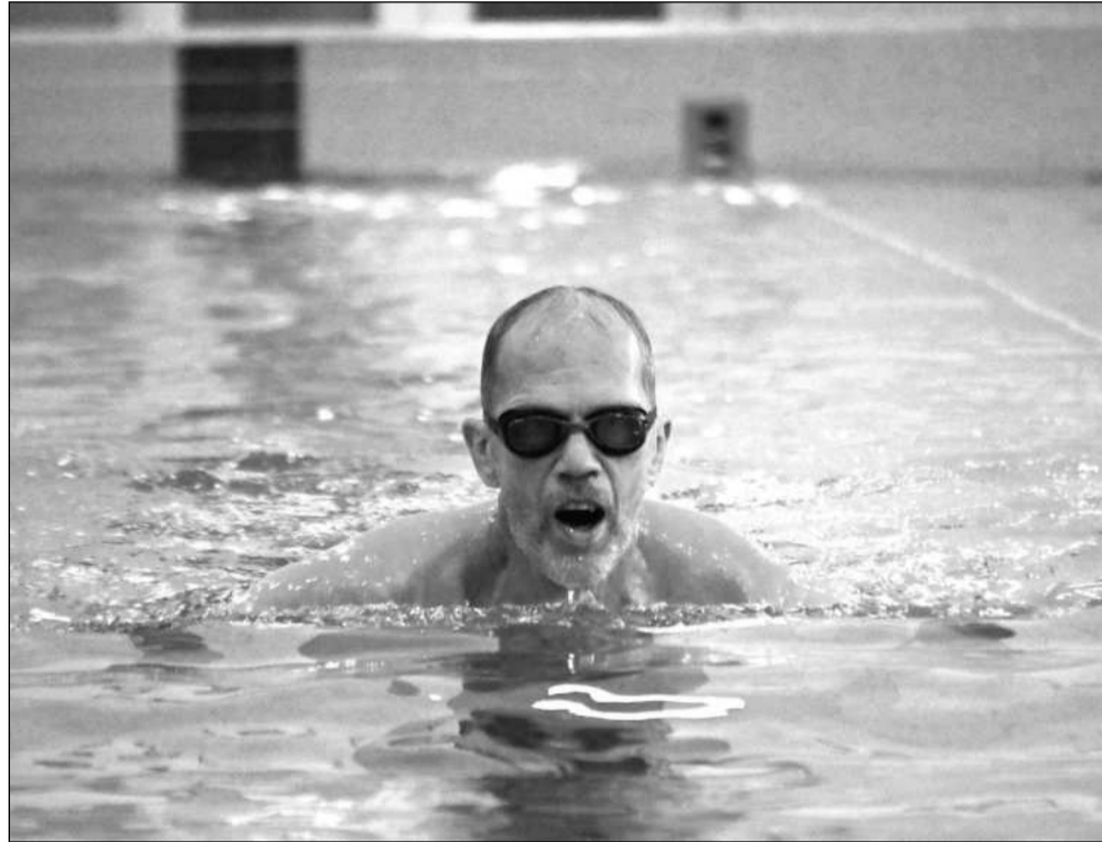
Na kopřivnickém krytém bazénu si zaplavalo první říjnovou středu v rámci celostátní soutěže celkem 351 plavkyň a plavců.