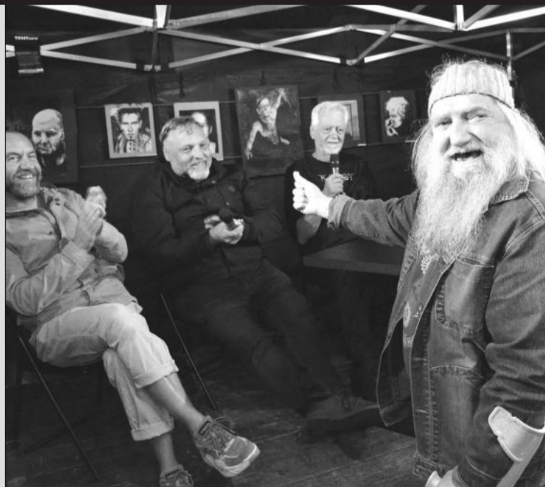
Při besedě o historii Šlahounů a místní alternativní kultury se sešli všichni obyvatelé podezřelí.

Kopřivnice (dam) – Vydařenou oslavu nedožitých třicátin hudebního festivalu Šlahouny si minulý pátek užily stovky lidí. Mikrofestival v centru Kopřivnice nabídl všechno, co k původním Šlahounům patřilo. Hrál hudba, teklo pivo a nechyběl ani déšť, který je neodmyslitelně spojen s těmi nejikoničtějšími ročníky Šlahounů. Hlavní ingrediencí pátečního odpoledne a večera byla ale pohodová atmosféra s příměsí nostalgie, v mnohém připomínající školní sraz po letech. Pod pódiem nebo u baru se totiž potkávali lidé, kteří se často dlouhá léta neviděli a přišli společně zavzpomínat na jedinečný étos Šlahounů. Ten připomínala i velkoplošná projekce videozáznamů a fotografií z akcí někdejšího klubu Nora. (Pokrač. na str. 4)