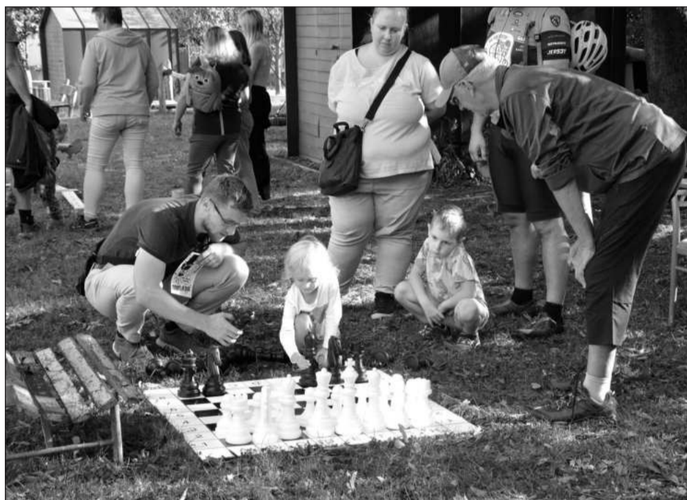
Jednou z disciplín Miniolympiády pořádané na zahradě Mateřské školy Pionýrská byly i šachy, které dětem přiblížili členové místního šachového klubu.

Jako bonus si děti užily nafukovací skákací hrad. V cíli pak na ně čekaly stupně vítězů a olympijské medaile.