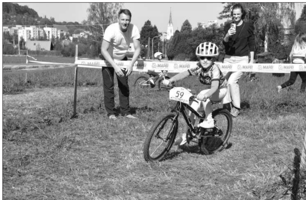
Letošní osmý ročník Drtíku překvapil pořadatele vysokou účastí, která byla rekordní ze všech doposud pořádaných ročníků – závodu se účastnilo 110 dětí.

Z výsledků, Drtík 2024, 8. ročník: odražděla dívky: 1. A. Ma-