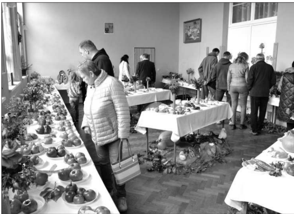
O tradiční výstavu pořádanou obyvateli Lubiny u příležitosti svatováclavské pouti byl velký zájem. Vystaveny byly nejen výpěstky zahrádkářů, ale i kolekce hub.

Lubina (hod) – Tradiční výstava ovoce, zeleniny, květin a hub, která se koná každoročně v Katolickém domě u příležitosti poutě sv. Václava, přilákala víc než šest stovek zájemců. Ti měli možnost si na připravených stolech prohlédnout výpěstky místních obyvatel, a to 29 druhů zeleniny a ovoce a také 118 druhů hub, květinové vazby i bonsaje.