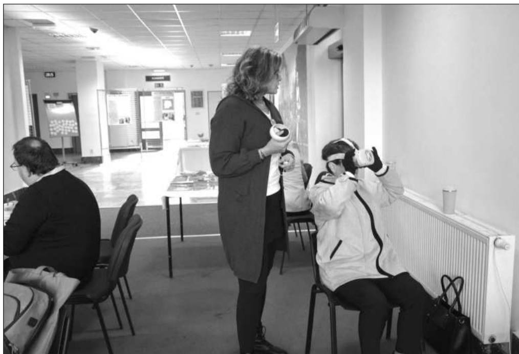
Návštěvníci Dne duševního zdraví si mohli prostřednictvím virtuální reality vyzkoušet pocity lidí s psychiatrickou diagnózou.

Akce nabídla i program pro žáky 8. a 9. tříd kopřivnických škol. Ti ve skupinkách s pracovníkem Krizového centra Ostrava diskutovali o tom, co jsou to krize a jak je řešit. Obdobnou diskuzi pro ně připravila i Slezská diakonie.