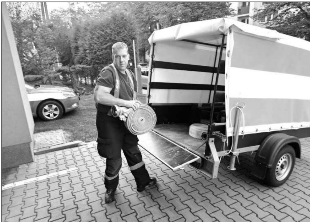
Kopřivničtí dobrovolní hasiči připravují vybavení před odjezdem k zásahu do Ostravy, kde pomáhal s odčerpáváním po záplavových lagun v Nové Vsi.

Podle informací z automobilky jsou kapacity Tatry zakázkově naplněny, podle mluvčího Čírta dokonce panuje převis poptávky nad výrobními možnostmi Tatry. „Proto dochází k postupnému navýšení výrobních kapacit. Platí, že Tatra dál shání šikovné zaměstnance na různé pozice ve výrobě i v dalších částech podniku,“ doplnil mluvčí. Tatra skutečně inzeruje desítky pracovních nabídek, a to jak v dělnických, tak technickohospodářských profesích. Lakýrníkům, automechanikům, autoelektrikářům, obráběčům kovů nebo zámečnickům navíc nabízí i náborové příspěvky.