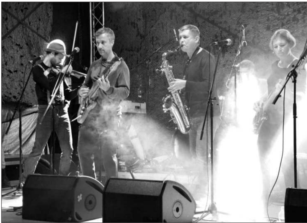
Největší lidskou sílu při oslavách třicátého výročí prvních Šlahounů zmobilizovala kapela ZAhRADKAři, která si pochvalovala atmosféru akce.

Výstava bude v patře Lašského muzea k vidění do 24. listopadu.