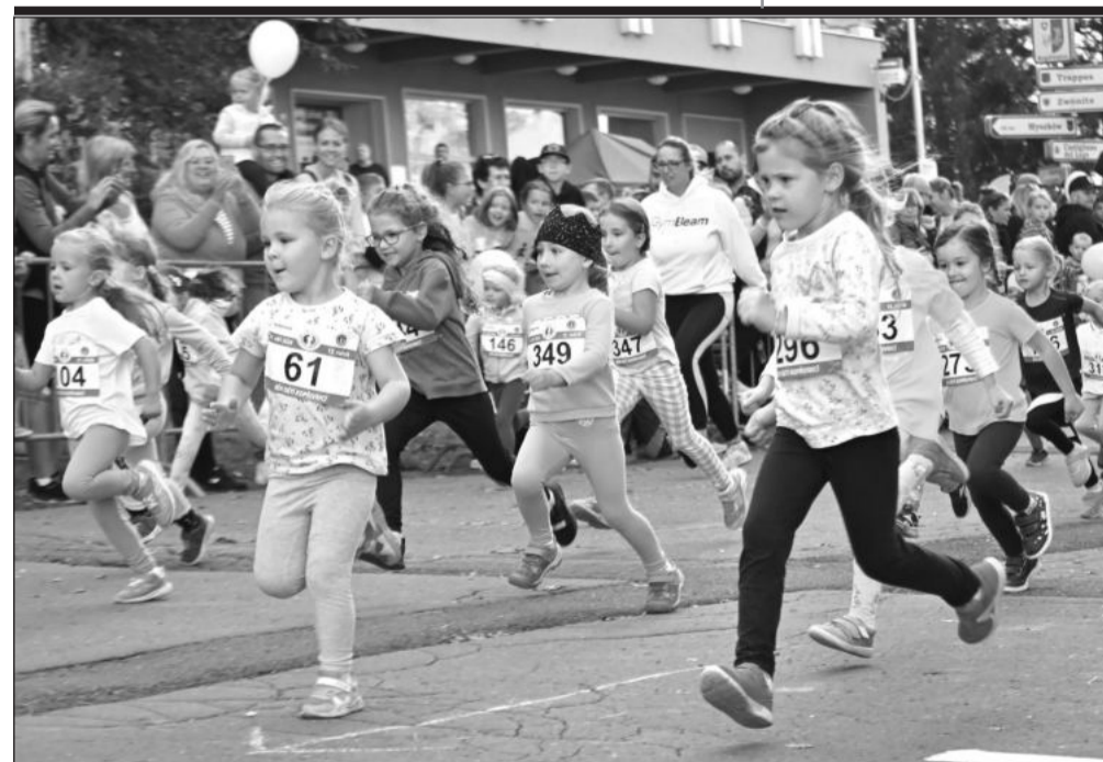
Bez mála čtyři stovky malých běžců a běžkyň se utkalo v dětských bězích, které se konaly tradičně kolem kopřivnického městského úřadu.