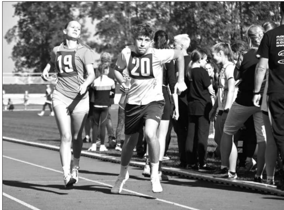
Žáci základních škol bojovali v pátečním dopoledni na letním stadionu v Zátokově pětce a desítce. V obou štafetách vyhrála příhodná škola – ZŠ Emila Zátoka z Kopřivnice.

Jako první se v pátek ráno běžela Zátokova pětka, která je určena žákům prvního stupně, každé z dětí běželo úsek dlouhý 200 metrů. Nejlepší se v konkurenci pěti škol dařilo běžcům ze ZŠ Emila Zátoka, kteří vyhráli o 47 vteřin před druhou v pořadí ZŠ Alšova. Ve starší kategorii soutěžili žáci druhého stupně pěti kopřivnických základních škol a poprvé zde byla také novinka v podobě ZŠ Videčská, "hostující" v Kopřivnici z cílového města Rožnov pod Radhoštěm. Každý účastník běžel jeden atletický okruh (400 m),