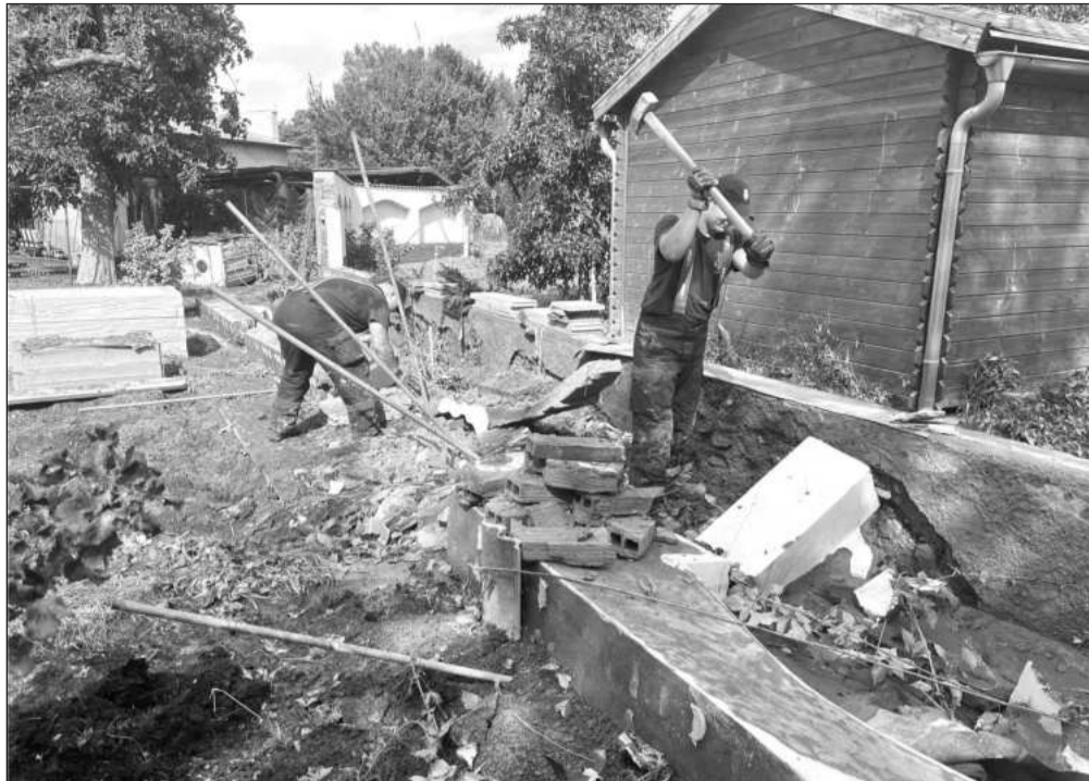
Kopřivnickí dobrovolní hasiči vyjeli v uplynulém týdnu dvakrát do Opavy, kde pomáhali nejen s čerpáním vody, ale i se základním úklidem po povodni.