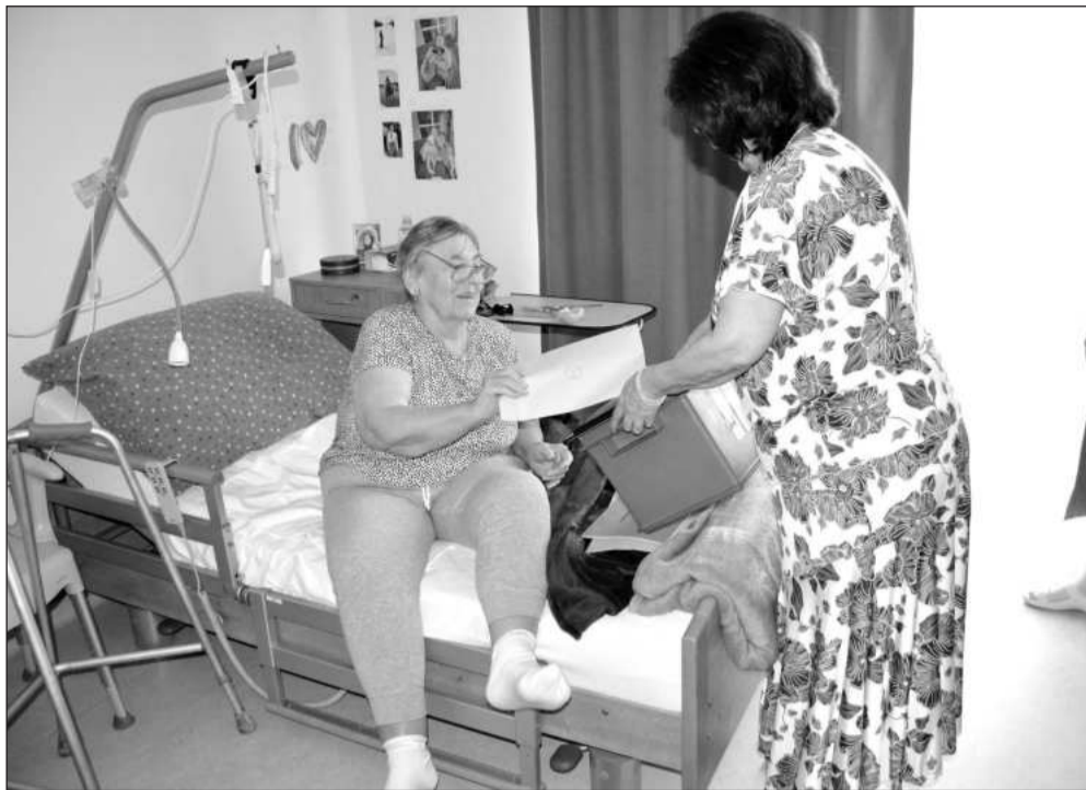
Minulý týden se v Kopřivnici poprvé volilo na nové adrese. Svého práva využili klienti nového domova seniorů na ulici Přičné.

Jako první šlo na start tradičně domácí družstvo, ale nedařilo se mu a pro nezapojené savičky byl jejich pokus neplatný. Dalším družstvům už to šlo lépe. Po pěti odběhnutých požárních útocích přítomní zástupci vedení novojičínské ligy požádali o opravu jednoho terče, který špatně spínal čas. „Oprava nebyla možná, a tak se na místě rozhodlo, že letošní soutěž bude jen klasická pohárová a nebude zařazena do novojičínské ligy. Několik družstev proto odjelo,“ konstatovala Jarmila Polášková. Ti, co zůstali, bojovali o co nejlepší umístění. Nejlepší čas v požárním útoku v kategorii mužů dosáhlo družstvo z Kujav, druhé místo obsadil tým Hukovic, třetí byl Příbor a čtvrtý skončil loňský vítěz z Větrkovic u Opavy. V ženách zvítězil tým Bartovic, následovaný Tiskem a Hukovicemi. V kategorii mužů 35+ zvítězil tým Výškovice, druhé byly Rychaltice a třetí Hukovice.