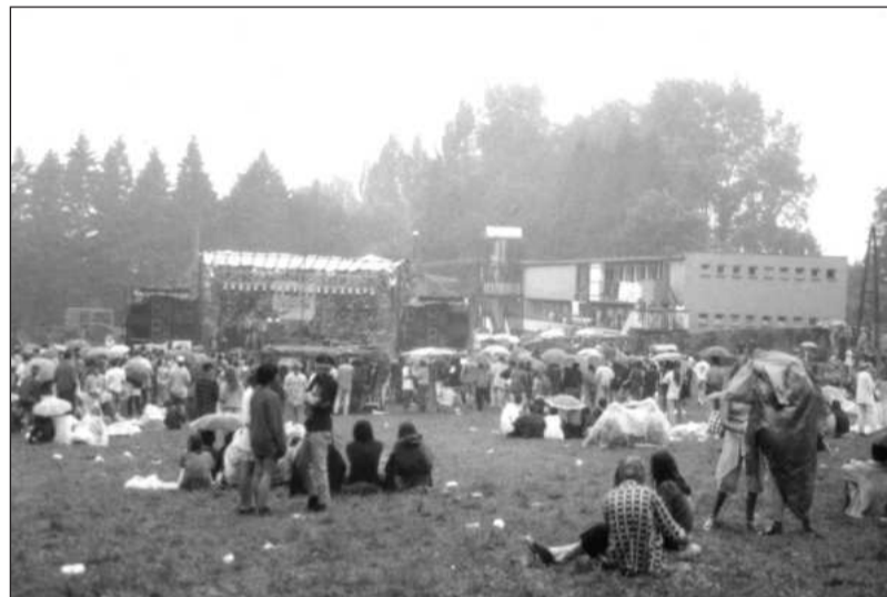
Druhý ročník kopřivnických Šlahounů se konal na louce zdejšího koupaliště, která organizátory inspirovala při vzniku události.

V posledním roce své existence prošly Šlahouny nepřehlédnutelným faceliftem. Hlavní změnou bylo prodloužení festivalu na dva dny. Festival se také převlékl do pestrých barev. Magenta jako dominantní barva festivalové grafiky by byla ještě pár let zpět nemyslitelná. Autorem designu hlavní scény, tanečního stanu i plakátu a Šlahounů byl výtvarník a frontman Tata Bojs. Kapela z Hanspaulky odehrála specifický koncert pod dohledem