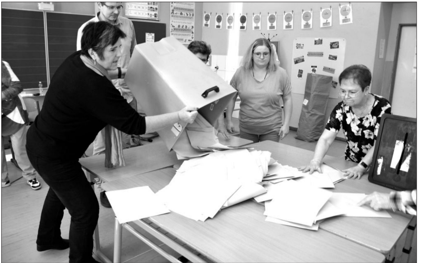
Minulou sobotu úderem čtrnácté hodiny začalo sčítání hlasů odevzdaných do krajského zastupitelstva. Hlasovací lístky byly v Kopřivnici sečteny okolo 16. hodiny, kdy bylo jasné, že jednoznačným vítězem je hnutí ANO.

ANO se tak i v Kopřivnici stalo nespochybnitelným vítězem krajských voleb, a to přitom na místní úrovni na svůj celokrajský výsledek (47,22 %) ještě výrazně ztrácelo. Oproti posledním volbám do krajů, které se uskutečnily v roce 2020, si polepšilo o víc jak 11 procent. Starostové pro kraj před čtyřmi lety nekandidovali. Nepatrně lepší výsledek si připsala levice. Komunisté s národními socialisty ale museli kandidovat společně, aby získali o devětadvacet hlasů víc než před čtyřmi roky samotná KSČM. Ostatní strany a hnutí své politické pozice ztrácely. Strany vládní koalice Spolu v minulých volbách nekandidovaly dohromady, ale lidovci se o hlasy voličů ucházeli samostatně. V součtu tyto strany v roce 2020 získaly necelou čtvrtinu hlasů, jejich aktuální výsledek je o 9,25 % horší. (Pokračování na straně 3)