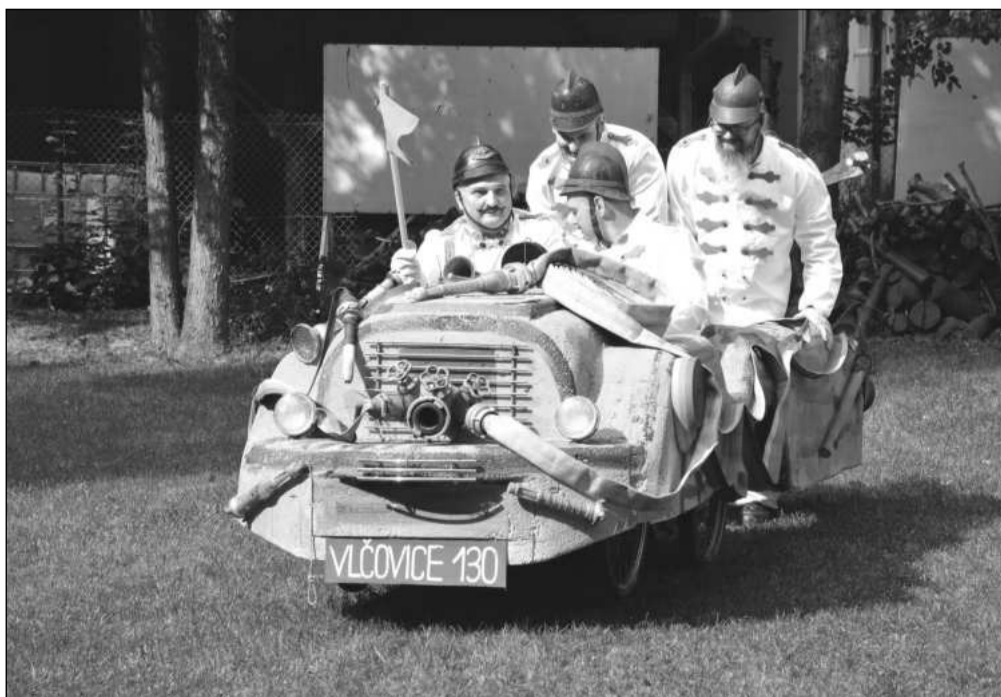
Vlčovičtí hasiči připravili poslední prázdninovou sobotu svůj tradiční dětský den. Zvolené téma zároveň připomnělo oslavu 130. výročí založení tamního sboru.

Po 16. hodině pak hudební program na náměstí uzavře Olga Lounová. Zpěvačka, herečka i rallyová závodnice začala svou kariéru na muzikálových jevištích. Rychle se prosadila také v seriálových a filmových rolích. Svou debutovou desku vydala v roce 2011 pod názvem Rotující nebe. Zatím poslední čtvrté album s anglicky zpívanými písněmi, nazvané Hudba a já, vyšlo před šesti lety.