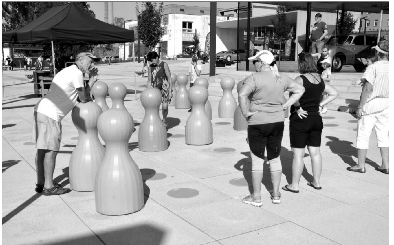
Kopřivnice je od minulého pátku držitelem oficiálního českého rekordu ve hře Člověče, nezlob se s největšími figurkami. Hrát pod dohledem komisaře z Agentury Dobrý den trvala padesát minut a zvítězil v ní tým dětí.

Kopřivnická radnice privátní záměr budování nových bytů v lokalitě Kasáren podporovala. Město bylo investorům nápomocno například při hledání variant zajištění parkování pro potenciální obyvatele domu a podobně. (Pokračování na straně 2)