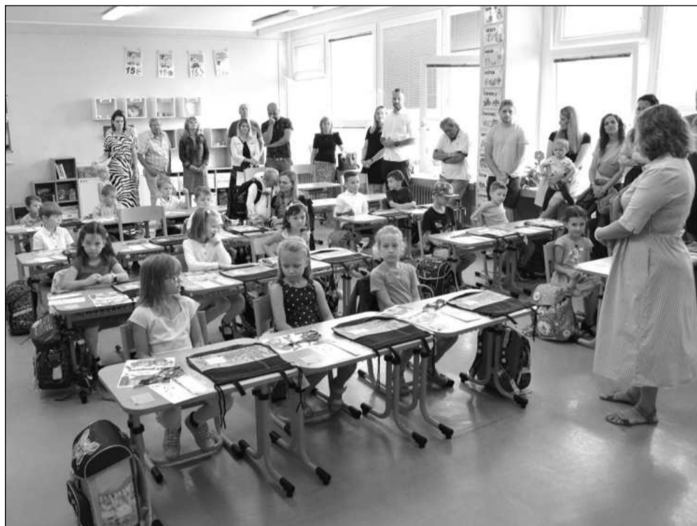
V pondělí poprvé usedlo do lavic kopřivnických základních škol 254 prvňáčků a dalších 43 dětí nastoupilo do přípravných tříd.

Kopřivnická radnice v minulém týdnu obdržela hlasovací lístky, které se budou kompletovat a následně distribuovat do domácností. Do úterý 17. září by měli všichni obdržet do svých domovních schránek obálku se sadou 13 hlasovacích lístků, pokud ne, mohou si o lístky požádat ve volební místnosti. „Vzhledem k tomu, že vymezení volebních okrsků je neměnné a volební místnosti jsou většinou umístěny ve stejných prostorách, obálky již několik let neobsahují informace o čísle volebního okrsku ani adresní štítek. Pokud se někdo přestěhoval a neví, kam má jít volit, informaci o volebních okrscích najde buď v Kopřivnických novinách, na webu města v sekci volby, na vývěsních plochách ve městě, nebo ve volební aplikaci Kam jít volit,“ dodala Jana Sopuchová. V Kopřivnici včetně místních částí se bude volit v 21 okrscích, ty jsou až na Vlčovice na stejných místech jako v červnu, kdy se volili zástupci do Evropského parlamentu. Ve Vlčovcích bude tentokrát volební místnost v objektu komunitního centra Vlčovjan.