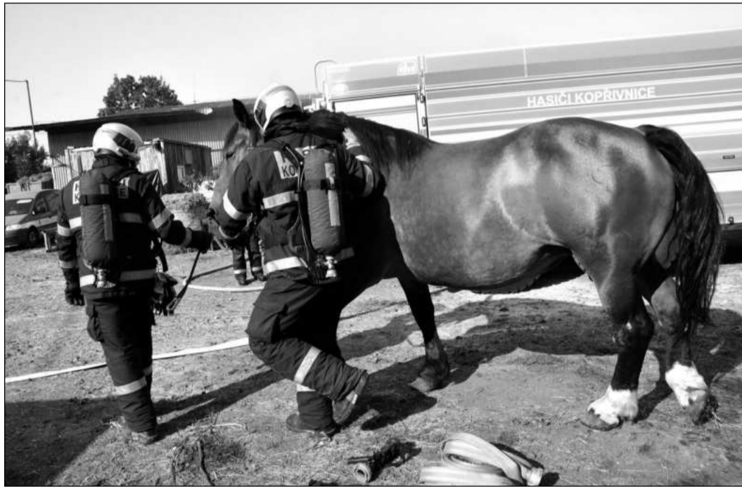
V rámci taktického cvičení si hasiči vyzkoušeli i vyvádění hospodářských zvířat ze stájí. Po jeho skončení následovala instruktáž vedená zkušeným chovatelem.

Na setkání bude účastníkům představena nabídka dostupných volnočasových aktivit včetně podmínek pro jejich využívání osobami se zdravotním postižením.