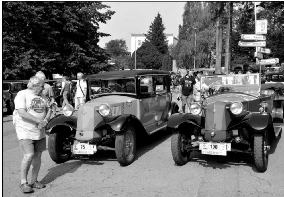
Parkovací plochy před kopřivnickou radnicí zcela zaplnily historické vozy značky Tatra. Na tradiční rallye se jich tentokrát sjelo 144.