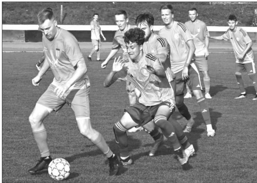
Fotbalisté FC Kopřivnice (světlejší dresy) v tomto utkání 5. kola 1.A třídy porazili Baník Albrechtice a uštědřili mu první porážku sezony.