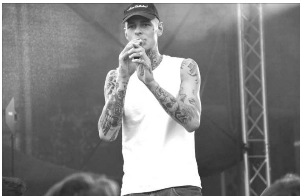
Vyrcholením multižánrové akce Zapoj se v centru města byl minulý pátek večer koncert rappera Doriany. Bavit se v průběhu odpoledne přišly stovky lidí.