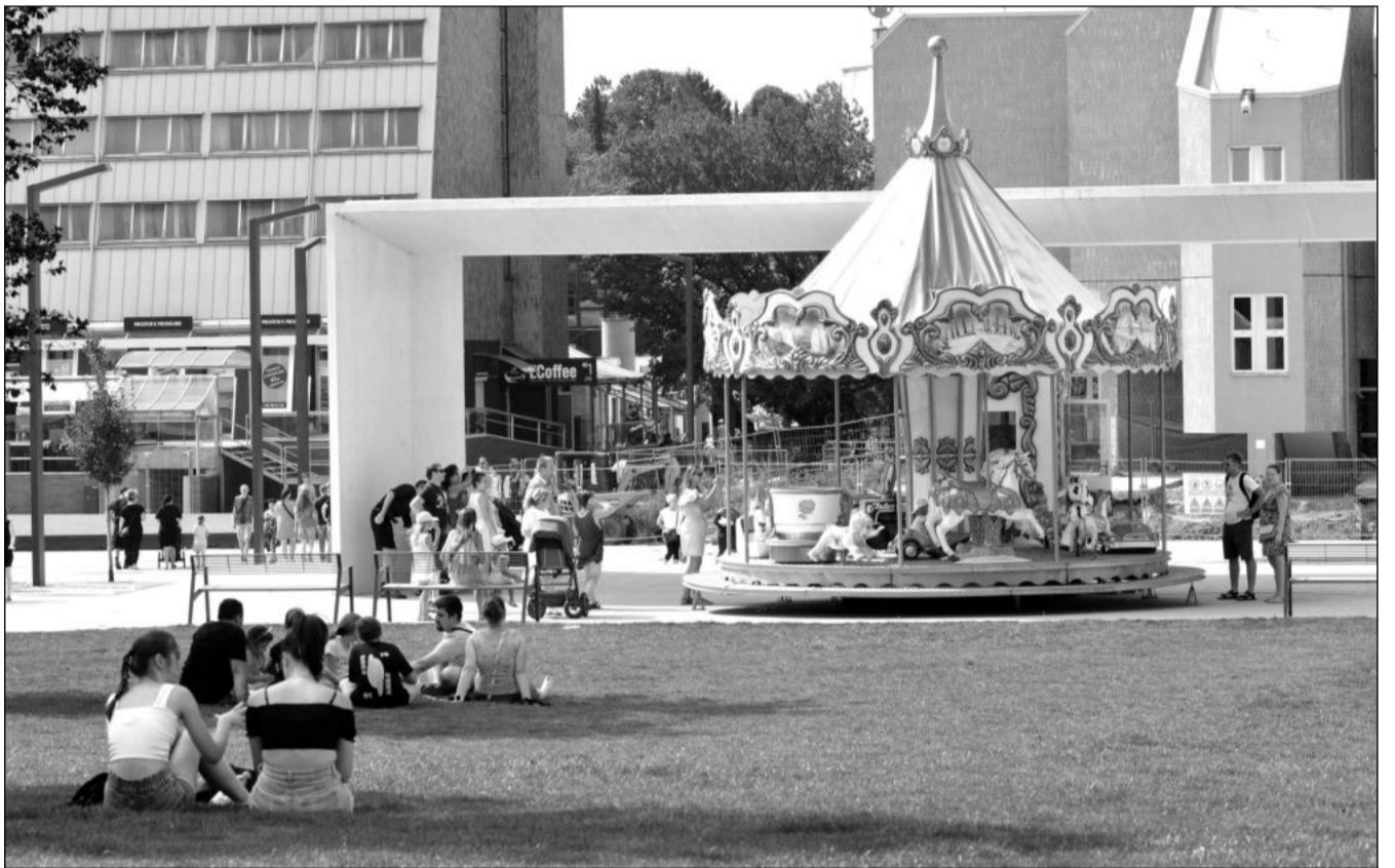
Kopřivnice minulý týden žila oslavami Bartolomějské pouti. Hlavní místa dění byla na prostranství u Albertu a v sadu E. Beneše. V novém centru byl symbolicky umístěn jeden dětský kolotoč.

Návrh, který v minulém týdnu odsouhlasilo vedení města a nyní čeká na potvrzení dopravcem, počítá se sedmnácti spoji každý pracovní den. Ty by měly zastávky objíždět mezi pátou a osmou hodinou ráno ve zhruba půlhodinovém taktu a od 8 do 18 by měly jezdit zhruba co hodinu. Jízdenky si cestující budou moci zakoupit přímo u řidiče, případně využít ODIS kartu, která pokud bude využívána pouze v tarifní zóně Kopřivnice, do které spadají i místní části, stojí pro dospělého cestujícího 200 korun. Zlevněné jízdné je pak 160 korun měsíčně. (Pokračování na str. 3)