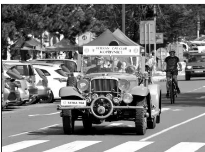
Velký zájem byl i o tradiční projíždky tatrováckými veterány, které letos jezdily pouze po městě.