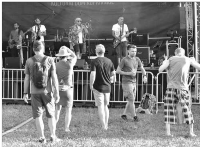
Kapely, které v rámci pouti koncertovaly za slunečního svitu, se musely spokojit s menším publikem. Více lidí přicházelo až večer.

Dva případy řešili strážníci s Policií ČR. „V jednom případě šlo o cizince, který neuposlechl výzvy strážníka a byl předveden na OO PČR ke zjištění totožnosti za použití donucovacích prostředků. Ve druhém případě šlo o krádež. Poškozenému muži, který spal, byly neznámými pachatelé odcizeny věci, které měl při sobě. K této události došlo v sobotu v časných ranních hodinách v sadu E. Beneše, což je trestný čin, který řeší státní policie,“ okomentovala dvě události Lenka Janíková. Ta poznamenala, že tentokrát strážníci spíš řešili ztracené a nalezené věci, se kterými se na ně lidé obraceli. K takovým případům došlo v šesti událostech.