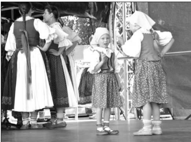
V programu měl své místo i folkór. V neděli vystoupil soubor Javorník a v sobotu cimbálová muzika Radhošť.