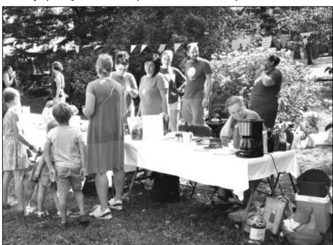
Novinkou víkendového programu byla poutová snídaně, která měla i svůj charitativní podtext.