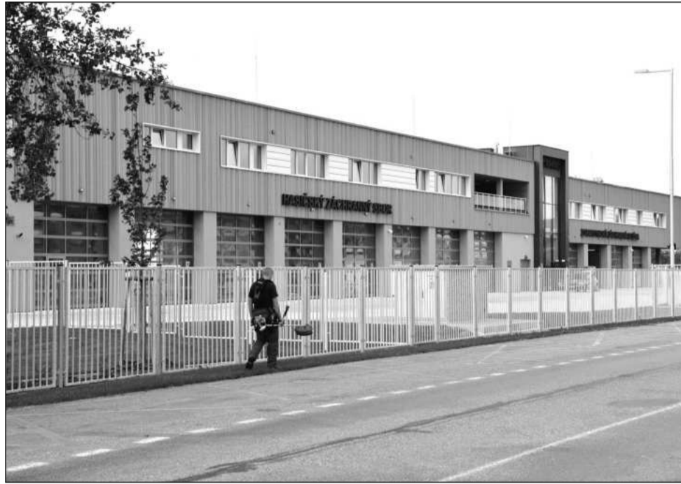
Integrované výjezdové centrum, které bude sloužit nejen kopřivnickým hasičům, ale i zdravotnickým záchranářům, je dokončeno a chystá se na nastěhování zmíněných složek.

Kromě opravy oken dojde i na instalaci nových elektronických zabezpečovacích systémů. Společnost Eprom má v objektu namontovat poplachový zabezpečovací a tísňový systém a zároveň i elektronickou požární signalizaci, která pomocí hlásičů zajišťuje včasnou signalizaci požáru. Nové zabezpečení muzejních expozic přijde na 261 tisíc korun. Dílčí investice v objektu Fojtství mají pokračovat. Na příští rok například odbor majetku města plánuje opravu sociálních zařízení a kuchyňky v suterénním prostoru Fojtství, využívaném k pronájmům.