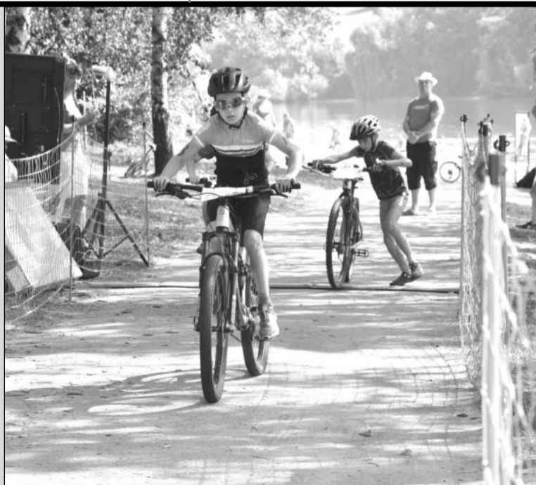
Tradiční Větrkovický triatlon se letos rozšířil o dětské duatlonové klání, do kterého se zapojilo 66 závodníků.