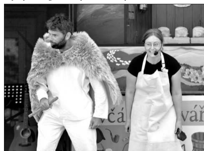
Na poutovém jarmarku nechyběla ani divadelní představení. V neděli v podání Divadla Milana Štátného.