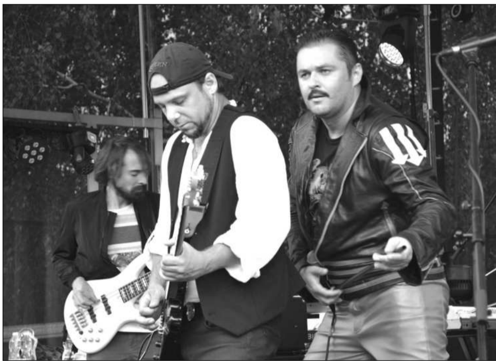
LETNÍ SLAVNOSTI MNIŠŤ: Osvětová beseda pořádala minulou sobotu 17. srpna tradiční slavnosti. Nabíjený program začal už v devět hodin ráno Během oborou. Na start se i v úmorném horku postavilo zhruba šedesát běžců. Ve zcela jiném oboru se začalo soutěžit o dvě hodiny později, kdy začal 4. ročník Guláš Cupu. Kotlíkový guláš uvařilo šest týmů, někteří sázeli jen na kulinařské umění, další zapojili nejmodernější techniku včetně robotického ramene a jiní soutěžící upláceli hlasující panáky pálenky. Odpoledne odstartoval hlavní program s dechovkou Javořinka nebo Dětskou olympiádou. Pak ale pořadatelům zkřížil plány déšť. Kapela Queenways sice ještě se pozdějším vystoupením, ale taneční zábavu se skupinou Koprock už pořadatelé kvůli rozmarům počasí zrušili.