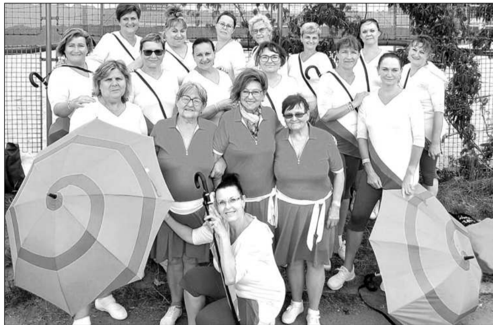
Kopřivnický Sokol vyslal na Vsesokolský slet do Prahy velkou skupinu cvičenek, které si užily svátek sportu, pohybu a sokolských hodnot.

U největší sportovně-společensko-kulturní události roku v naší zemi ani tentokrát nechyběl Sokol Kopřivnice, který měl v Praze šestnáctičlennou skupinu žen a další tři členky „hostovaly“ ve frenštátské skupině seniorů a senierek. Všechny zvládly svá vystoupení na jedničku, a přispěly tak ke krásné oslavě sportu, pohybu a hodnot fair play. „Připravovali jsme se téměř rok a jsme moc rády, že jsme skladby zvládly. A to během celého roku příprav, ale především na samotném sletu. V Praze jsme měli průběžně zkoušky už od pondělí, a to i 2x za den, na svá vystoupení jsme