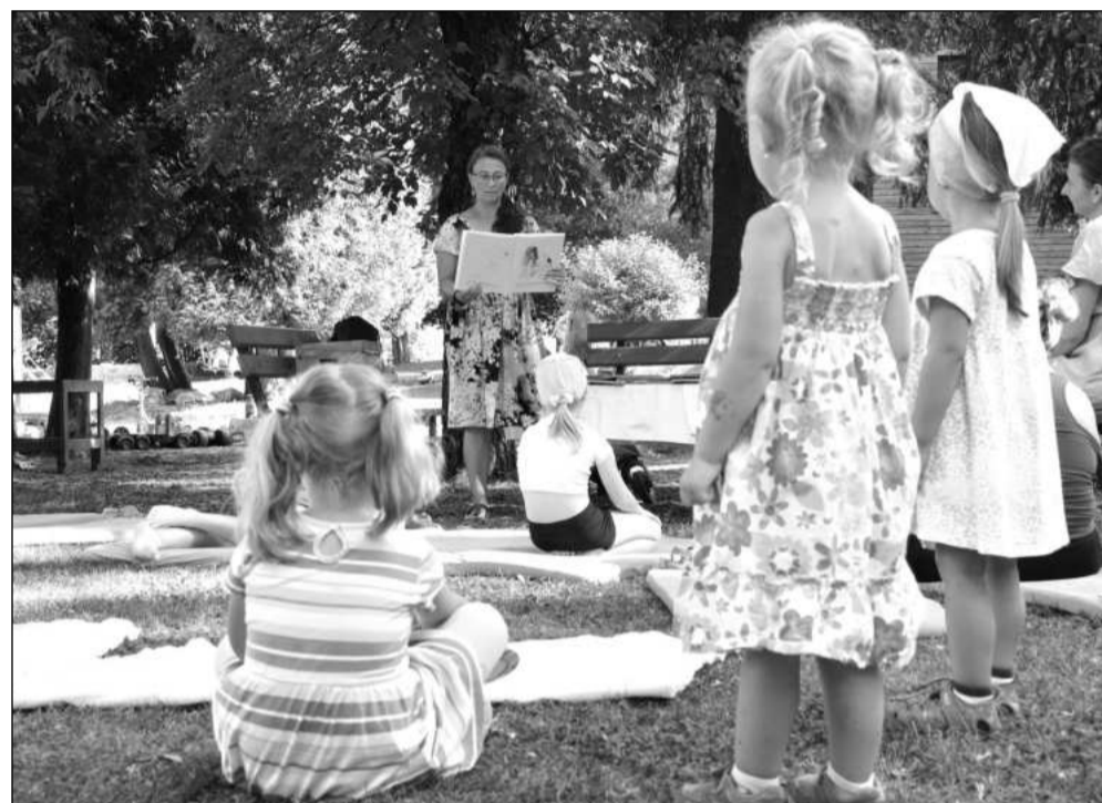
V pátek 16. srpna proběhl poslední prázdninový koutek čtení, během kterých se dětem na zahradách mateřských škol představovala dětská literatura.

Nově bude vytyčeno pět prodejních míst u přechodu pro chodce pod budovou radnice naproti plakátovací ploše. K dispozici by mělo být až pět prodejních míst, která budou moci prodávající ovoce, zeleninu a dalšího zboží využívat. Na novém místě budou trhovci působit zřejmě nějakou dobu, ale jde do značné míry o provizorium. „Budeme hledat jiný, lépe vyhovující prostor. Jednou ze zvažovaných možností by mohl být po revitalizaci prostor pěší zóny mezi lékárnou Dr. Max a optikou Gotthardová na Štefánikově ulici,“ doplnil starosta Hanus.