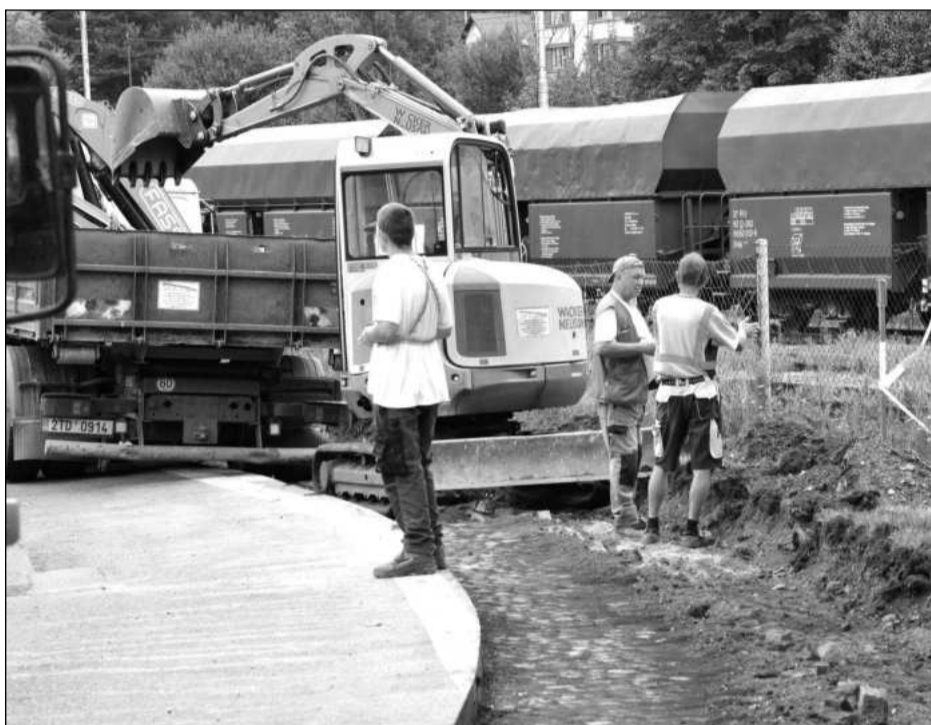
Nově budovaný chodník na ulici Štramberské má zvýšit bezpečnost chodců přecházejících na vlakové nádraží ve Štramberku.