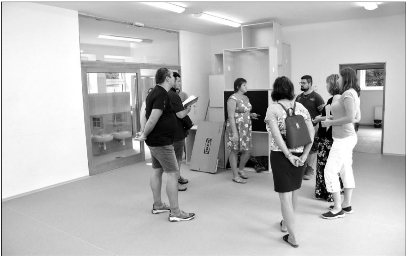
Stavební část rekonstrukce budovy Mateřské školy Pionýrská byla v pondělí dokončena. Aktuálně probíhá odstraňování drobnějších nedodělků a montáž nábytku a zařízení. Obnovení provozu v září by nemělo nic bránit.