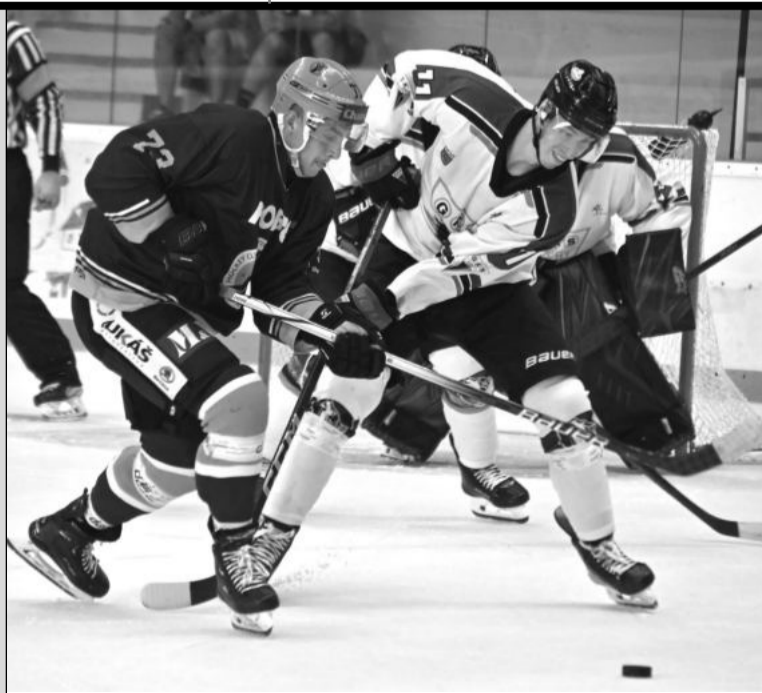
Letní přípravné zápasy v Kopřivnici odstartoval atraktivní souboj VHK Vsetín (tmavší dresy) – GKS Tychy.