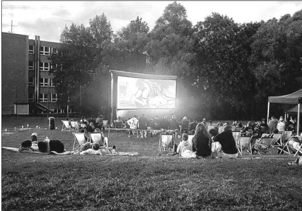
Zatím nejnavštěvenějším snímkem letošního letního kina byl animák V hlavě 2. Pořadatelé v novém prostoru sázejí i na Zápisník alkoholičky a film Já, padouch 4.

Začátek představení je stanoven na 20. hodinu. V případě nepříznivého počasí se představení odehraje pod střechou v sále kulturního domu na náměstí.