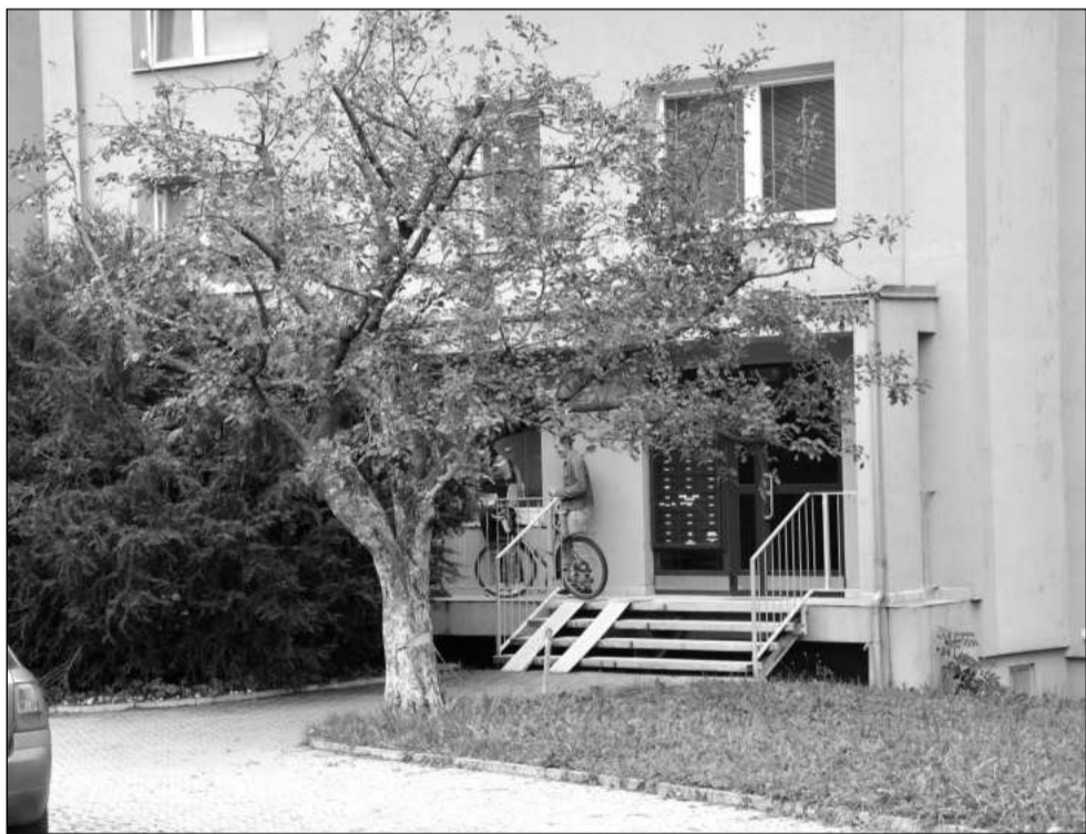
Poškozená jablona na ulici Alšově zůstává a po naříznutí kmene na svém místě. Správce zeleně věří, že ořez koruny a ošetření rány strom zachrání.