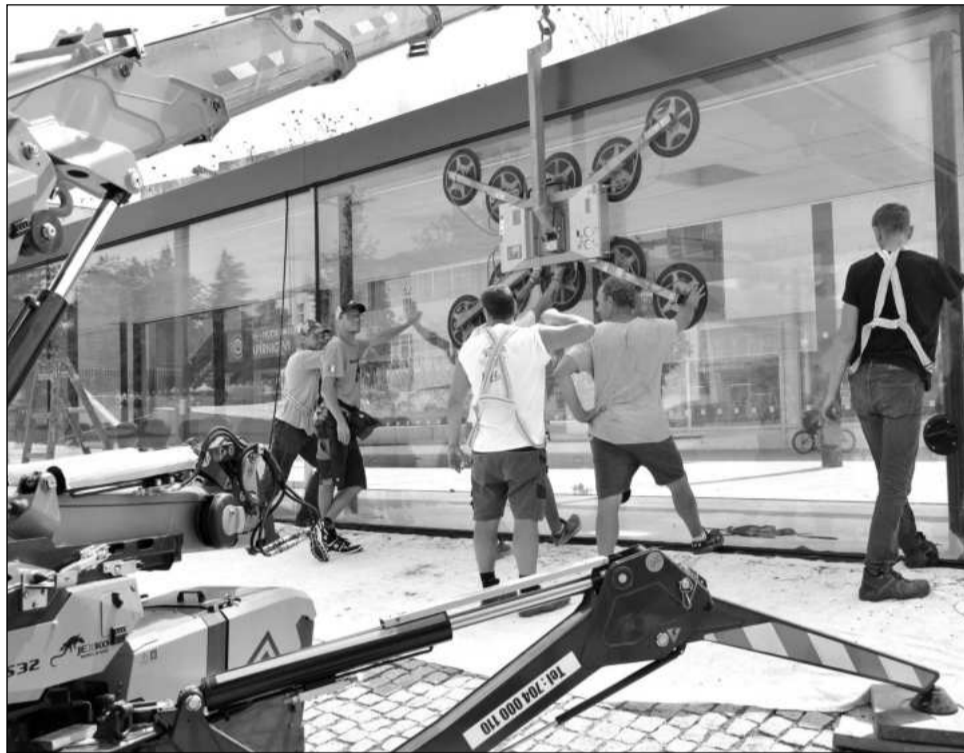
Devátého července byla za pomoci speciální techniky instalována nová prosklená stěna vstavního pavilonu. Ta původně nevydržela tlaky při sesedání objektu.

Do 16. července, tedy v zákonném termínu, předložilo Krajskému úřadu Moravskoslezského kraje v Ostravě své kandidátní listiny 13 subjektů a po termínu pro jejich přezkoumání, který krajskému úřadu vypršel v sobotu 3. srpna, obdržely všechny rozhodnutí