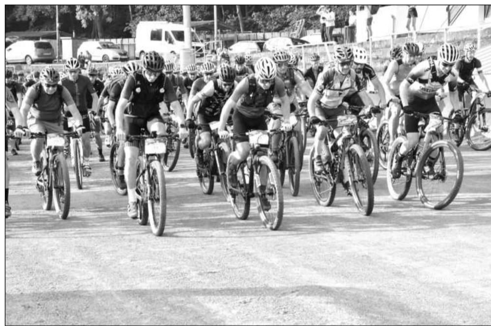
Na start 27. ročníku Kopřivnického Drtiče se 15. července vydalo 396 jezdců, z nichž do cíle došlo 369. Nejrychlejšího z nich přivítali v cíli ve 13:58 hodin.

Letos pořadatelé zvolili novou trasu, která sice vedla přes Beskydy v délce 122 kilometrů s převýšením cca 3 400 metrů, ale účastníky zavedla i na slovenská Kasárna, proto ten podtitul Československý masakr. Trasa vedla z Kopřivnice na Pustevny, přes Martiňák, dále k chatě Třeštík před Bumálkou, poté na hranici se Slovenskem jižním směrem k Makovskému průsmyku, sedlo pod Lemešnou, po cyklotrase na Kasárny, pak znovu na hřeben za Velký Javorník, rozhlednu Stratenec se sjezdem do Velkých Karlovic. Ná-