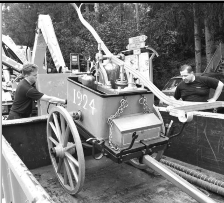
Sto let stará ruční stříkačka větrkovických hasičů je novým přírůstkem Hasičského muzea města Ostravy.