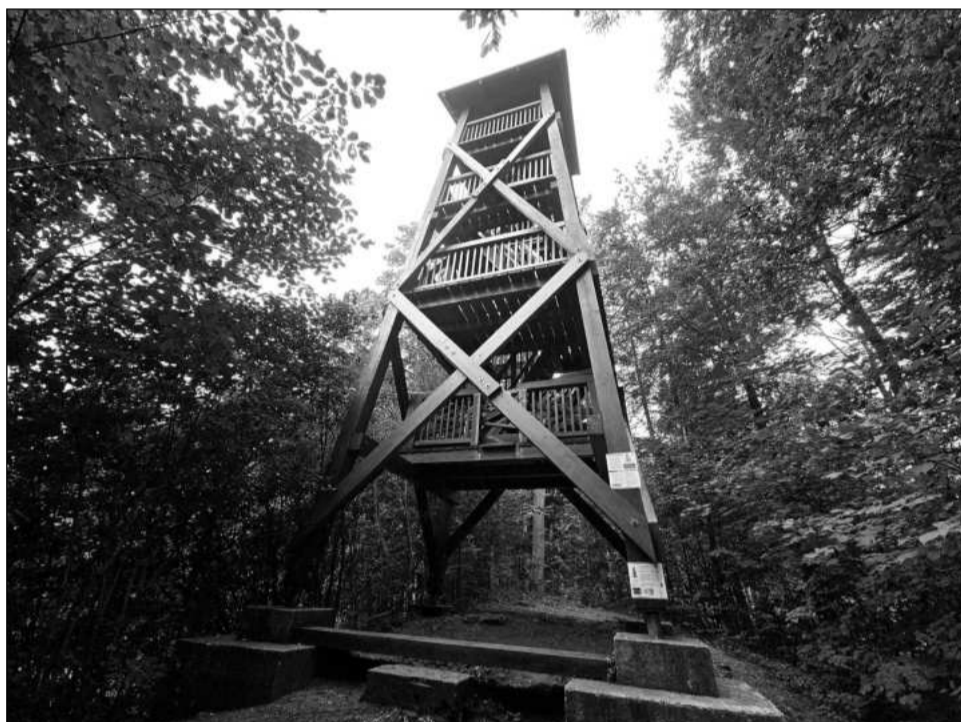
Na uzavřené Bezručově vyhlídce byl demontován spodní díl přístupového schodiště a stavba čeká na rozhodnutí o jejím dalším osudu.