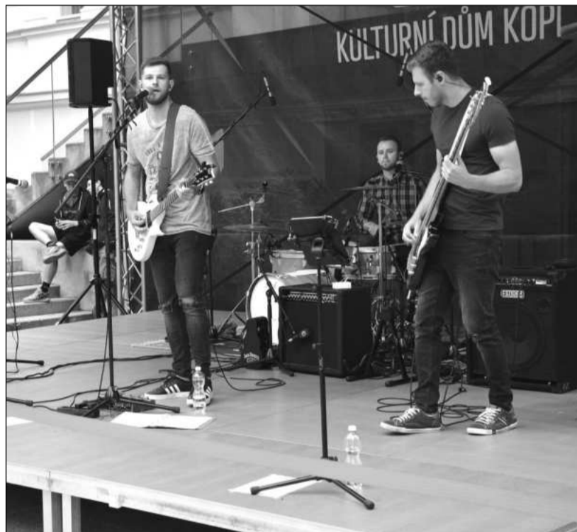
Sérii letních koncertů před Ringhofferovou vilou zahájila minulou neděli lichnovská poprocková kapela Red Stone.

Začátek tříčtvrt hodinového představení je naplánován na půl páté odpoledne.