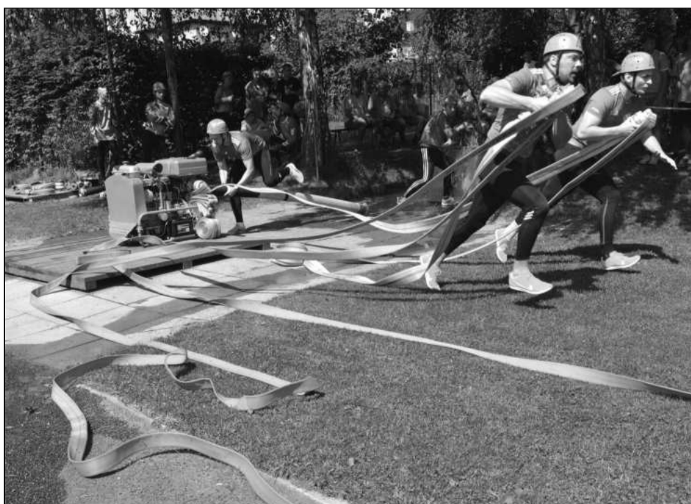
Na tradiční KOVOK Cup přijelo poslední červnovou sobotu soutěžit 26 družstev z celého novojičínského okresu.

Zřízení re-use centra před necelými dvěma roky byl dobrý počín. Lidé dávají odloženým věcem druhou šanci a navíc přispívají ke zkrášlení města.