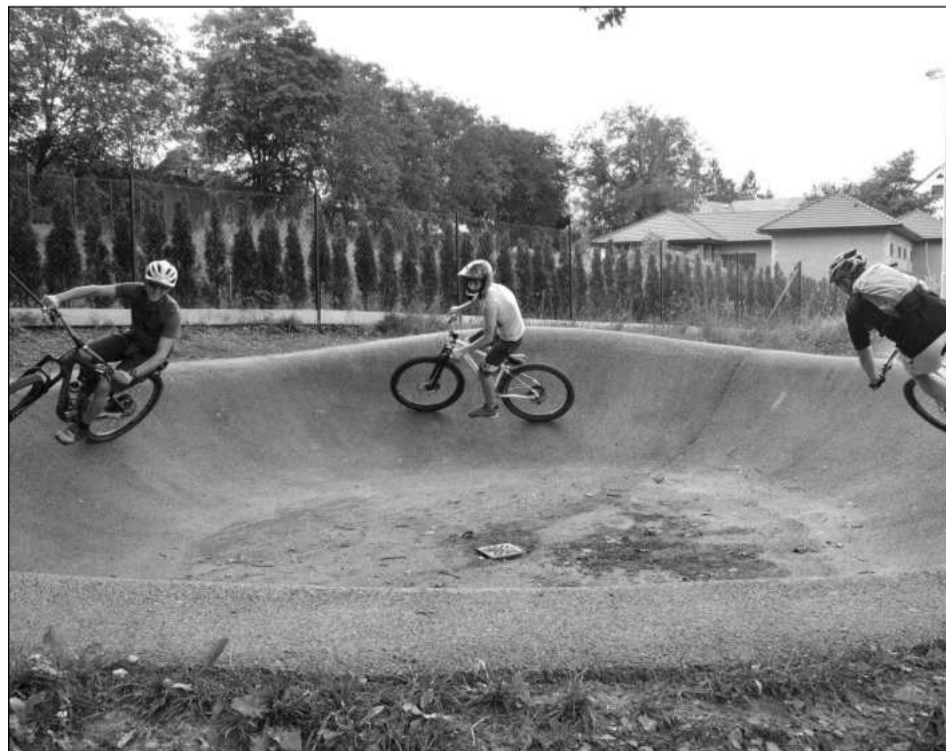
V rámci první akce Někdo ven??? vyjela dvacítká cyklistů do Rybí, kde si zajezdili na pumptracku. Dnes jsou na programu sportovní aktivity v centru města.

V prvním ročníku Koprojektů vzniklo nové hřiště na ulici Javorové, jehož součástí je i hřiště na pétanque, ve druhém zvítězil návrh na rekonstrukci skateboardového areálu, o rok později získal nejvíce hlasů návrh na vybudování dvou nerezových skluzavek na Severu, čtvrtý rok vyhrál projekt na obnovu dětského hřiště ve vnitrobloku na ulici Kadláčkově. V pátém ročníku získal nejvyšší podporu návrh na vznik terapeutické a smyslové zahrady v prostoru mezi EFFATHOU a hokejkou, který bude realizován letos na podzim.