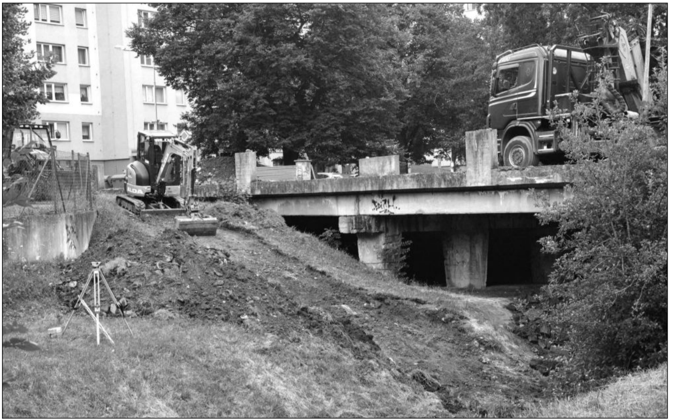
V pondělí 8. července začala demolice mostu na ulici Erbenově. Na jeho místě má během čtyř měsíců vyrůst zcela nový most pro silniční dopravu i pěší. Do té doby bude nutné místo objížďet.

Všechny přijaté návrhy prošly formální kontrolou a díky povinným konzultacím se rovnou vyřešily otázky realizovatelnosti i finanční náročnosti. (Pokračování na straně 2)