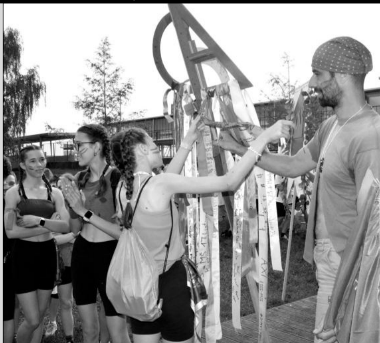
Součástí rituálu posledního zvonění bylo navázání stuh se jmény vycházejících žáků na speciální insignii.

Následovala volná zábava na nafukovacích atrakcích podobných těm ze Survivoru.