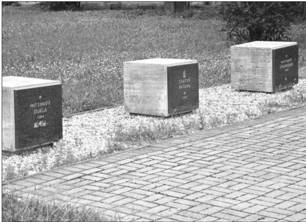
Odcizené bronzové destičky na kostkách s prstí z bojišť druhé světové války nahradily desky z leštěné žuly.