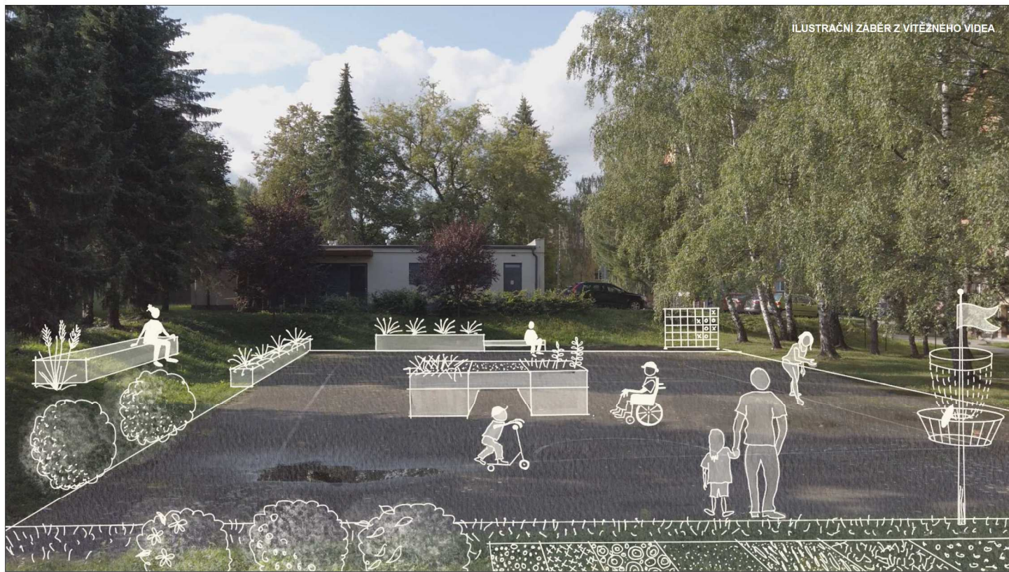
ILUSTRÁČNÍ ZABĚR Z VÍTĚZNEHO VIDEOA