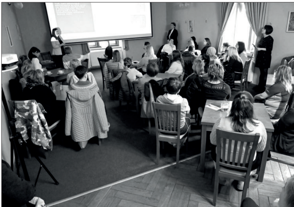
O prezentaci pracovní náplně pečovatelek i rekvalifikačního kurzu potřebného k výkonu tohoto povolání byl minulý týden ve Vile Machů velký zájem.

Obsazování dalších pracovních pozic bude postupné a bude sladeno s postupným náběhem provozu Domova pod Bílou horou.