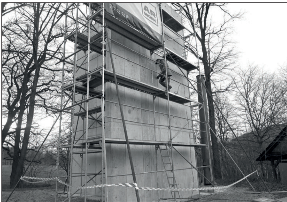
V areálu Vanaivan zatím stojí pouze betonový monolit, který tvoří základ budoucí lezecké věže. Skauti přesto věří, že už v létě bude sloužit svému účelu.