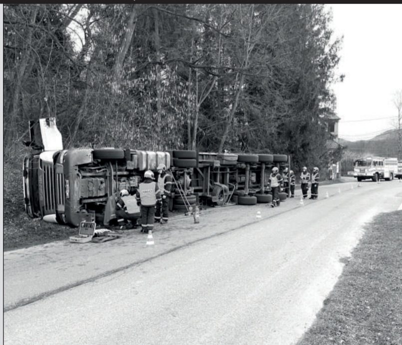
Nehoda kamionu zaměstnala hasiče a o den později i sanační firmu, která musela odtěžit kontaminovanou zeminu.

„Řidič se dostal z kabiny havarovaného automobilu ještě před příjezdem hasičů, ti mu poskytli předlékařskou první pomoc a po příjezdu zdravotnické záchranné služby ho s lehkým zraněním předali do jejich péče,“ uvedl mluvčí hasičů Jakub Kozák a dodal, že z hasičské stanice v Ostravě-Zábřehu byl povolán automobilový jeřáb a spolu s ním i vyprošťovací speciál Bison. (Pokrač. na str. 3)