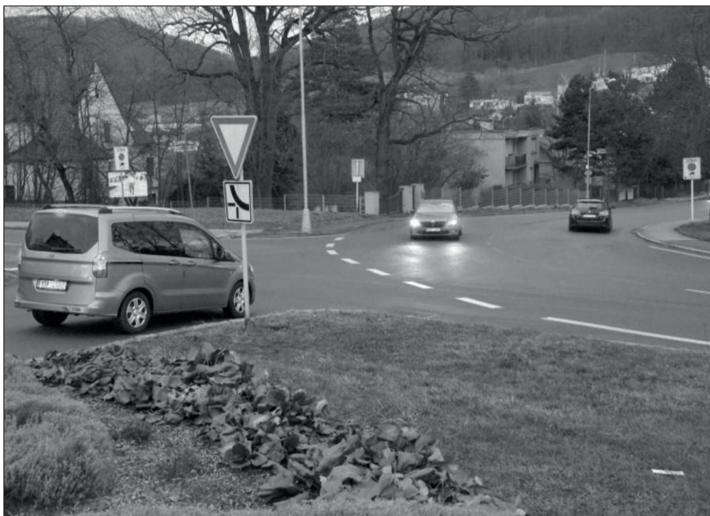
Nových přechodů a chodníků, které mají zvýšit bezpečnost chodců, se křižovatka na pomezí Kopřivnice a Štramberka dočká nejspíše příští rok na jaře.