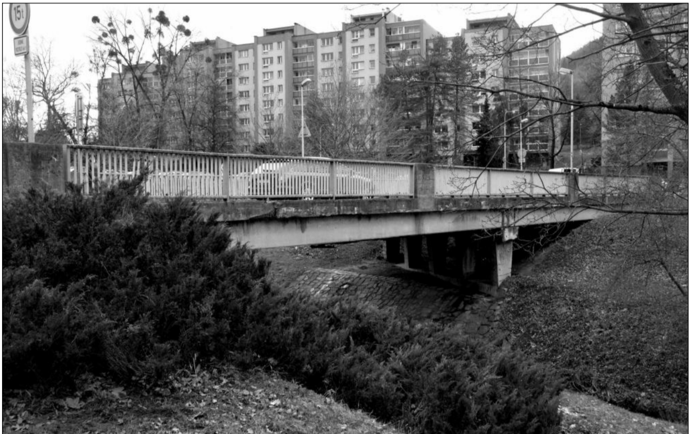
Most propojující ulice Erbenovu a I. Šustaly je ve špatném technickém stavu. V letošním roce jej čeká demolice a místo něj má na místě do podzimu vyrůst zcela nové přemostění Kopřivničky.

Myšlenka zavedení MHD vykrystalizovala vloni na diskuzním fóru Zdravého města a v následném celoměstském hlasování se městská hromadná doprava umístila na prvním místě jako příležitost pro rozvoj Kopřivnice. Do ankety, která měla dále zjišťovat postoj obyvatel města k MHD, se vloni v září zapojilo 1 102 respondentů. Autoři ankety požádali dotazované, aby si představili MHD, která by pro ně byla ideální – to znamená, že zastávku by měli blízko a frekvence i časy jízd by jim vyhovovaly. (Pokračování na straně 2)