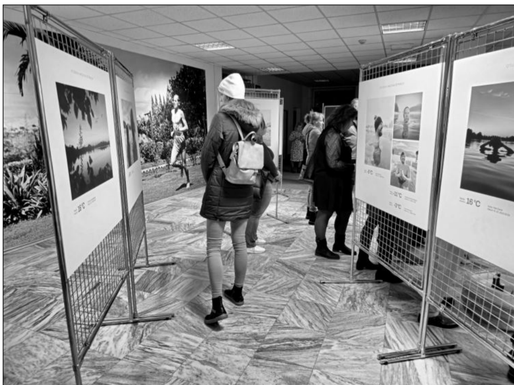
Ještě do konce měsíce bude ve vestibulu kopřivnické radnice k vidění fotografická výstava Otuzení a muži na Větrkách.