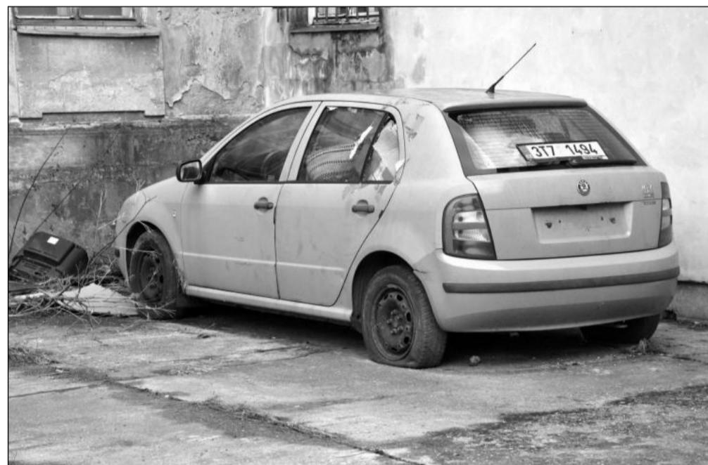
Jeden z autovraků, který je stále ještě k vidění v ulicích Kopřivnice, stojí u Kasáren. Řadu dalších nepojízdných vozidel se podařilo z komunikací a parkovišť odstranit.

Kdy úpravy kopřivnického Lidlu proběhnou, je podle jejích slov navázáno na získání potřebných povolení. O případných omezeních pro zákazníky bude Lidl s předstihem informovat.