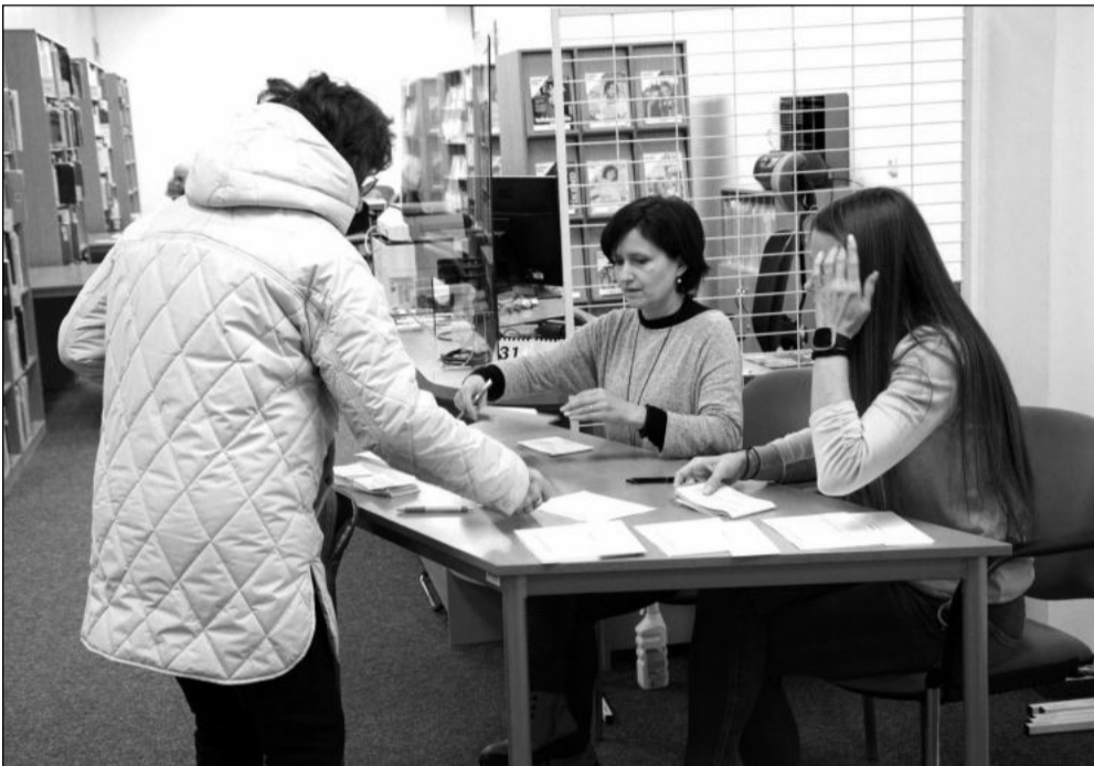
V pondělí probíhaly v čítárně městské knihovny zápisy do letního semestru Akademie třetího věku. Největší zájem byl o virtuální kurz. FOTO: DANA HOĐÁKOVÁ

„Lhůta pro zaplacení daně z nemovitých věcí, případně zálohy na tuto daň, končí 31. května 2024. Finanční správa bude poplatníky informovat o výši jejich daňové povinnosti jako tradičně formou složenky, kterou obdrží do poštovních schránek, nebo formou hromadných předpisných seznamů, které budou v květnu k nahlédnutí na územních pracovištích finančního úřadu. Majitelé datových schránek dostanou informace pro placení daně do svých datových schránek. Obdobně je tomu i v případě uživatelů DIS+, kteří najdou informace pro placení daně v DIS+ v sekci nastavení a informace o subjektu → Daň z nemovitých věcí, a nebude jim již zasílána složenka. Poplatníkům, kteří jsou přihlášení k zasílání informace pro placení daně z nemovitých věcí na e-mail, budou informace doručeny na e-mail a poplatníkům, kteří platí daň prostřednictvím SIPO, bude provedena úhrada daně tímto způsobem,“ upozornila Petra Homolová a dodala, že kdo nemá SIPO ani datovou schránku, může dostávat údaje pro placení daně na e-mail. Stačí si zažádat nejpozději do 15. března na finančním úřadě.