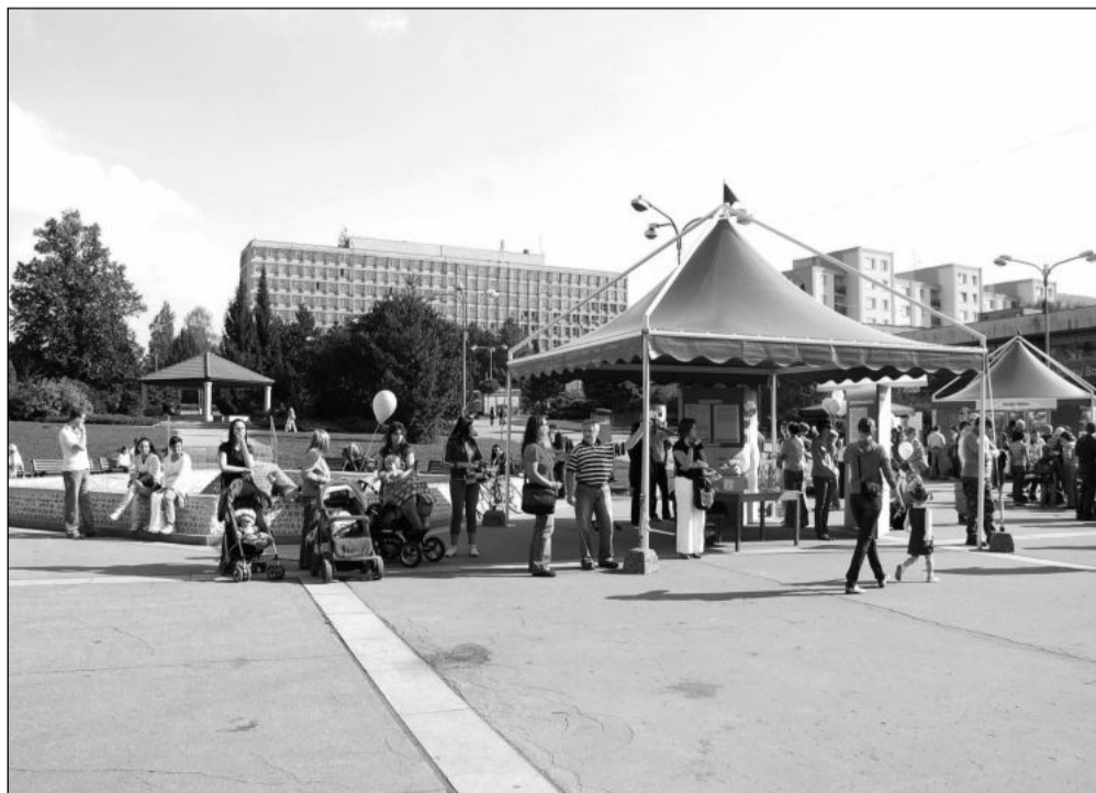
Radnice v roce 2010 pořádala akci s názvem Město je naše společné hřiště, na které prezentovala nejen realizované akce, ale i své plány pro příští období.