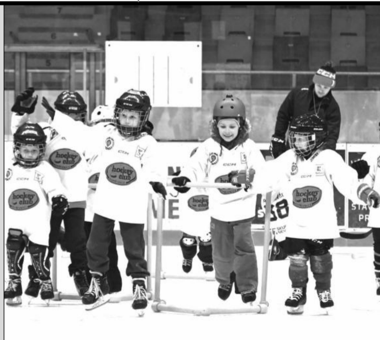
Děti se po aktivitách mimo ledovou plochu přesunuly na kluziště a pořádně si tam všechno kolem bruslení a hokeje vyzkoušely.

Kopřivnice (mha) – S velkým zájmem dětí a jejich rodičů se setkala v Kopřivnici akce s názvem Týden hokeje – Pojd'hrát hokej. V pátek 19. ledna se na zimním stadionu objevilo celkem 38 děvčat a kluků od čtyř let, což je v Kopřivnici rekordní číslo a dvojnásobek počtu z předchozího roku. Děti si mohly vyzkoušet několik sportovních aktivit, jak se obléká do výstroje nebo udělat první krůčky na ledě. Pomáhali jim v tom kromě mládežnických trenérů klubu také někteří hráči druholigového A týmu Kopřivnice. Akce Týden hokeje v letošním roce zavítala do více než sto padesáti klubů v celé České republice. Doposud deseti usku- tečněných Týdnů hokeje se celkem zúčastnilo 37 tisíc dětí.