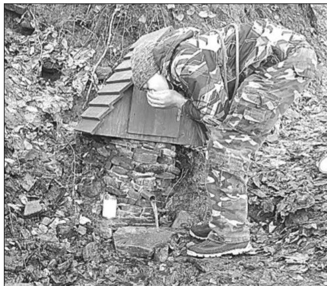
Nově vybudovaná studánka ve svahu Červeného kamene nese jméno Naděje.

Úspěšný zásah mají za sebou městští strážníci. Ve středu 17. ledna vyslal pult centrální ochrany v 00:44 hod. signál, že něco není v pořádku na jednom z objektů v Kopřivnici, který je napojen na PCO. Na místo vyjela hlídka MP Kopřivnice, kde zjistila, že jsou otevřené vstupní dveře. Na místo byla přivolána odpovídající osoba a hlídka OO PCR Kopřivnice. V součinnosti s policií strážníci zadrželi pachatele, který se do objektu vloupal.