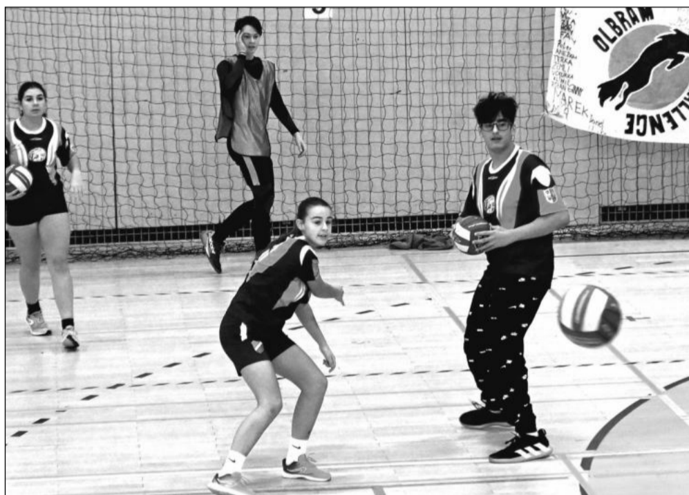
Základní škola ZŠ Emila Zátopka (na snímku) měla zastoupení v obou kategoriích. V mladší kategorii skončila třetí a ve starší slavila stříbro.

Dodgeball by se dal charakterizovat jako atraktivnější a více adrenalinová verze všem dobře známé vybíjené. Je to týmový sport, hraje se šest s pěti míči najednou. Dodgeball se více a více dostává do škol a mezi mládež a dalším důkazem rozvoje tohoto sportu je turnaj kopřivnických základních škol, který byl rozdělen do dvou kategorií. Ve skupině šestých a sedmých tříd byly celkem tři školy a prvenství získala ZŠ 17. listopadu před ZŠ Alšova a ZŠ Emila Zátopka. Ve starší kategorii osmých a devátých tříd bojovaly čtyři týmy a vyhrála ZŠ Milady Horákové před ZŠ Emila Zátopka a ZŠ Alšova, čtvrté místo obsadila ZŠ 17. li-