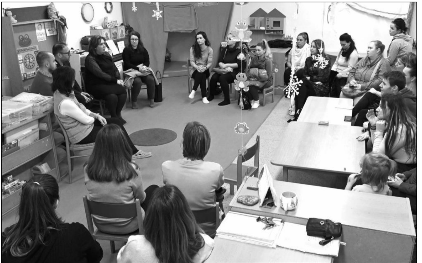
Informační schůzka vedení MŠ Pionýrské a zástupců radnice s rodiči dětí, které ji navštěvují, předznamenala připravovanou rekonstrukci. Ta zhruba na čtyři měsíce znemožní běžný provoz ve stávajícím objektu.