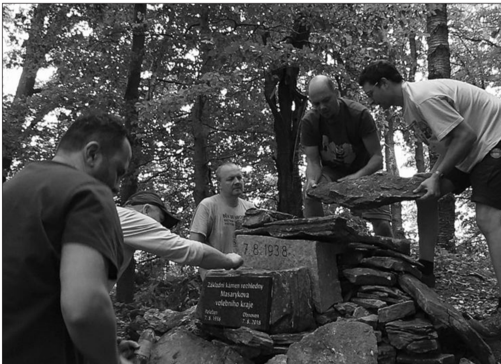
V polovině října místní skauti společně se členy místní MDH obnovili pobořenou kamennou mohylu se základním kamenem Masarykovy rozhledny.

V Kopřivnici bude sbírka potravin probíhat v době od 8 do 18 hodin na třech místech. V prodejně Lidl budou moci nakupující podpořit kopřivnickou pobočku Armády spásy, v Tesco Charitu Frenštát pod Radhoštěm. Třetím místem, kde by dle organizátorů sbírka měla probíhat, je Kaufland, který získané zboží předává Potravinové bance. Ve všech prodejnách budou dobrovolníci zapojených organizací rozdávat nakupujícím letáky s informacemi, co je vhodné darovat.