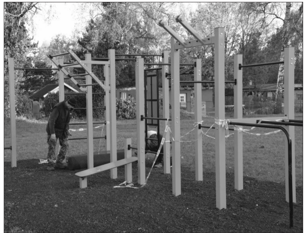
Přípravou dopadových ploch finišují pracovníci Správy sportovišť Kopřivnice instalaci nejen workoutového hřiště na 'házeňáku', ale také houpaček pro děti.