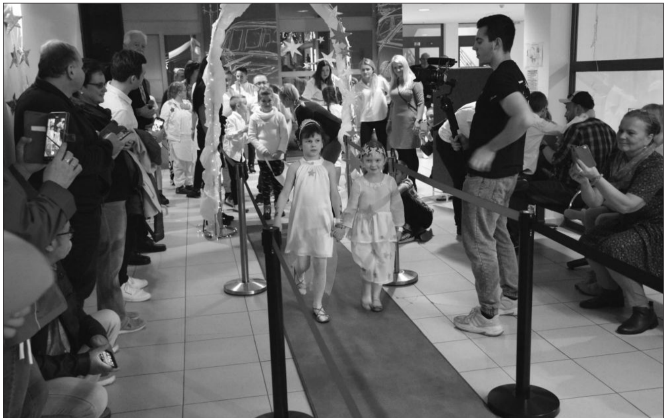
Už třetím rokem zpestřuje přestávku v programu přehlídky Motýlek módní přehlídka připravená pedagogy a žáky pořádající MATEŠKÉ A ZÁKLADNÍ ŠKOLY MOTÝLEK. Více k tématu na straně 3.