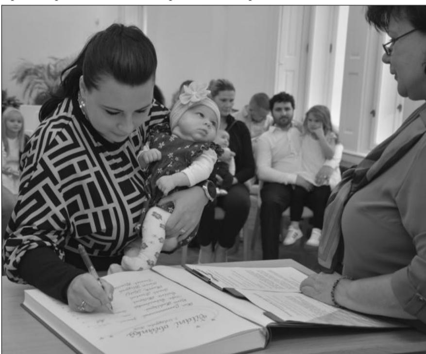
Před týdnem proběhlo poslední vítání občánků města v letošním roce. Celkem starosta přivítal 106 novorozenců dětí. FOTO: DANA HOĐÁKOVÁ

Další vítání občánků se uskuteční až na jaře příštího roku, termíny budou zveřejněny v průběhu ledna.