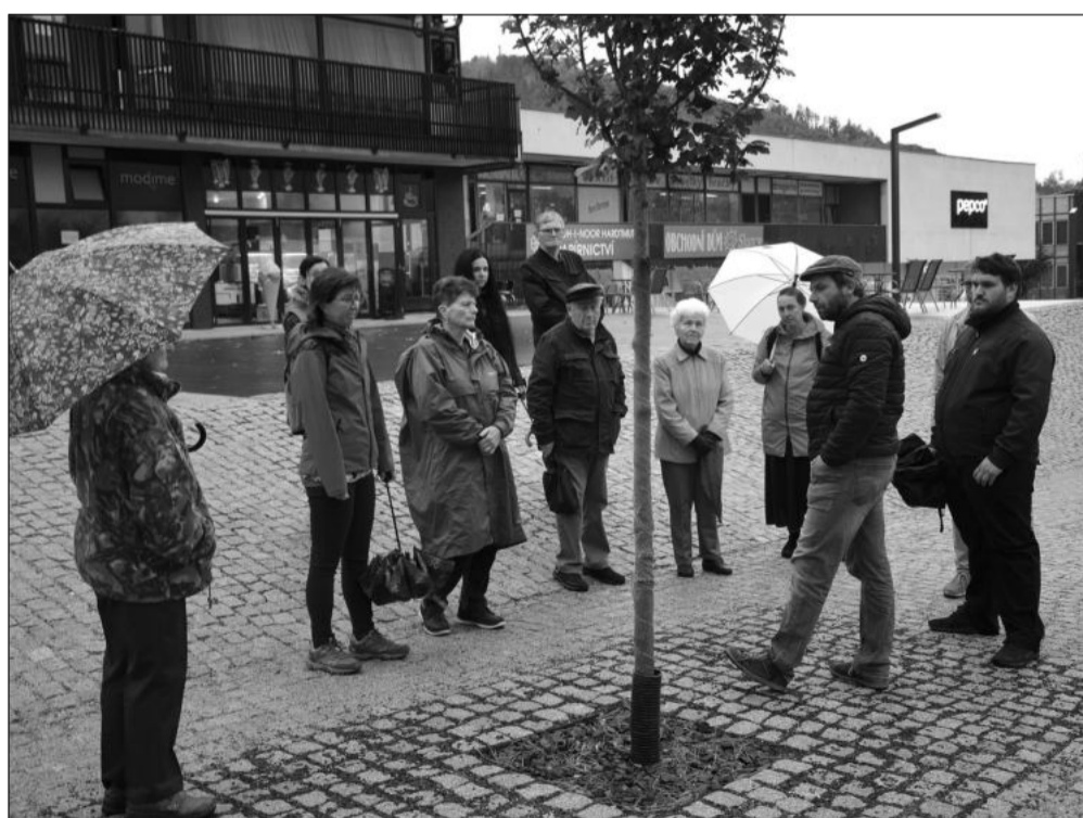
Účastníci Procházky s Habrem, která proběhla v poslední říjnový den, se dozvěděli, proč byly v centru vysazeny právě vybrané druhy okrasných rostlin.

Účastníci procházky se mimo jiné dozvěděli, jaké druhy stromů, trvalek a cibulovin byly v centru města vysazeny. Hovořilo se také o výsadbě stromů do rozměrných mobilních nádob v Červeném háji a o extenzivní zelené střeše proskleného pavilonu, která byla osázena stovkami okrasných nízkých trav, trvalek a cibulovin do speciálního odlehčeného substrátu pro zelené střechy.