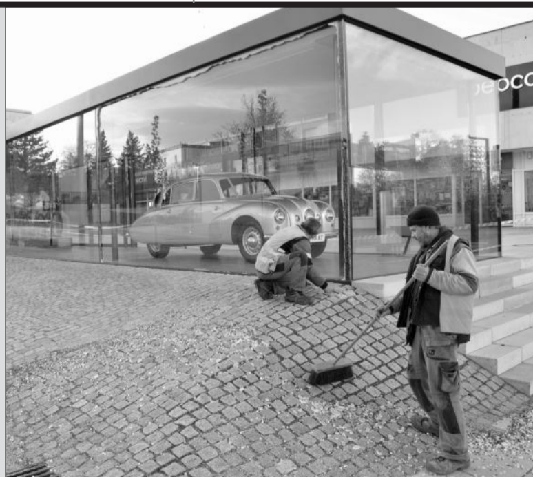
Pracovníci Slumeka při odklizení zbytků roztrženého skleněného stěny výstavního pavilonu. K její destrukci došlo minulý čtvrtek.