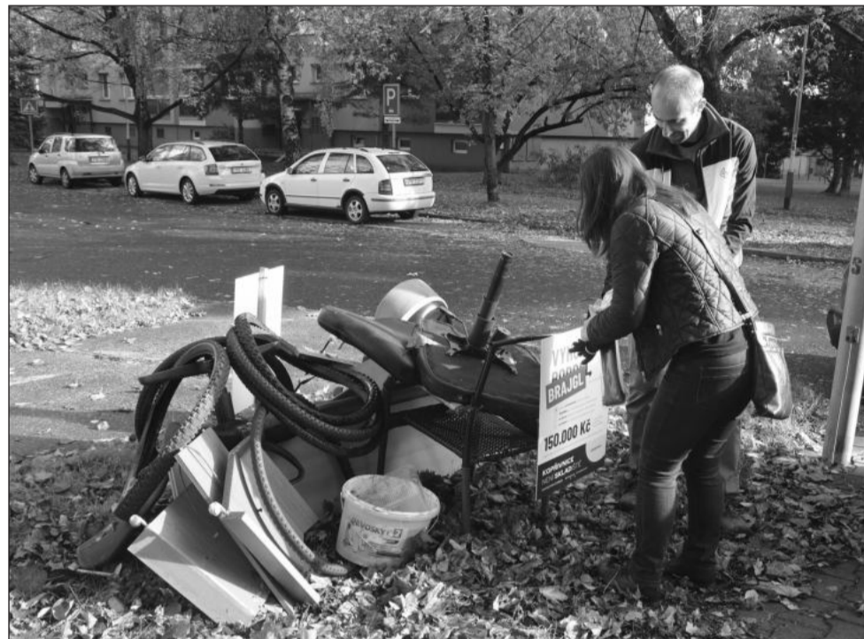
Sesbíráním odpadu odloženého u kontejnerů na hromadu chtěla radnice upozornit na nešvar vytváření černých skládek. Kampaně má trvat dva týdny.