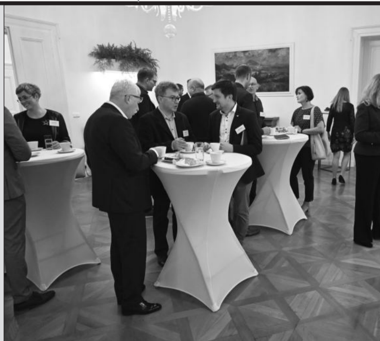
Kromě připravených prezentací si zástupci firem na snídání s vedením města vychutnali i neformální diskuzi.

Kopřivnice (dam) – Zástupci zhruba dvou desítek zpravidla větších výrobních firem působících v Kopřivnici v pátek 27. října přijali pozvání vedení města na pracovní snídání v Ringhofferově vile. Během dopolední akce byli podnikatelé seznámeni s plánovanými investičními akcemi města i s možnostmi spolupráce například v oblasti informovanosti. Podnikatelé se pak v diskuzi zajímali například o budoucí obchvat Vlčovic a jeho vliv na dopravní napojení průmyslového parku, o možnosti dalšího rozšíření průmyslové zóny nebo zazněly i úvahy o zavedení městské hromadné dopravy v Kopřivnici. (Pokračování na straně 2)