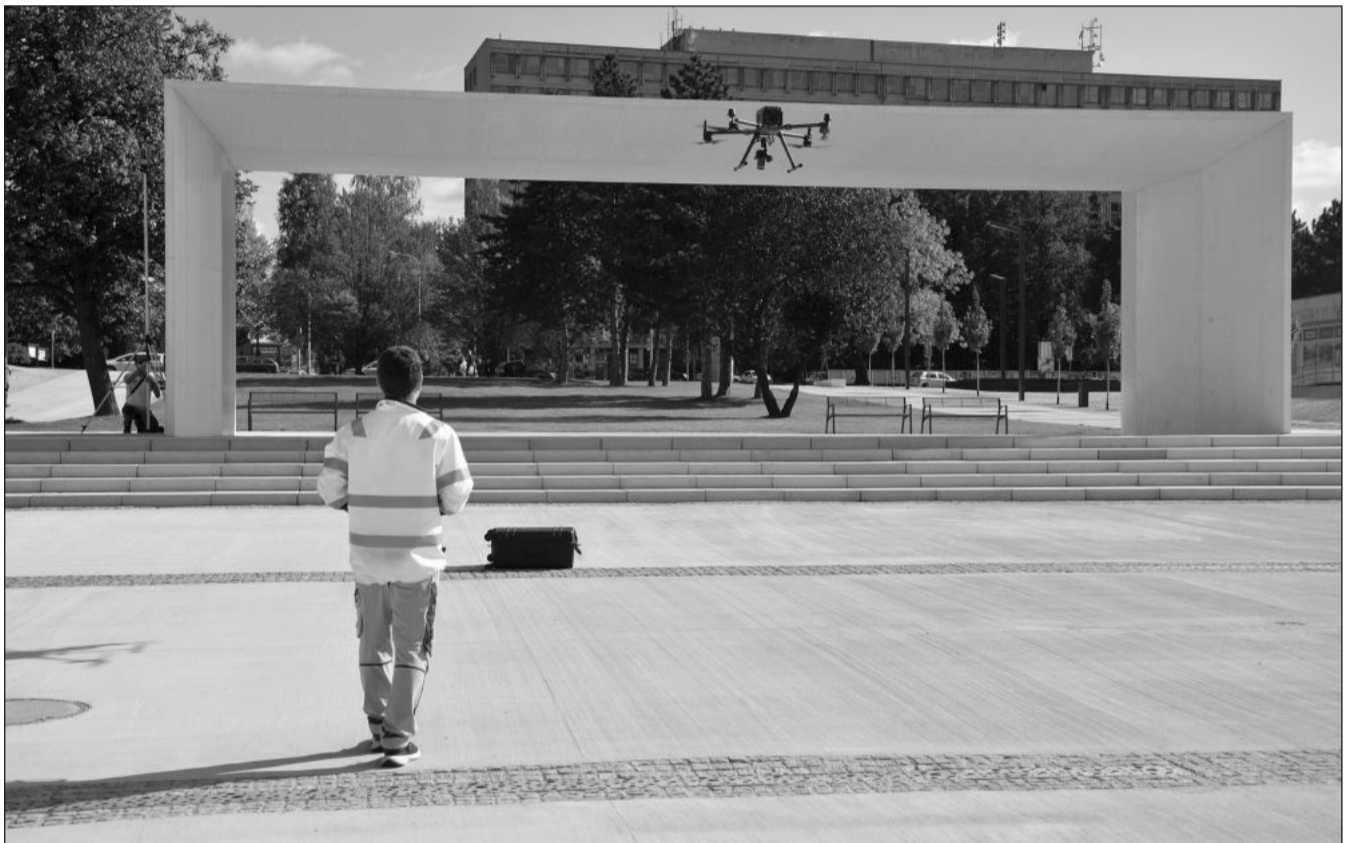
Mimo jiné za pomoci dronu a použití letecké fotogrammetrie byly minulý pátek s vysokou přesností měřeny spády betonových ploch v okolí Lašské brány v centru města. Revitalizace by se ale už měla chýlit ke konci.