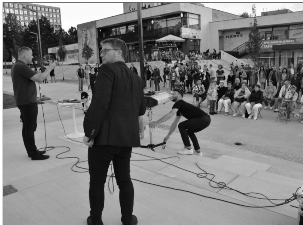
Jeden z posledních teplých večerů využily desítky Kopřivničanů k návštěvě komentované projekce Brutální Kopřivnice. K vidění byly snímky vybraných kopřivnických staveb s komentářem architektů. Akce byla uspořádána v rámci celostátních Dnů architektury.

Poté, co bude ukončeno připomínkové řízení veřejnosti, členové pracovní skupiny došlé připomínky vyhodnotí a případně je do strategického dokumentu zapracují. V listopadu se budou Zdravotním plánem na období 2024–26 zabývat radní a po nich na prosincovém zasedání i zastupitelé.