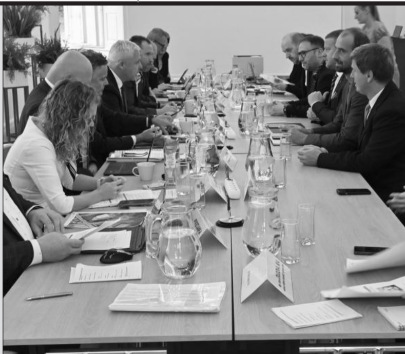
Kopřivnice na začátku tohoto týdne hostila společné jednání rady města i Moravskoslezského kraje.