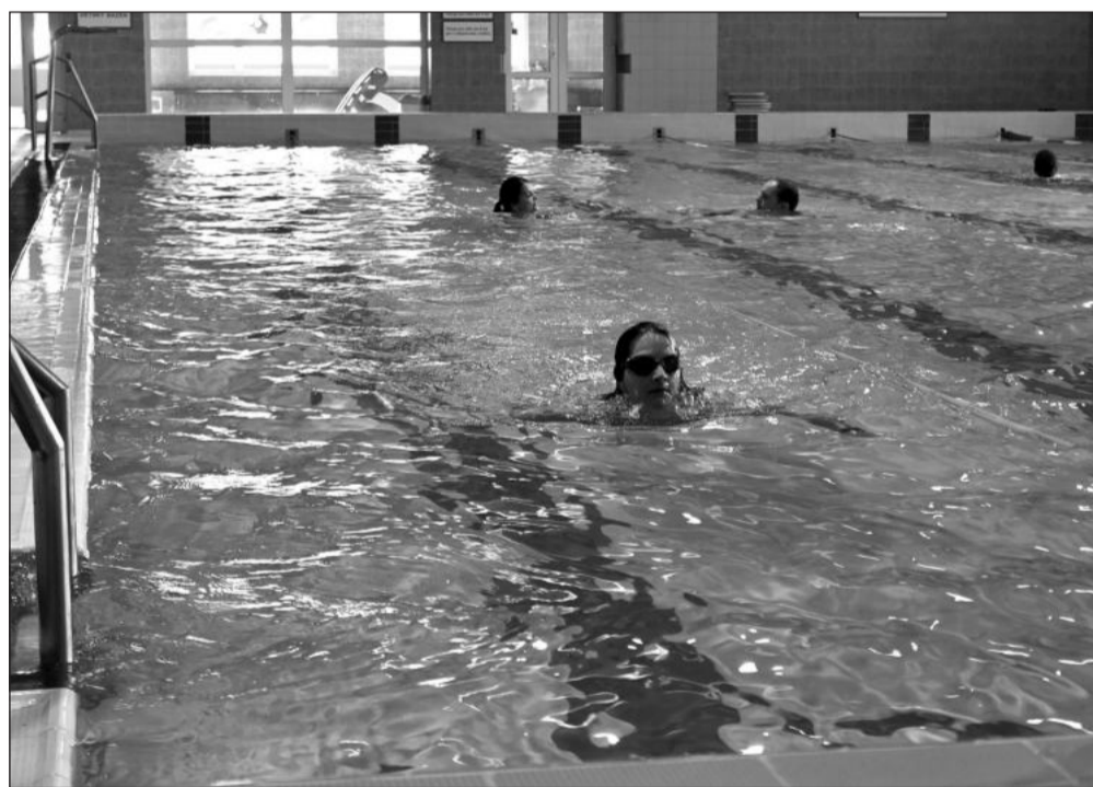
Ve středu 4. října se Kopřivnice zapojila do 32. ročníku plavecké soutěže měst. Letos místní plavci vylovili ze dna krytého bazénu pro své město stříbro.