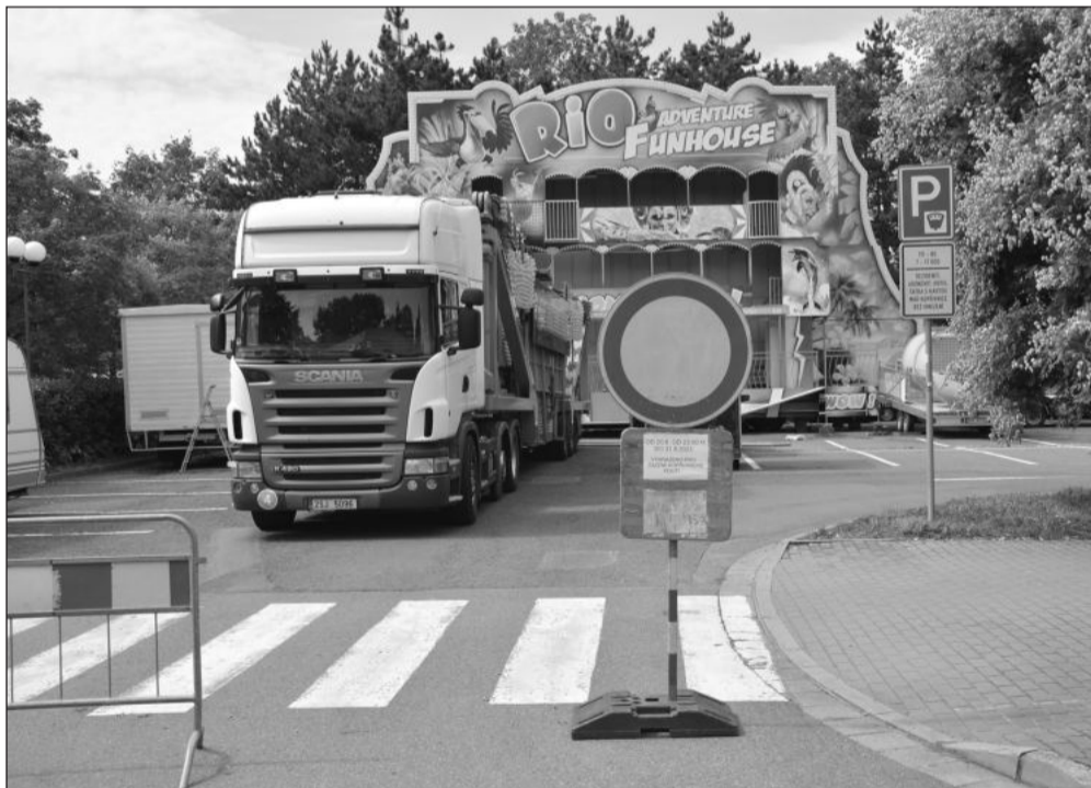
Už od pondělí je parkoviště u supermarketu Albert obsazeno pouťovým lunaparkem. Řidiče v tomto týdnu a především o víkendu čekají i další omezení.

Se změnou technologie prací se mění i cena celé zakázky, která bude možná trochu paradoxně dokonce o necelých 40 tisíc korun levnější při použití protlaku než u klasického výkopu. Město má stavební společnost Staspo, s. r. o., zaplatit zhruba 3,3 milionu korun.