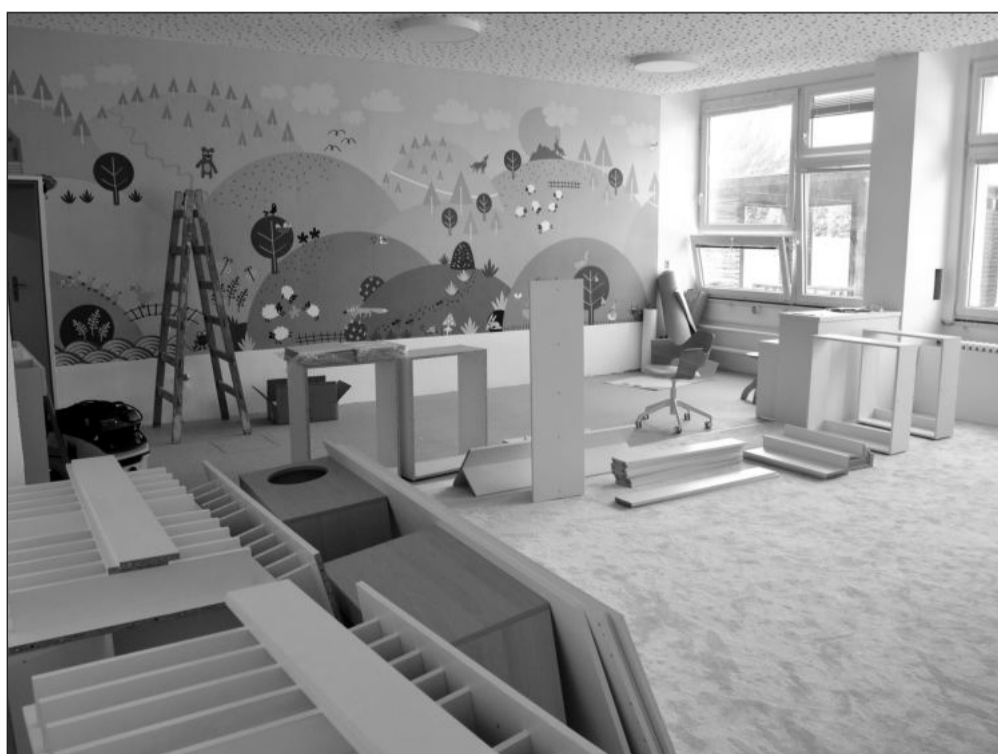
Práce na vybudování nové třídy v Mateřské škole Polárka finišují. Děti, které v minulém týdnu prošly mimořádným zápisem, nastoupí již od září.