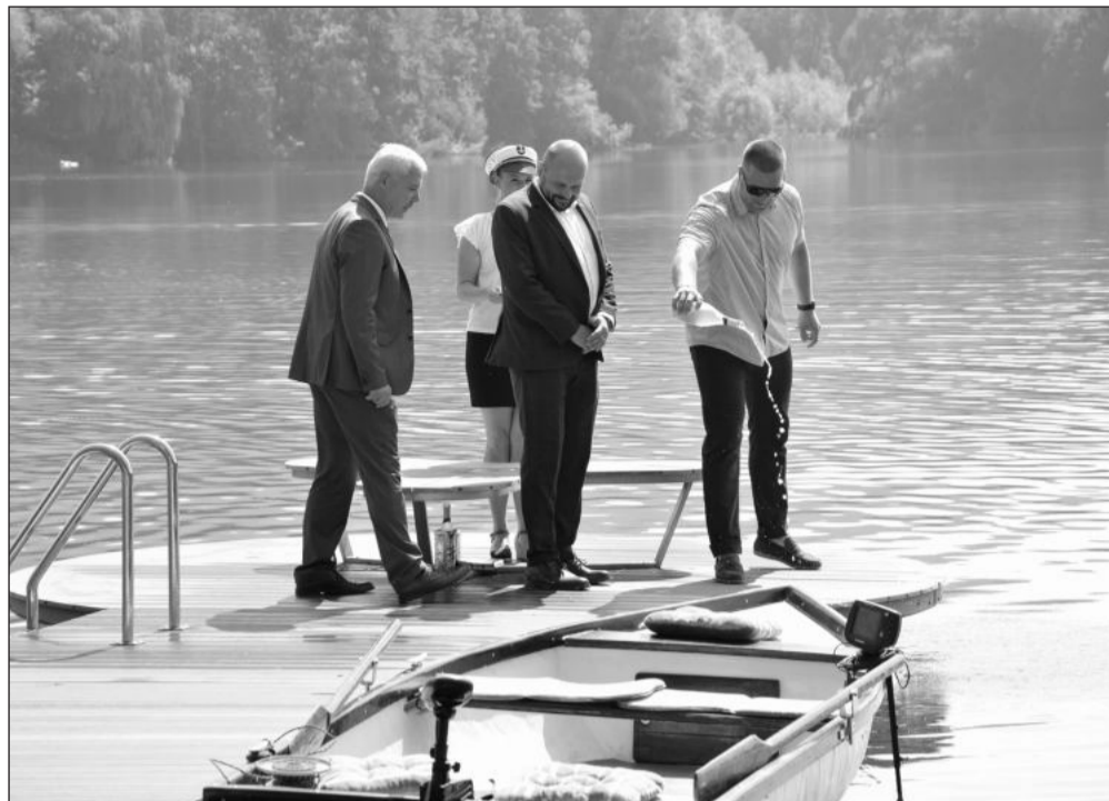
Molo na větřkovické přehradě se dočkalo oficiálního otevření. Po křtu zástupci města, kraje a Tatry se rozjela pirátská a námořnická párty se soutěžími pro děti.