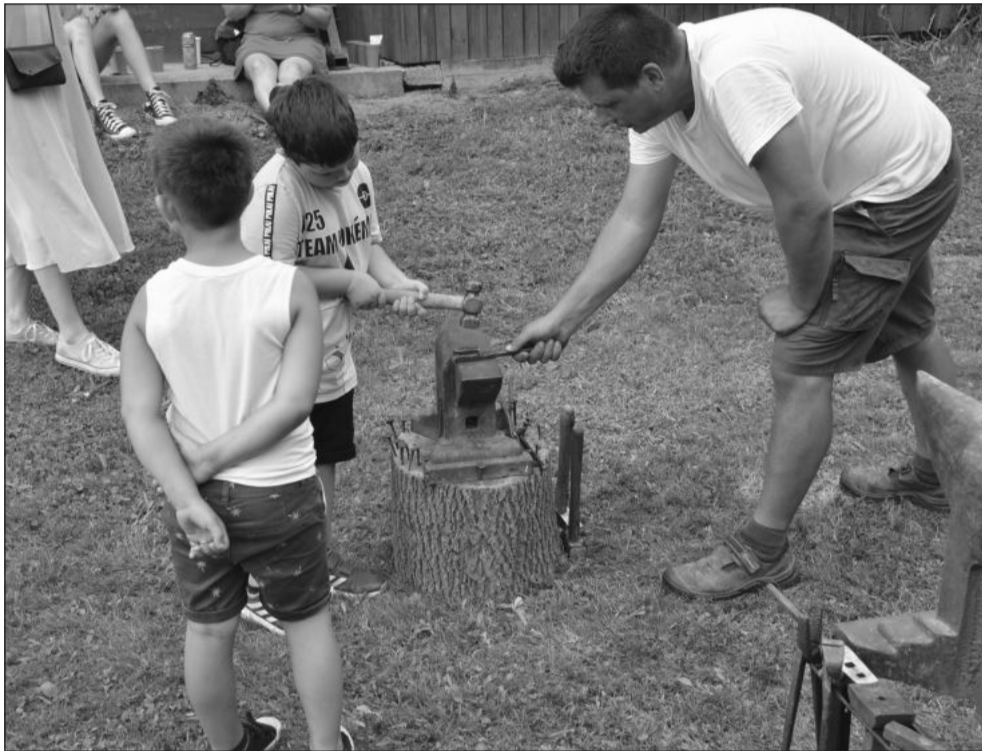
V rámci programu Letních slavností v Mniší si přítomní mohli vyzkoušet práci u kovadliny a vykovat vlastnoručně železný hřebík.