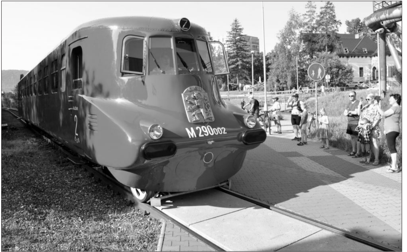
Poprvé od svého návratu s opraveným motorem opustila Slovenská strela kopřivnický výstavní depozitář. V sobotu 19. srpna odjela na nádraží Ostrava střed, kde u tamního železničního muzea proběhl Den se Slovenskou strelou.

„Už před tímto dodatečným zápisem byly v mateřských školách umístěny všechny kopřivnické děti, které dosáhnou věku tří let do září. Uvolnění potřebné kapacity v mateřských školách se podařilo dosáhnout i rozšířením přípravných tříd pro předškoláky. Nyní díky nově vybudované třídě v Polárce získáme prostor pro uspokojení poptávky u rodičů o něco mladších dětí,“ říká místostarosta David Monsport, odpovědný za oblast školství. Situaci s nedostatkem míst ve školách se místní radnici podařilo částečně vyřešit ve spolupráci se školami, které nabídly alternativu dětem v posledním roce předškolního vzdělávání. Město ve spolupráci s řediteli škol našlo prostor pro otevření dvou nových přípravných tříd. Zatímco vloni je v Kopřivnici navštěvováno 14 dětí v jedné škole, od září začnou přípravné třídy fungovat na třech místních školách a nastoupí do nich 42 dětí. (Pokrač. na str. 3)