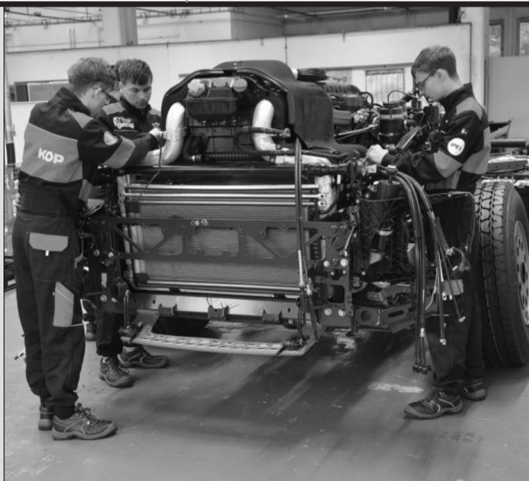
Fotografie z posledního montážního dne kopřivnického zapojení do projektu Tatra do škol.

Ve čtvrtek 29. června studenti se svými pedagogy pod dohledem pracovníků Tatry usadili na již dříve zkompletovaný podvozek kabiny vozidla. Provedli propojení všech elektronických systémů kabiny a podvozku a po třinácté hodině odpoledne byla tatrovka, která bude škole sloužit jako vozidlo autoškoly, poprvé nastartována. (Pokračování na straně 3)