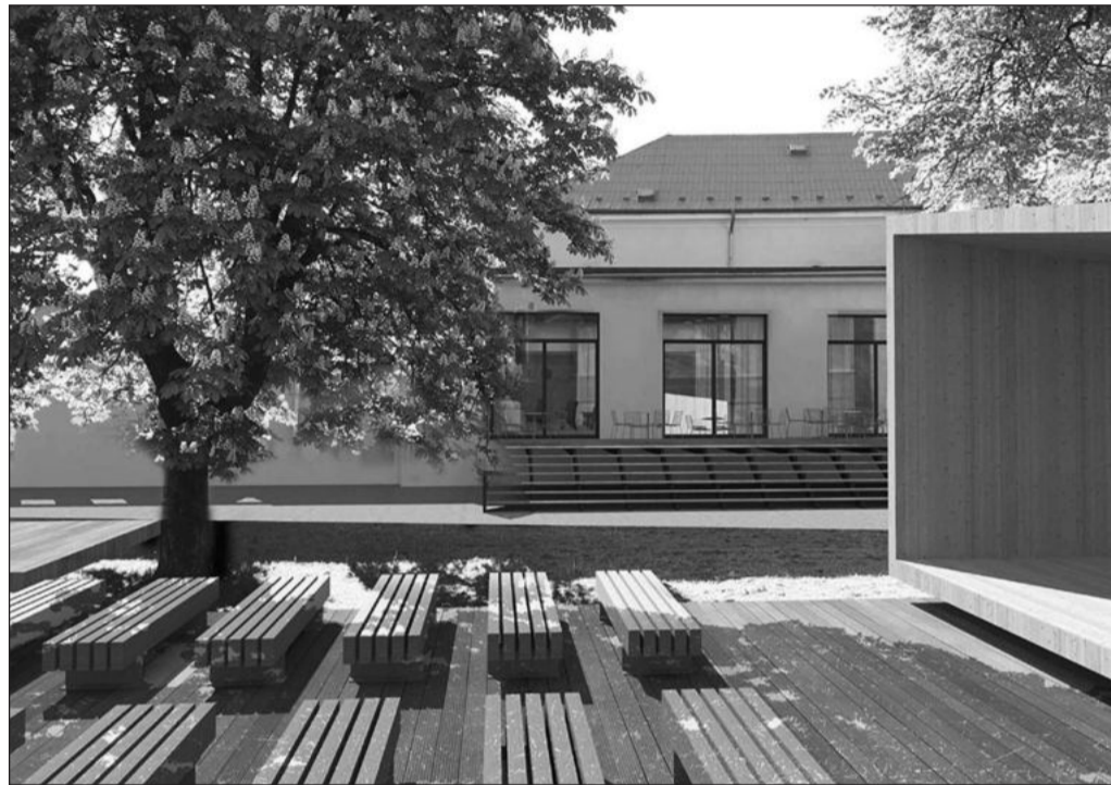
Vizualizace budoucího vstupu do upravené zahrady Katolického domu. Její proměna bude znamenat uzavření chodníčku, který místní využívali jako zkratku.

Lidé, kteří se společného nákupu účastnili a rozhodnou se nabídku využít, budou moci nové smlouvy v dalších týdnech podepisovat elektronicky. Nebo vše vyřeší osobně na kontaktním místě v prostorách radnice. O termínu jeho provozu budou informováni individuálně.