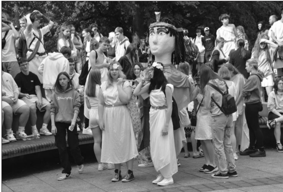
Obnovené poslední zvonění vycházejících žáků devátých tříd kopřivnických základních škol se uskutečnilo v předposlední školní den v antickém stylu.

Nedodržení termínu může zhotovitelkou firmu přijít skutečně drah. Sankce totiž podle smlouvy činí 0,1 % z ceny díla bez DPH za každý započatý den prodlení. Pokuta tak může dosáhnout vyšších desítek tisíc za každý den protahování stavby. Vyhráno navíc dodavatelská firma nebude mít ani v případě, kdy dílo předá s vadami. Pokud totiž nedodrží lhůtu pro jejich odstranění, přicházejí ke slovu další smluvní sankce. Každá neodstraněná vada je případně sankciována předem stanovenou částkou za každý započatý den prodlení, a i zde tak může jít v součtu o citelné sumy.