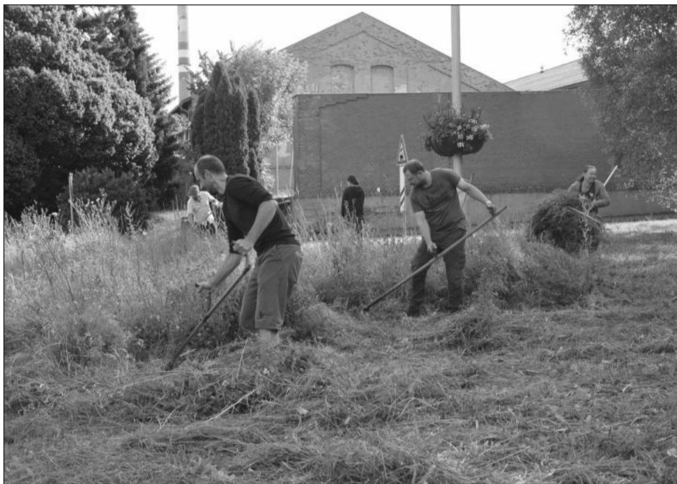
V závěru června proběhlo ruční posečení květnaté louky u budovy radnice. V sobotu by se měl workshop sekání s kosou uskutečnit na zdejší sjezdovce.

Lidé budou moci staré nevyhovující kotle 1. a 2. emisní třídy vyměnit za tepelné čerpadlo, na které mohou získat až 180 tisíc korun, nebo za kotel na biomasu s podporou 130 tisíc korun. Podmínky dotace a elektronická žádost jsou zveřejněny na webu Lokální topeniště a na elektronické úřední desce krajského úřadu.