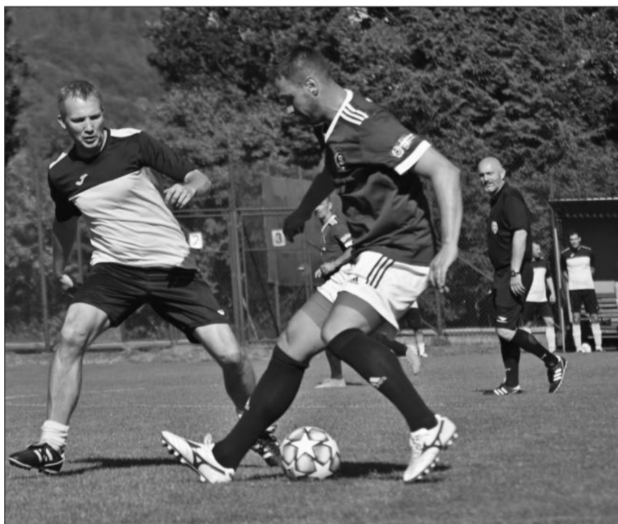
Hlavní utkání dne mezi starými gardami Vlčovic-Mniší a Sparty Praha (tmavší dresy) přineslo devět gólů a těsnou výhru hostů.

Vlčovice (mha) – Bezmála pět stovek lidí se přišlo o druhé prázdninové sobotě podívat na oslavy 90 let od založení vlčovickeho fotbalového klubu. A byl to krásný letní den plný zábavy a hlavně dobrého fotbalu. Nejprve v předzápase juniorů domácí tým Vlčovic-Mniší otočil zápas s Novým Jičínem a vyhrál 4:3. Poté v hlavním utkání dne stará garda Sparty Praha v souboji plném krásných branek těsně přehrála domácí tým FC Vlčovice-Mniší 5:4. Fanoušci si užívali jednak mnoho borců ve svém týmu, které již tak často na zeleném pažitě nevidá, ale také hostující plejery a spartánské legendy – na trávník vyběhli a své umění předvedli například Jiří Novotný, Martin Frýdek, František Straka, Josef Jarolím nebo Miroslav Slepíčka. „Myslím, že jsme viděli krásný ofenzivní zápas, který se dle reakcí divákům líbil, a to je hlavní. Navíc naši kluci vybojovali moc pěkný výsledek, před deseti lety při oslavách 80 let fotbalu jsme se Spartou prohráli tuším 2:9, tentokrát to tedy bylo mnohem lepší a až do konce zápasu jsme byli ve hře,“ hodnotil oslavy 90 let fotbalu ve Vlčovicích jeden z organizátorů akce Oldřich Hrnčárek. Kompletní report včetně foto, sestav týmů či střelců branek přinese v příštím vydání KN (3. srpna).