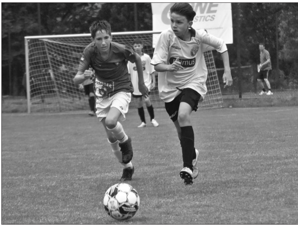
Malí fotbalisté Lubiny (tmavší dresy) v tomto utkání porazili Příbor 4:2, ale v konečném zúčtování skončil výše Příbor.