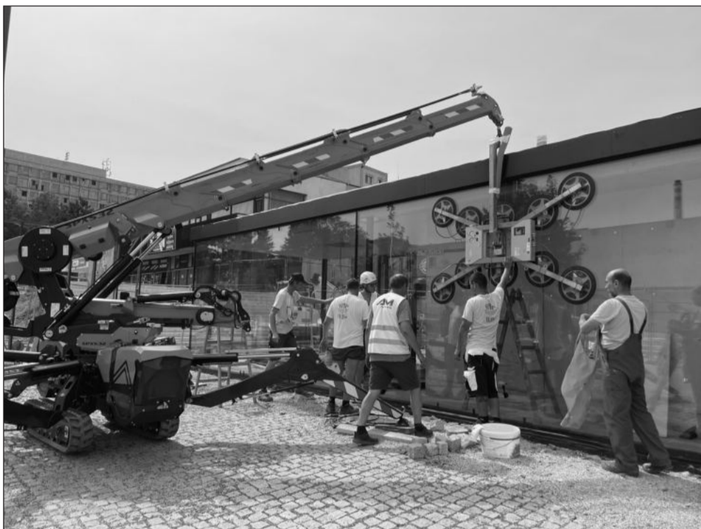
Práce na revitalizaci centra pokračují. V závěru minulého týdne došlo k instalaci zhruba tunu těžkých skleněných stěn do objektu budoucího výstavního pavilonu.