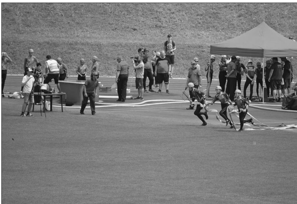
Družstvo starších žáků SDH Mniší na Mistrovství ČR v Novém Jičíně předvedlo nejlepší požární útok s nástřikovými terči a vybojovalo první místo v této královské disciplíně.