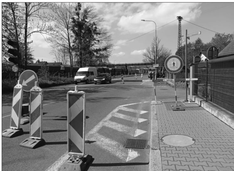
Rekonstrukce chodníku na ulici Štramberské si vyžádala regulaci dopravy semaforem. Stavební práce by měly skončit ve druhé polovině června.

Smlouva se zhotovitelkou firmou byla pode- psána už minulý týden. Pontony, s. r. o., má pak na realizaci 10 týdnů, což znamená, že koupající by ho mohli začít využívat už okolo 25. července.