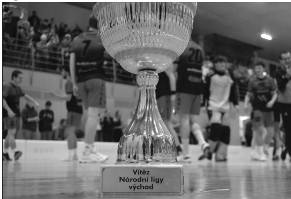
A tým mužů FBC Vikings Kopřivnice zažil skvělé play-off, když se prodral až do finále, kde přehrál Opavu a radoval se z poháru pro mistra soutěže.

Nějakou chvíli po titulu jsme to nechávali pod pokličkou, ale teď už můžu říct, že do první ligy mužů se nepohrneme. Hráčů seniorského věku nemáme v A týmu zase tolik, a protože chceme především pokračovat v doplňování áčka mladíky z juniorky, bude asi lepší setrvat v národní lize, kde jsme byli doposud a kde jsme ročník vyhráli. V několika sezónách ve více než 20leté historii klubu jsme si druhou nejvyšší soutěž vyzkoušeli a víme o čem to je, kolik cestování a obětí to