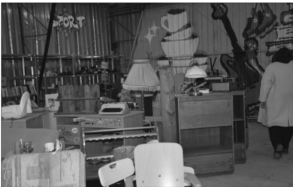
Podíl na snížení množství vyprodukovaného odpadu má i v září otevřené Re-use centrum na ulici Panské, kde odložené věci dostávají druhou šanci.

Kopřivnice (hod) – V pátek 12. května proběhla v rámci Týdne pro rodinu v komunitním Centru Pětka na ulici Francouzské akce s názvem Šťastný pátek. Během ní měli lidé možnost se seznámit se všemi pěti organizacemi, které v tomto zařízení poskytují své služby už pátým rokem. Každá z nich si připravila pro děti interaktivní soutěže, skákací hrad, malování na tělo, fotbal, ping-pong, kulečník a další. Největší zájem ale byl u prezentace techniky, výstroje a výzbroje Městské policie Kopřivnice i Policie České republiky. Děti si mohly vyzkoušet neprůstřelnou vestu, nasadit helmu, potěžkat obušek či ušednout do policejního vozu.