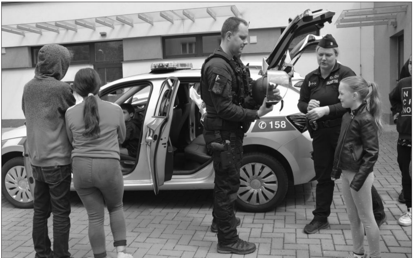
Na akci Šťastný pátek, která proběhla v pátek 12. května v rámci Týdne rodiny v Centru Pětka, byl největší zájem dětí o prezentaci výzbroje i výstroje státní i městské policie, kterou si zájemci mohli vyzkoušet.