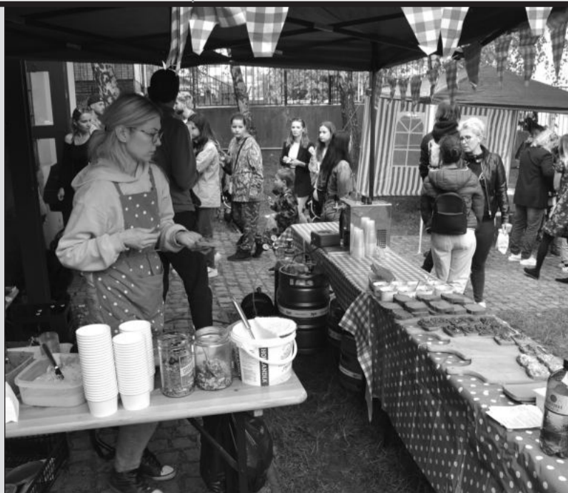
Krátce po druhé hodině dorazily na letošní jarní Restaurant Day stovky lidí. Připravené jídlo ve stáncích velmi rychle mizelo.