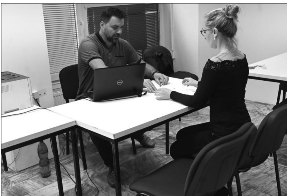
První lidé už v pondělí využili možnosti registrovat se do chystané elektronické aukce energií. Nákup elektřiny a zemního plynu na burze má proběhnout v červnu.

Město každoročně nechává uklízet černé skládky, které vznikají na různých okrajových místech. Celkové náklady za jejich úklid činily 52 564 Kč, kdy bylo vysbíráno 9 615 kg odpadu, což je o 6 tun víc než v roce 2021. „Z tohoto množství bylo 1 800 kg objemného odpadu, 1 320 kg pneumatik, 6 060 kg směšného stavebního a demoličního