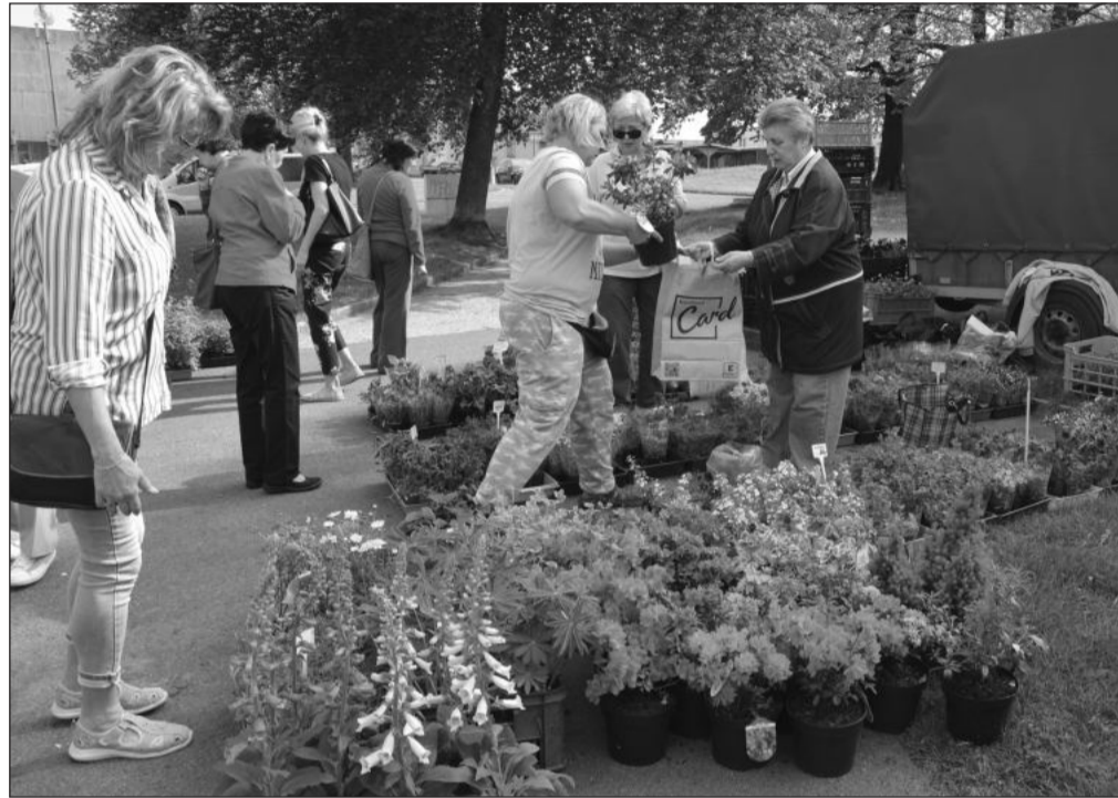
První farmářský trh, který se konal v sadu E. Beneše, lákal zájemce především na sazenice zeleniny, květin, bylinek. Fronty se tvořily i u prodejců uzenin, pečiva.

Pokles počtu nezaměstnaných zaznamenaly v dubnu všechny pobočky úřadu práce na Novojičínsku. V celém okrese se dokonce nezaměstnanost letos poprvé snížila pod tříprocentní hranici. Kopřivnice a okolí aktuálně re- gistrují nejvyšší počet nezaměstnaných na Novojičínsku. Zároveň je zde ale také největší nabídka volných pracov- ních míst. Těch bylo na konci dubna inzerováno 1 172, tedy o 321 více než je dosažitelných uchazečů o zamě- stnání. Počet volných pracovních míst se přitom mezi- měsíčně prudce zvýšil, a to o víc jak čtyři stovky. To je podle ředitele kontaktního pracoviště úřadu práce v Kop- řivnici Milana Tkáče dáno jednak oživením sezonních prací ve stavebnictví či zemědělství, které v tomto období přichází každoročně, ale také větším zájmem o personál z průmyslových firem. Těm se daří získávat nové zakázky a potřebují zaměstnance.