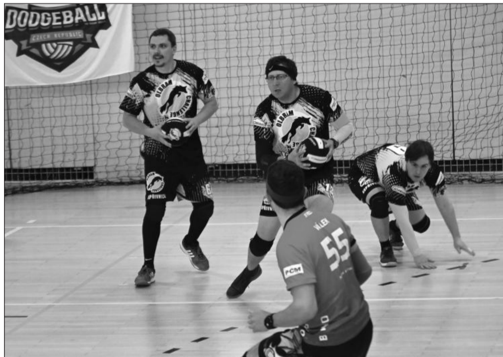
Do finále mužského MČR se v Kopřivnici probojoval domácí tým OCH Kopřivnice (dál od objektu) a celek D-Storm Brno. Z titulu se nakonec radovali Brněňští.

Nejlépe z domácích týmů se dařilo mužskému družstvu,