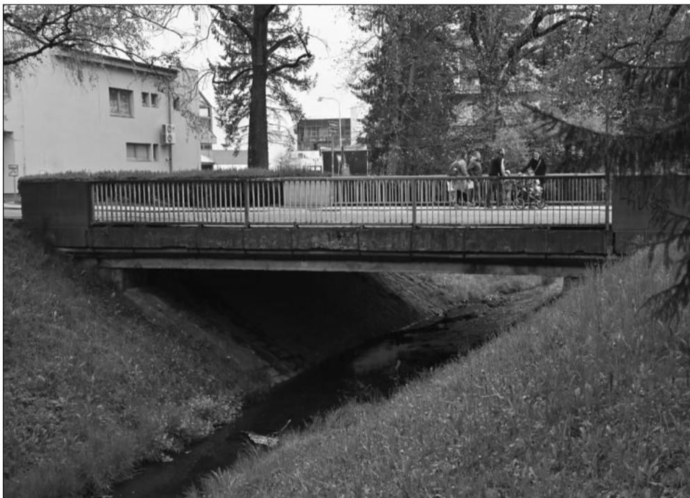
Most přes Kopřivničku na ulici Kpt. Jaroše čeká kompletní rekonstrukce, během které bude důležitá dopravní stavba uzavřena pro automobily.

Hasičský sbor ve Větrkovicích vznikl v roce 1923, kdy měl sbor 58 členů. Nyní má sbor 68 členů, z toho 18 mladších 18 let. Hasiči od svého vzniku zasahují u požárů, povodní, a to nejen na území Větrkovic, ale i v jiných obcích. Pomáhají při sněhových kalamitách a podílejí se na kulturním životě v obci.