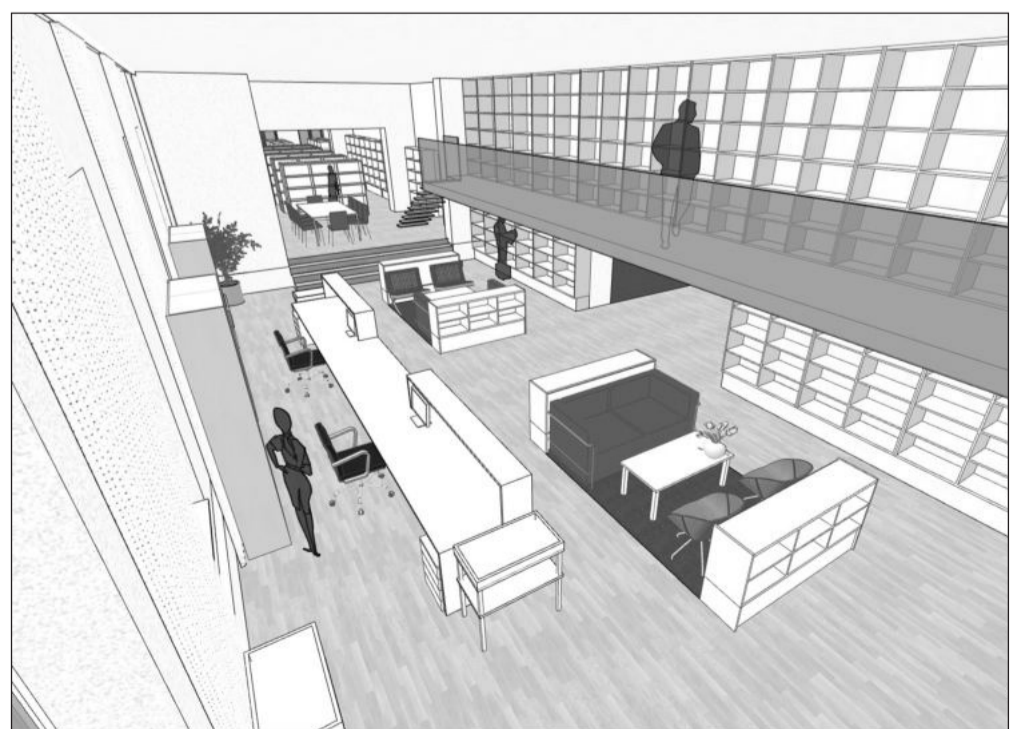
Vizualizace centrálního výpůjčního prostoru budoucí knihovny tak, jak jej v přízemí někdejší ZŠ Náměstí navrhuje schválená architektonická studie.

Kromě zvyšování kvality života a bezpečnosti pohybu na sídlišťích vedou k připravovaným opatřením město i finanční důvody. „Náklady na jedno nové parkovací místo mohou být totiž velmi vysoké, a to v závislosti na tom, zda se v rámci realizace upravuje pouze stávající terén, nebo je z důvodu stavebních úprav nutné přeložit i některé inženýrské sítě. Nákladné je také odvodnění nových odstavných ploch a k jejich provozu nezbytných komunikací,“ dodal vedoucí odboru rozvoje města.