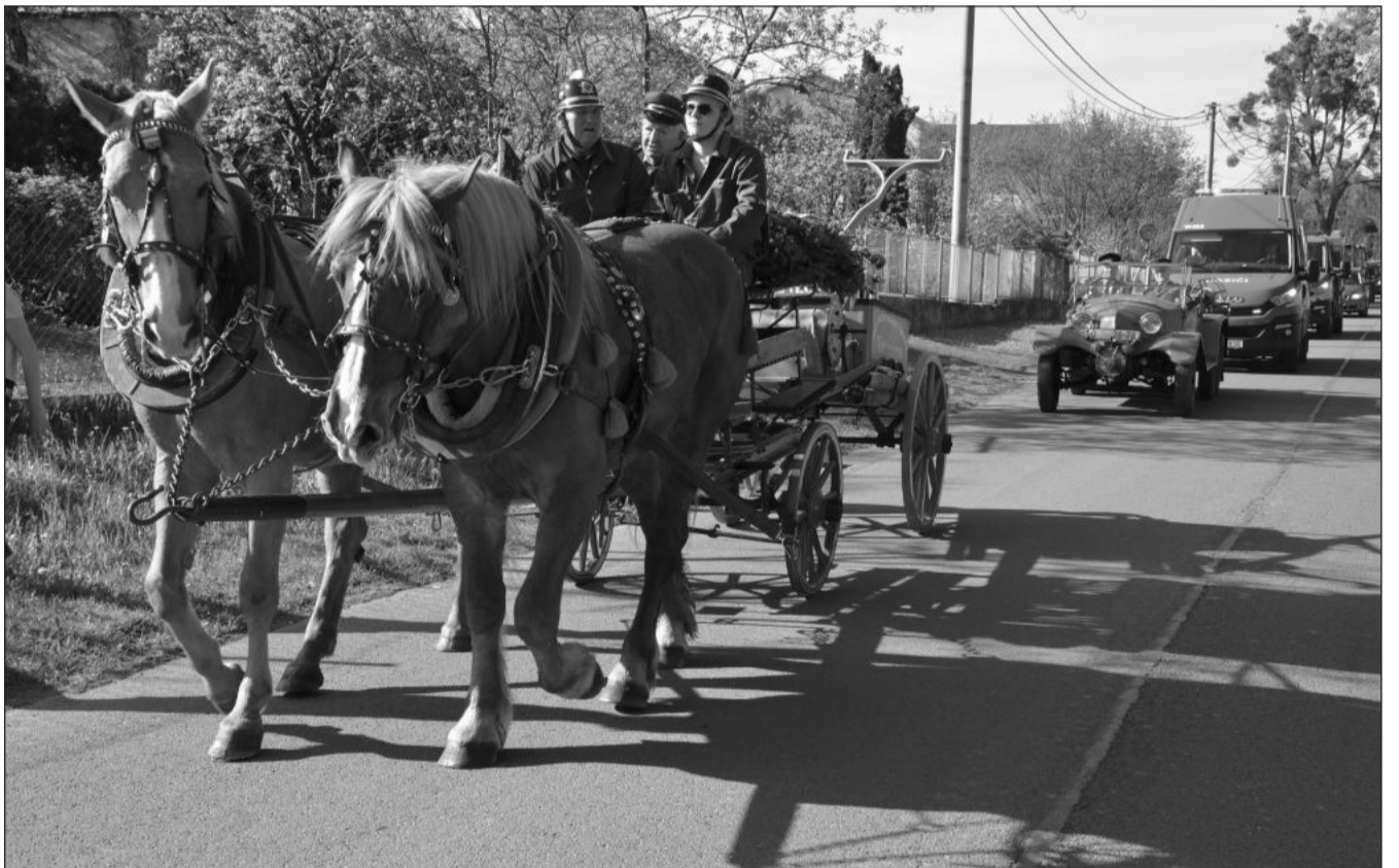
V pátek 5. května slavil Sbor dobrovolných hasičů Lubina II. své stoleté výročí. Po mši svaté za zemřelé hasiče se vydal obcí průvod, v němž nechyběla ani ruční stříkačka z roku 1924 tažená koňmi.

Vozidla se budou počítat v nočních hodinách, kdy se předpokládá, že je většina obyvatel doma. „První výsledky průzkumu by měly být k dispozici v polovině června. V rámci průzkumu bude ověřeno, kde vozidla parkují, zda je to na legálních či nelegálních místech. Současně s tím se mapují volná místa na parkovištích a místních komunikacích. V minulém průzkumu bylo například zjištěno, že některá parkoviště, která jsou vzdálenější od bytových domů, jsou poloprázdná, zatímco vozidla jsou nelegálně odstavována v bezprostřední blízkosti těchto domů. Na základě zjištěných dat bude zvolen další postup. Lze předpokládat postupné stanovení pravidel pro regulaci parkování, obdobných, jako jsou v centru města, kde jsou již stanoveny zóny pro rezidentní a abonentní parkování,“ upřesnil Richard Petr a dodal, že s regulací parkování počítá i Plán udržitelné městské mobility zpracovaný v roce 2019. (Pokračování na straně 2)