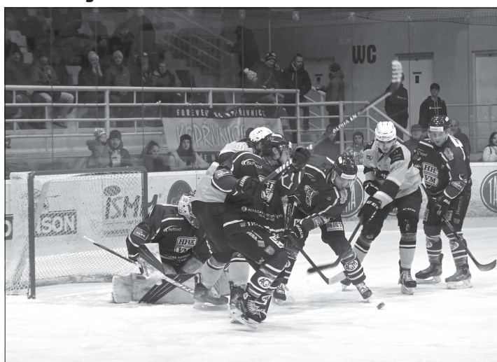
Hokejisté Kopřivnice (světlejší dresy) v tomto utkání 22. kola na domácím ledě porazili Velké Meziříčí 7:4, a uzavřeli tak první polovinu základní části.

Velké Meziříčí sice přijelo jako poslední tým tabulky s pouhými pěti výhrami z dvaceti zápasů, ale na ledě druhé Kopřivnice to tak dlouho vůbec nevydrželo. Hosté začali neobjasně a svisně a už ve 4. minutě šli do vedení. Naštěstí pro Kopřivnici ihned po 15 vteřinách odpověděli šikovnou střelou švihem Velecký a bylo to 1:1. Od této chvíle už domácí nepustili Meziříčí ani jednou do vedení, ale nutno dodat, že dlouho to bylo otevřené a vyrovnané. Domácí sice ve druhé třetině vedli 3:2