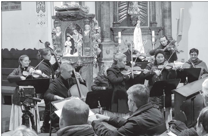
Cimbálová muzika Pramínky společně s chrámovým sborem ze Štramberka a členy Divadla Pod věží uvedli na třetí adventní neděli program Andělův, boží to poslové. S tímto pásmem slavili v létě úspěch na mezinárodním folklorním festivalu ve Strážnici.