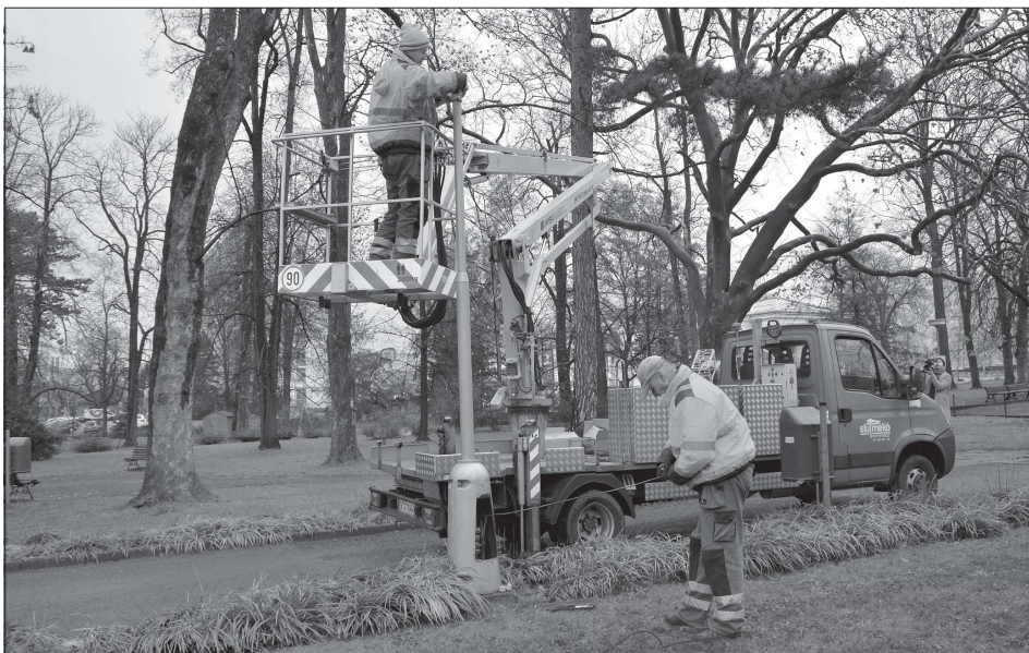
V minulém týdnu pracovníci Slumeka vyměnili v sadu E. Beneše tři dosavadní svítidla za LED světelné zdroje s různou barvou světla. Ta mají umožnit v praxi otestovat, jak jednotlivé druhy osvětlení působí.

Nová předběžná cena tepla pro rok 2023, kterou minulý týden schválila valná hromada společnosti TEPLO Kopřivnice, bude pro odběratele na výstupu z OPS činit 781,99 Kč/GJ a pro cenovou úroveň na výstupu z CZT 699,83 Kč/GJ, přičemž tyto ceny jsou včetně DPH. (Pokračování na straně 2)