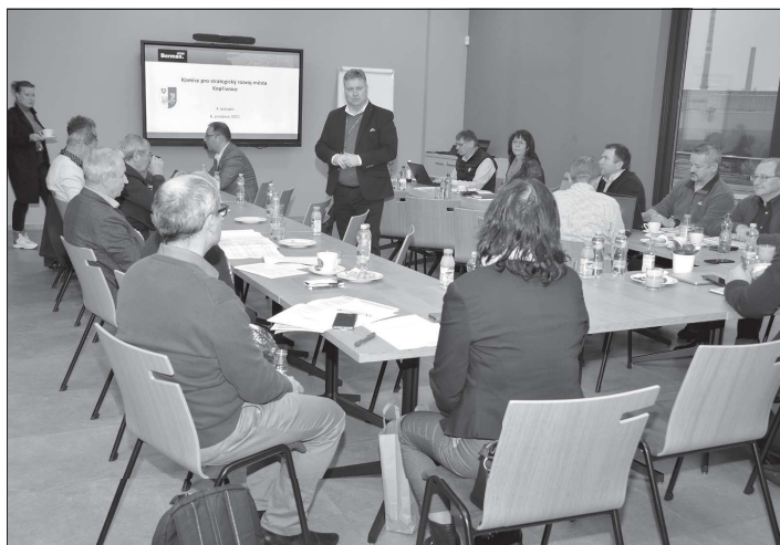
V minulém týdnu členové Komise pro strategický rozvoj svým hlasováním určili priority jednotlivým opatřením Strategického plánu pro další období.

Za týden vychází poslední číslo KN, další až 12. ledna 2023