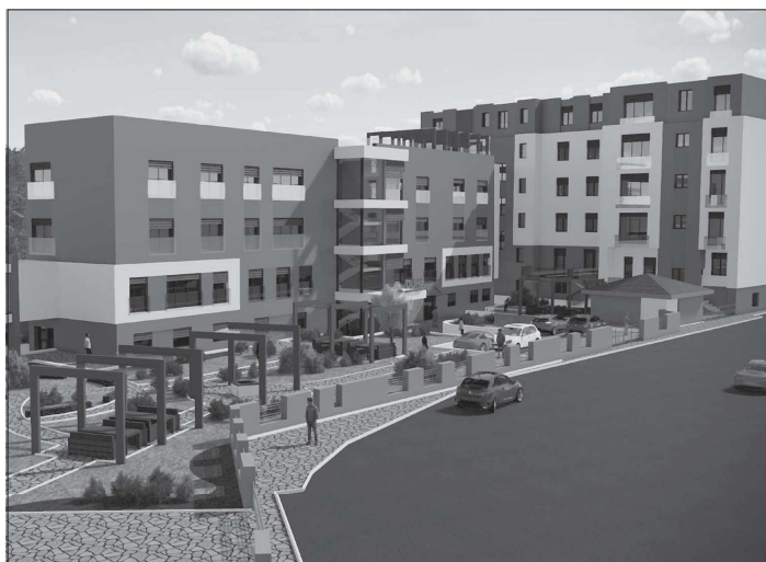
Vizualizace budoucí podoby domova seniorů Duha v Novém Jičíně. Jeho kapacita se po aktuální přístavbě navýší o 30 lůžek.