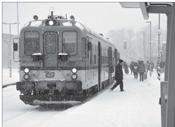
Nový jízdní řád posílil přímé vlakové spojení mezi Kopřivnicí a Ostravou.

V rámci rekonstrukce se objekt zvedne o jedno patro, díky čemuž se navýší kapacita o 30 lůžek. Stavba, kterou bude provádět společnost Strabag, bude trvat skoro dva a půl roku. Moravskoslezský kraj získal na tuto akci od státu 35 milionů korun, zbývajících 171 milionů pokryje z krajského rozpočtu. Další prostředky pak budou potřeba na vybavení domova. „Chceme našim klientům vytvořit důvěrnější, bezpečnější a příjemnější prostředí. Nabídneme jim nové bezbariérové a dostatečně osvětlené prostory s výraznými orientačními body, odpočinkovými kouty i retro prvky. Chceme je zapojit do běžných domácích aktivit, mohou pomáhat s pečením, na zahrádce nebo třeba s převlékáním postelí. Aby zůstali aktivní, byli součástí komunity a měli větší chuť k životu i k péči o sebe. Posílíme tak jejich soběstačnost například při osobní hygieně nebo oblékání. To pozitivně ovlivní jejich zdravotní i psychologický stav,“ vysvětlil náměstek hejtmana Moravskoslezského kraje pro sociální oblast Jiří Navrátil.