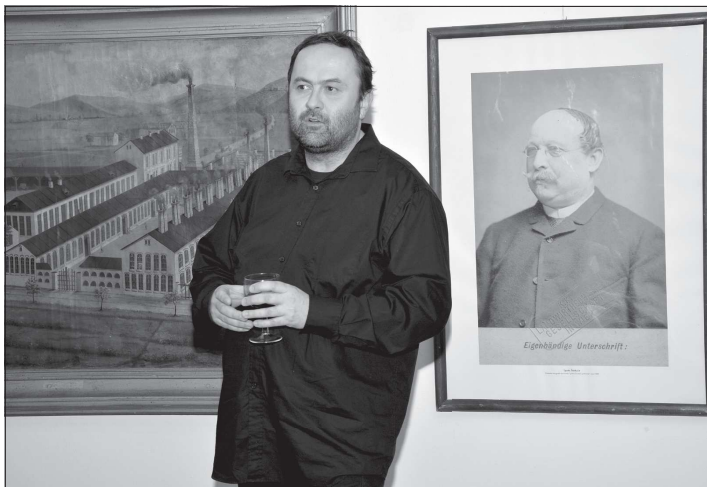
Po otevření aktuální výstavy k dvoustému výročí narození Ignáce Šustaly se zájemci mohli zúčastnit komentované prohlídky s jejím autorem Ondřejem Šalkem.