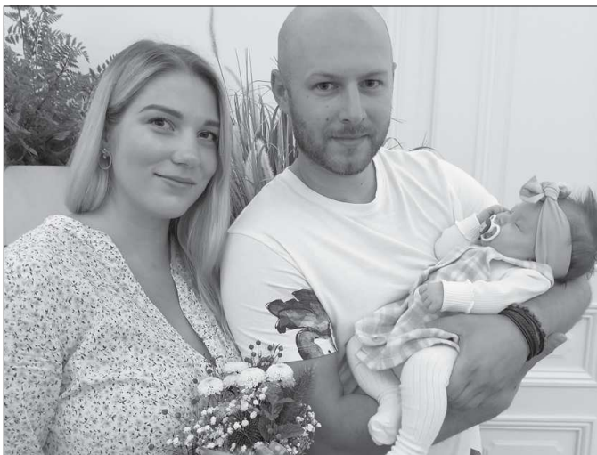
Před týdnem proběhlo v Ringhofferově vile předposlední vítání nových občánků Kopřivnice v letošním roce.

„Další obřad, který bude pro letošní rok poslední, se uskuteční 10. listopadu,“ upřesnila referentka vnějších vztahů Ilona Mazalová, která má vítání občánků na starosti. Na ten se zájemci mohou hlásit už nyní, buď telefonicky na čísle 556 879 436, 737 114 246, nebo e-mailem: ilona.mazalova@koprivnice.cz.