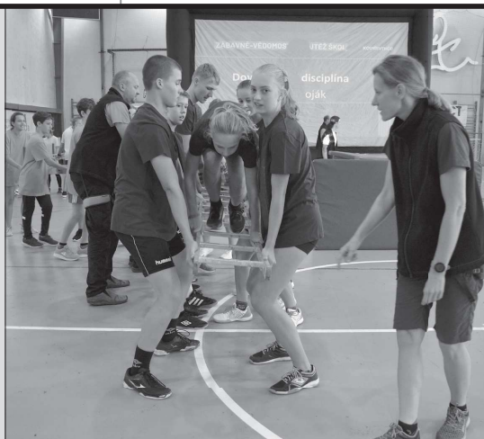
Klání kopřivnických škol kombinovalo akční úkoly s otázkami týkajícími se Zátopkova života.