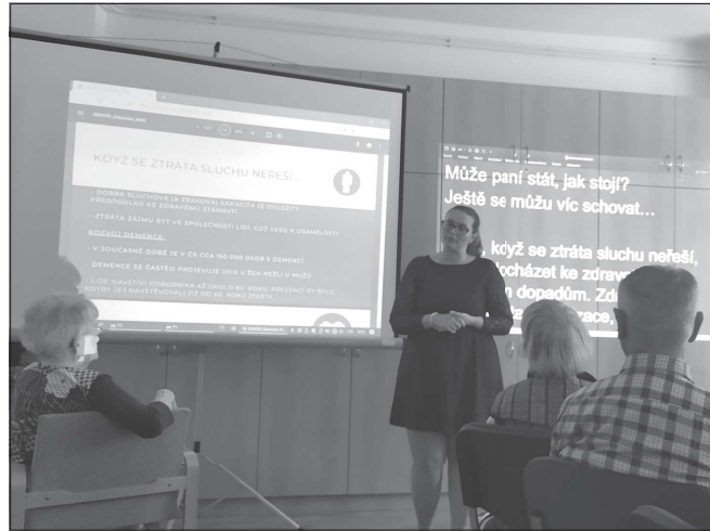
Beseda s názvem Jak nezítat v tichu ukázala seniorům několik tipů, jak si pomoci, aby správně slyšeli a rozuměli při komunikaci se svým okolím.