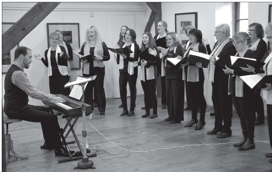
Pěvecké sdružení Kopřivnice v neděli jubilejním koncertem oslavilo sté výročí svého založení. Kromě úprav lidových písní z pera uznávaných skladatelů posluchači slyšeli i transkripci populových písní.