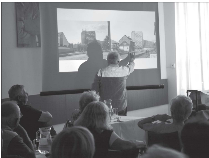
Beseda Pamatuješ? Aneb Kopřivnice je tvůj příběh přivedla do Katolického domu několik desítek lidí, kteří vzpomínali u srovnání současných a historických fotografií.

Na Kopřivnicku bylo na konci srpna jen o 13 uchazečů o zaměstnání víc než v předchozím měsíci a 900 registrovaných lidí bez práce znamenalo podíl nezaměstnaných osob ve výši 3,17 %, tedy o pět setin procenta víc než v červenci. To, že situace na trhu práce zůstává z pohledu zaměstnanců příznivá, ilustruje i skutečnost, že v rámci Kopřivnicka znovu vzrostla nabídka volných míst, mezi měsíčně téměř o stovku na 1 326. Zaměstnavatelé shánějí především montážní dělníky, hlad je také po svářečích, slévačích, kovářích, nástrojářích a příbuzných profesích.