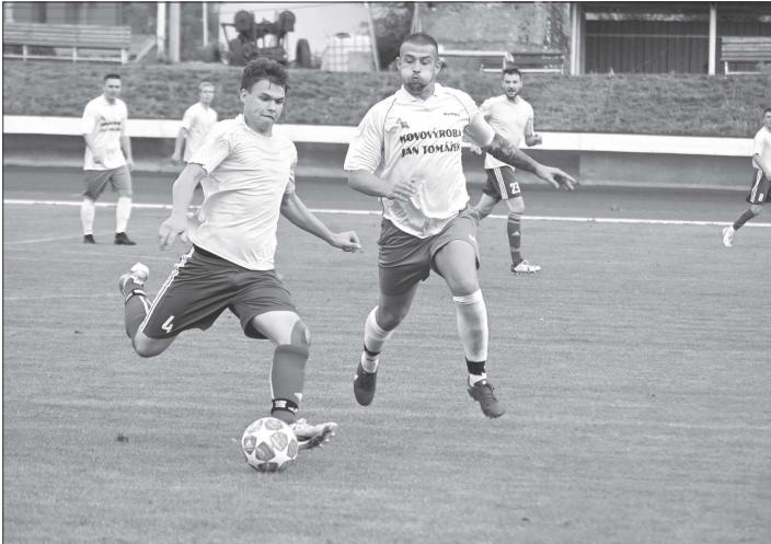
Kopřivnickí fotbalisté v prvním domácím utkání sezony nezaváhali, nováčkoví této skupiny I.B třídy nasázeli šest branek.