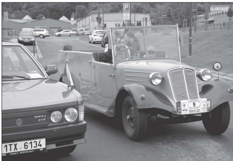
Ke kopřivnické pouti neodmyslitelně patří i jízdy tatrováckými veterány. Ty letos vyjízděly od nového muzea nákladních automobilů a zájemci si mohli vybrat ze dvou tratí. Projet se mohli buďto ulicemi města, nebo areálem automobilky.