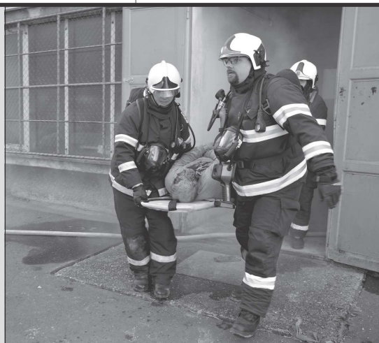
Čtyři jednotky hasičů se zúčastnily taktického cvičení, které proběhlo ve vyřazeném výměňkově na ulici B. Smetany.