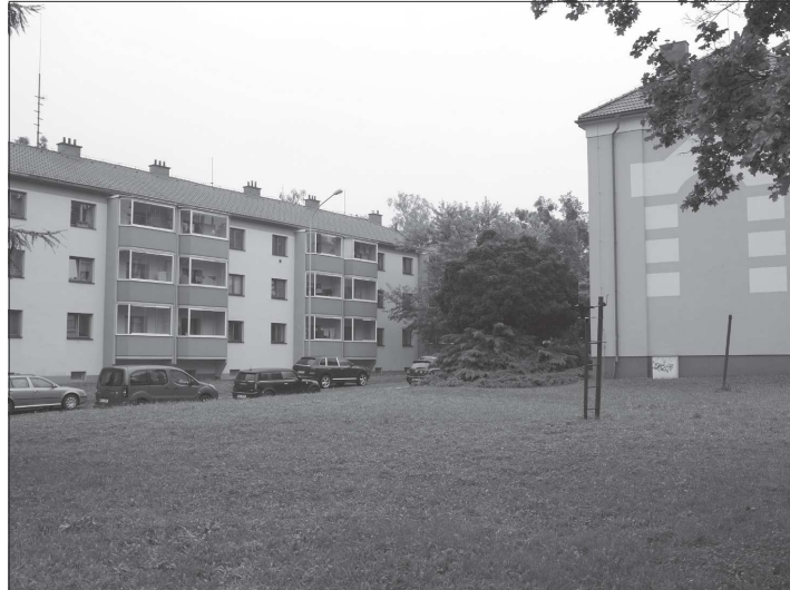
V prostoru s dávno zaniklým volejbalovým hřištěm na rohu ulic Zdeňka Buriana a Javorové MA21 za měsíc začít růst parkoviště s kapacitou 24 míst.

Stavba parkoviště, která má pomoci řešit problematickou situaci s parkováním v této části města, zhoršenou i zábohem parkovišť při stavbě domova pro seniory, má začít na konci září. Na dokončení stavby má pak firma Strabag 70 dnů. Nové parkoviště by tak mělo být k dispozici až začátkem prosince.