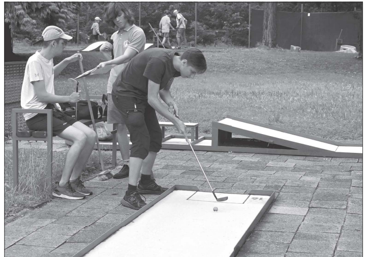
Kopřivnickému minigolfistovi se sobotní domácí turnaj nadmíru vydařil, čtyři kola zahrál na 99 ran, tedy v průměru 24,75 na kolo.