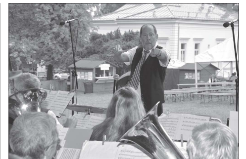
Nedělní program utrpěl tím, že k deštovým srážkám se přidalo i ochlazení a publika na všech akcích výrazně ubylo. Městský dechový orchestr Kopřivnice ale svůj koncert odehrál, i když se musel obejít bez mažoret.