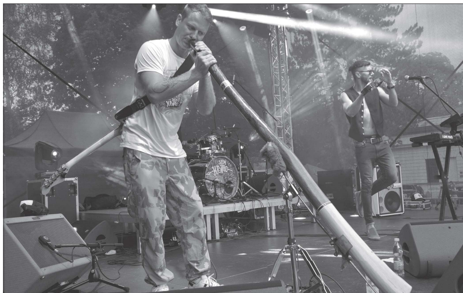
V rámci pouti čekaly na diváky tři dny hudebního programu. I přes nepříznivé počasí nakonec zahráli všichni ohlášení vystupující. Hostem Bartolomějského večera byla mimo jiné i kapela Slepí křováci.