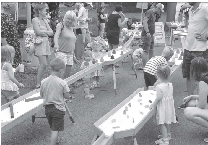
Součástí starodávného jarmarku byla i poměrně rozsáhlá dětská zóna se soutěžími a dalšími atrakcemi. Ve chvíli, kdy nepršelo, bylo u kuličkové dráhy stále živo.