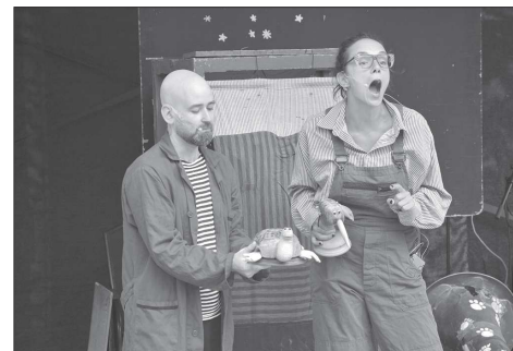
V programu nechyběla ani divadelní vystoupení. V sobotu dětské diváky před Ringhofferovou vilou bavilo pražské Divadlo Elf. To uvedlo nejprve Mikulkovy pohádky (na snímku) a později pohádku O Plaváčkově.