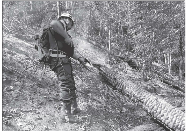
Z důvodu nepřístupnosti terénu museli hasiči k dohašování terénu využívat pouze vaky s vodou, které nosili na zádech.

Do Českého Švýcarska koneckonců vyslala podpůrný technický tým i sama automobilka Tatra Trucks. „Po konzultaci požadavků hasičů vyslala kopřivnická společnost v pondělí 1. srpna ráno do Hřenska servisní vozidlo s techniky a mechaniky. Kromě toho již na místě bylo další vozidlo, které zajišťovalo dovoz potřebných náhradních dílů,“ uvedl mluvčí automobilky Andrej Čírtek s tím, že servisní jednotka byla k dispozici až do odvolání pohotovosti v krizové oblasti. Na místě působila celá řada unikátních tater, v akci byla speciální velkoobjemová cisterna na podvozku Tatra Force 10x10 zvaná Rybník nebo automobilová stříkačka Tatra Force 8x8 s pancéřovanou kabinou přezdívanou Titan, kterou vyrobila Tatra pro zásahy v extrémně nebezpečných a rizikových oblastech.