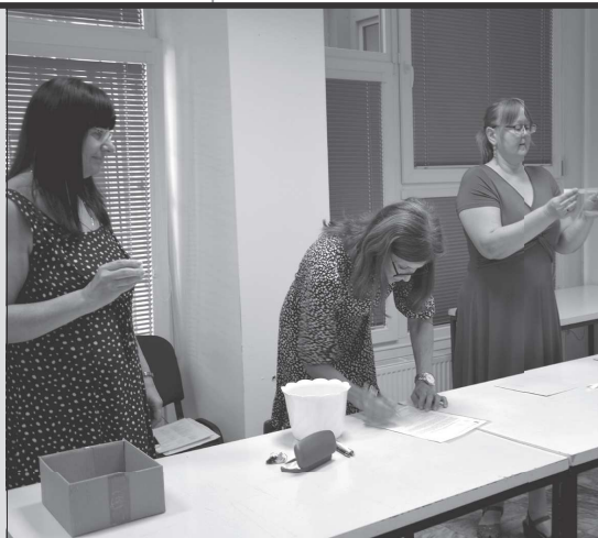
V minulém týdnu proběhlo losování čísel jednotlivých kandidátek pro zářijové komunální volby v Kopřivnici.