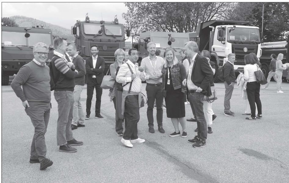
Kopřivnice a automobilka Tatra Trucks hostily v závěru minulého týdne návštěvu stálých zástupců členských států v Radě Evropské unie. Bruselští diplomaté navštívili zkušební polygon i nové Muzeum nákladních automobilů Tatra.