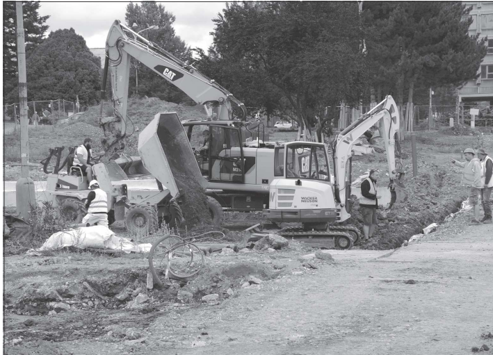
Práce na revitalizaci centra Kopřivnice pokračují. Realizační firma Geosan zároveň vyjednává s kopřivnickou radnicí o navýšení ceny díla.