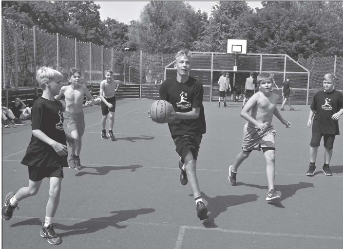
Nultý ročník turnaje ve streetballu se vydáříl, kladné ohlasy zaznamenali pořadatelé ze strany účastníků i rodičů i dalších přihlížejících.

Družstva byla bez rozlišení kategorií (pro vyrovnanost) rozdělena do dvou skupin a z každé postupovaly dva týmy do play-off. Zápas se hrál do 21 bodů s časovým limitem deset minut. Dohromady se odehrálo pět a půl hodiny. Zajímavostí je, že streetball nemá rozhodčí a je založen na vzájemném respektu účastníků a hře fair-play. Zahráti si přišli jak místní, ale i přespolní, basketbalisté, tak i sportovci z jiných odvětví, jako je hokej či házená. Z vítězství se radovalo družstvo Hafo Bad HA, druhé místo obsadil tým Kokosci a třetí skončili Kluci z Příbora a Bull Dock team. „Z akce mám jen hodně kladné ohlasy jak od hráčů samotných, tak i od trenérů či