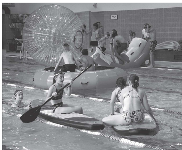
První z programů letošního ročníku prázdninového projektu Někdo ven??? se nakonec kvůli nejistému počasí uskutečnil na hladině krytého bazénu.

REDAKCE KOPŘIVNICKÝCH NOVIN OZNAMUJE, ŽE Z DŮVODU ČERPÁNÍ DOVOLENÉ BUDE od úterý 19. do pondělí 25. července UZAVŘENA