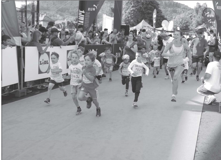
Někteří malí závodníci běželi sami, jiní s doprovodem, všichni ale vložili do Rákosnickova běhu kopřivnického RunTour všechny síly.

Kolem depozitáře Slovenské strelky a přilehlého parkoviště běhalo na svých tratích celkem 183 dětí od nejmenších až po 2.007. Na závěr závodního dne přišel na řadu koloběh, tedy kombinace cyklistiky a běhu, kdy na 15 km se dvojice střídá o kolo. Jeden tedy běží a druhý jede na kole, přičemž každý z této dvojice musí uběhnout aspoň 5 km z trati. Skoro až neuvěřitelně, že tuto disciplínu vyhráli nevidomý