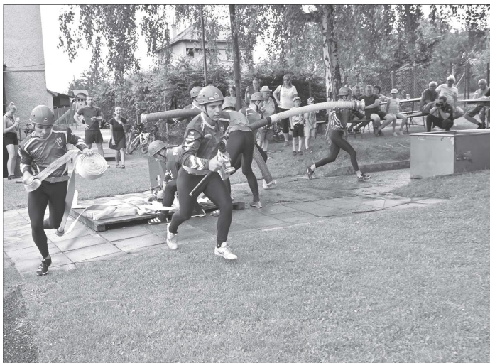
Družstvo mužů z Mniší se svým výkonem obsadilo v 10. ročníku Kovok cupu, v požárním útoku, který je zářeno do Novojičinské ligy, páté místo.