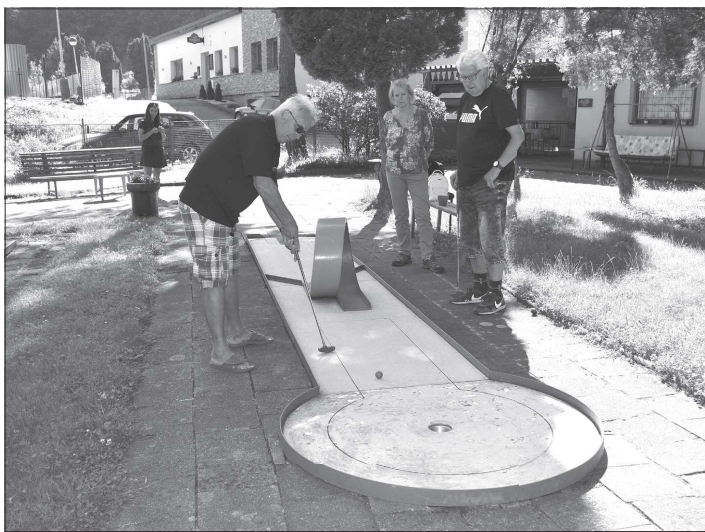
Tradiční seniorská akce – minigolf – přilákala tentokrát jen třicítku zájemců o tuto hru. Tato akce byla poslední před prázdninami.

Další aktivity pro seniory proběhnou až po prázdninách. V září se uskuteční přednáška o sluchu, 20. září se chystá zájezd, 6. října posezení s harmonikou a doprovodný program Smokeman ve Vlčovanovicích. Další přednáška je v plánu 18. října v klubu seniorů, která se bude věnovat tématu ochrana sportovců a jak se bránit energošmejdům a další.