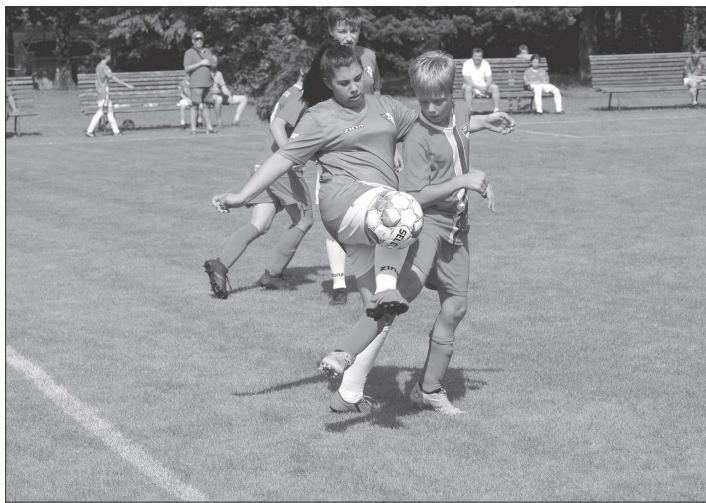
Družstvo Lubina-Vlčovice (hráčka vlevo) stála prohra s Frenštátem pod Radhoštěm vítězství v domácím turnaji Memoriálu Václava Migase.