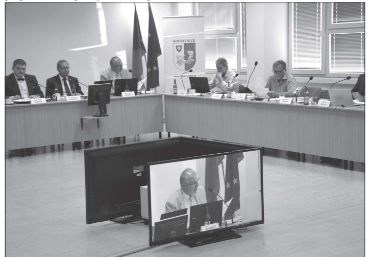
Červnové zasedání městského zastupitelstva mělo na programu mimo jiné schválení smlouvy o prodeji stavebních pozemků v lokalitě Západ. K tomu nakonec nedošlo.