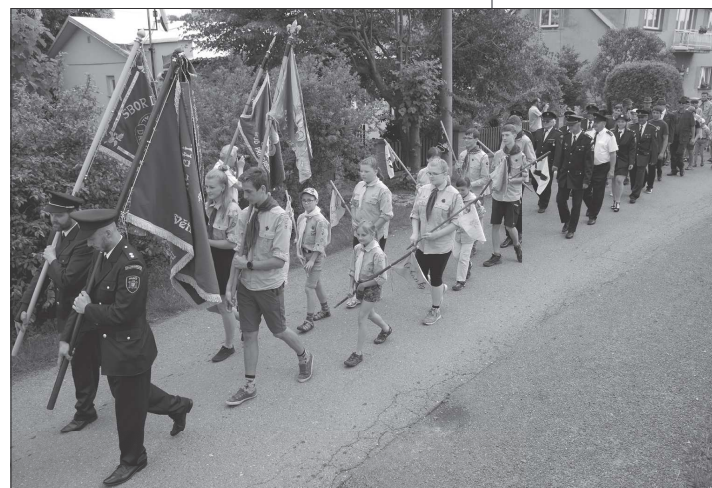
Součástí oficiálního programu oslav 720 let od první písemné zmínky o Větrkovících byl i průvod zástupců místních spolků od kostela sv. Václava na hřišti Spartaku.

Bilanční suma, neboli součet všech aktiv města v minulém roce dosáhlo hodnoty téměř 2,7 miliardy korun. Majetek města byl podle starosty z takřka 94 % kryt vlastním kapitálem. (Pokračování na straně 3)