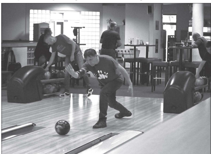
Boj o vítězství v Lize dvojic byl napínavý až do konce a nakonec se z něj radoval tým Geofyzika o půl bodu před dvojicí Dream Team.

Ve skupině útěchy, tedy těch týmů, které se ze semi-