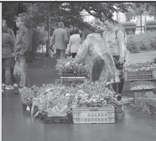
Druhému farmářskému trhu letošní sezony nepřálo počasí. Zájem nakupujících byl slabší.