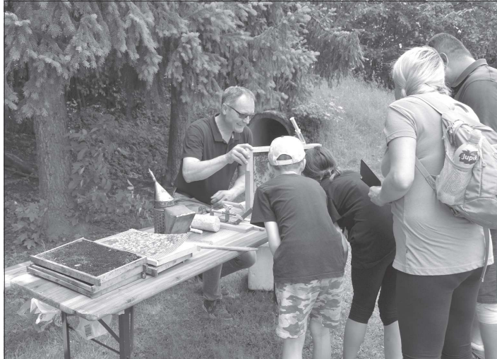
Druhý ročník zážitkové akce pro rodiny, připravený spolkem Vlčovjan, se věnoval včelám. Účastníci se na trati dozvěděli mnoho informací a plnili různé úkoly.

Kopřivnická Tatra pro francouzskou metropoli připravila světovou premiéru nového typu vojenského vozidla Tatra Phoenix 8 x 8 s novou pancéřovanou kabinou z produkce opět místní společnosti TATRA DEFENCE VEHICLE. Kabina vychází z projektu obranných automobilů řady DAF CF na podvozku Tatra pro belgickou armádu a poskytuje vysokou balistickou i protiminoovou ochranu posádky.