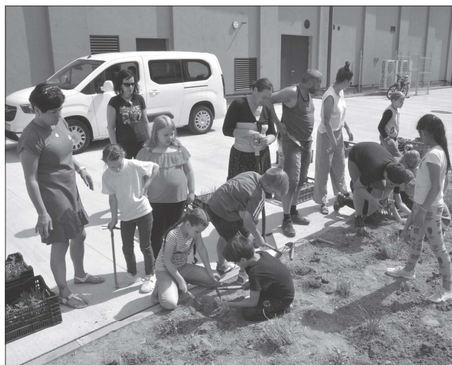
Žáci ze ZŠ Floriána Bayera vysazovali trvalkami záhon mezi novým muzeem nákladních automobilů a restaurací Tatrovka.

Architekti při zpracování svých návrhů přece jen budou muset dodržet nastavené základní parametry. „Návrh musí být realizovatelný, aby fungoval jako komplex, a také je zde finanční strop. Netrváme ale například na tom, aby vany zůstaly stejné, jak jsou nyní. Předpokládá se zachování bazénu pro volné plavání, dětský bazén by měl být spíše herní. Nechceme to budovat jako aquapark, ale jako celkový prostor s herními prvky, které jsou v dnešní době již standardem,“ poznamenal Dušan Krompolec. Výsledek architektonické soutěže – vítěznou studii nového koupaliště by město mohlo získat do podzimu. Její vítěz pak následně dopracuje podrobnou projektovou dokumentaci. „Až po jejím obdržení bude moci město vyhlásit veřejnou soutěž na realizátora stavby. Souběžně bude nutné v rozpočtu města na realizaci vyloučit potřebné finance. To ale proběhne nejdříve v příštím roce. Vzhledem k tomu, že rekonstrukci koupaliště v průběžném označuje Kopřivnicané za prioritní, věřím, že se s ní na jaře příštího roku může začít,“ dodal místostarosta Krompolec.