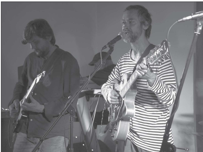
Bratři Orffové minulou sobotu vyprovali společenský sál Vily Machů. Krnovská alternativní kapela v Koprivnici zahrála poprvé a slavila úspěch.