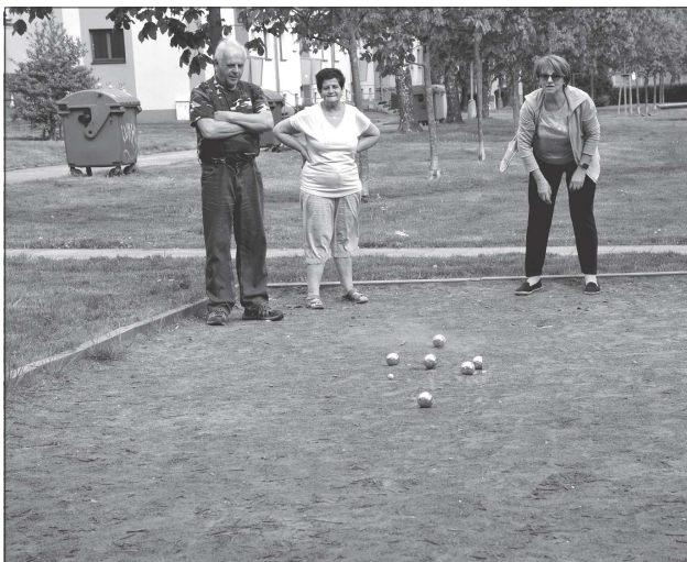
Letos poprvé měli senioři možnost setkat se při pétanquu. Při hře, kterou hráli téměř všichni poprvé.