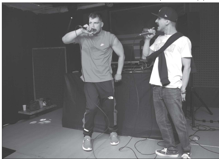
Koprivnický EF Club má za sebou první hipopovou akci. Minulou sobotu na akci Local Rap vystoupil mimo jiné S. Gram, Don Roco, DJ Megas a další.

V sedm hodin pak už začne samotná Bedna. Ta bude letos na vystupující o poznání chudší než před covidem. Připraveno je během pátku i soboty jen sedm představení a o jevišti se budou dělit pouze opavské divadlo Štěk, fungující při tamním středisku volného času, a domácí Údivadlo. Hosté z Opavy přivezou dětský soubor Štěkátko, který zahraje parodii na telenovelu nazvanou Jak se točí Edmundo a loutkové představení Z pohádky do pohádky. Jejich starší kolegové ze studentského souboru publiku nabídnou komedie Milenci paní Betty a Pytlovi u rozvodu. Domácí Údivadlo bude reprezentovat v pátek dětský soubor Fajná šestka s představením Jamie a upíři. Po nich zahrají DIVOČÍ Lenochodi autorskou komediální detektivku Haky a Saky. V sobotu dopoledne Kokosové zahrají O veliké řepě.