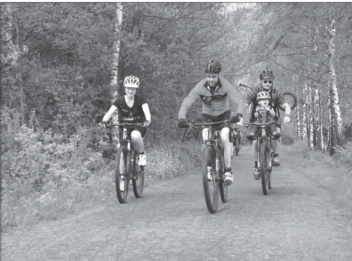
Na druhý ročník cyklovýjezdy se vydali vyznavači bicyklů z Nového Jičína přes Koprivnici až na hráz Větrkovické přehradu, kde na ně čekal připravený program.

V případě druhého záměru, kterým je úprava ubytovacích kapacit v objektu tenisové haly, by podle starosty půl milionu stačit mohlo. Zde město, poté co doběhne běžící výpověď z nájmu a bude vyřešeno užívání objektu, plánuje pokoje vymalovat, nově vybavit a provést rekonstrukci sprch a sociálních zařízení. I když zde bude kapacita připravena pro uprchlíky z Ukrajiny, i tato investice nemá mít jen krátkodobé využití. „Jednou z podmínek donátora bylo, aby peníze, které nám poskytnou, byly využity tak, aby nesledovány jen krátkodobé řešení krize související s uprchlickou vlnou z Ukrajiny, ale aby vynaložené peníze dávaly smysl i po jejím konci,“ doplnil starosta Miroslav Kopečný.