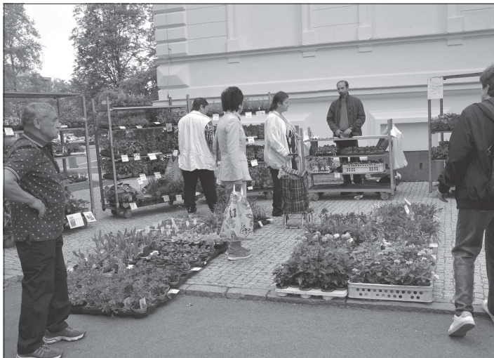
První letošní farmářský trh byl především ve znamení sazenic, které kupovali zájemci nejen na své zahrádce, ale i do truhlíků na balkony.

Za realizaci 216 metrů dlouhého úseku zaplatí město více než 3,27 milionu korun. O zakázku se ucházely čtyři firmy, nejvýhodnější nabídku ve zmiňované hodnotě podal ostravský odstěpný závod společnosti Kami Profit, s. r. o. Podle dohody s firmou by stavební práce měly začít v červnu a na dokončení zakázky má zhotovitel maximálně 75 dnů.