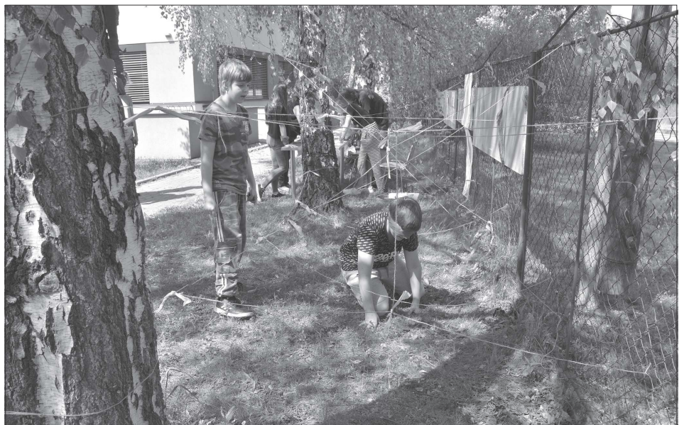
V Centru Pětka, kde se v pátek 13. května konala v rámci Týdne pro rodinu akce s názvem Šťastný pátek, čekaly na děti různé úkoly. Jedním z nich bylo slovně provést bludištěm svého kamaráda. Více na straně 3