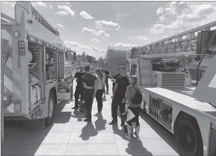
V rámci Dne požární bezpečnosti si veřejnost mohla prohlédnout provizorní zázemí profesionální jednotky v Koprivnici.