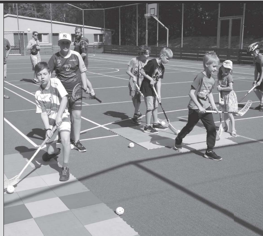
V sobotu 14. května proběhlo dlouho očekávané otevření multifunkčního hřiště v Lubině.