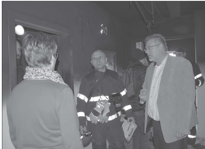
Krátko po uhašení požáru v domě s byty zvláštního určení na ulici České si rozsah škod prohlédli zástupci města a sociálních služeb.

Dobrou zprávou pro město je, že všechny tři strany se dohodly mimo jiné na tom, že každá z možných variant budoucího provozování zdejším muzeí bude respektovat zájem města na celkovém efektivním využití budovy Kulturního domu Kopřivnice a zároveň nedojde ke zmaření investic, vynaložených Moravskoslezským krajem a radnicí na projektovou přípravu úpravy předprostoru muzea osobních automobilů. Přerod fungování kopřivnického muzejního komplexu je ale zatím na počátku své cesty. Studie, s jejímž zadáním memorandum počítá, nebude hotova dřív než v příštím roce, pak bude podle starosty Kopečného záležet na všech třech zúčastněných stranách, jak rychle jednu z předložených variant vyberou a uvedou ji v život.