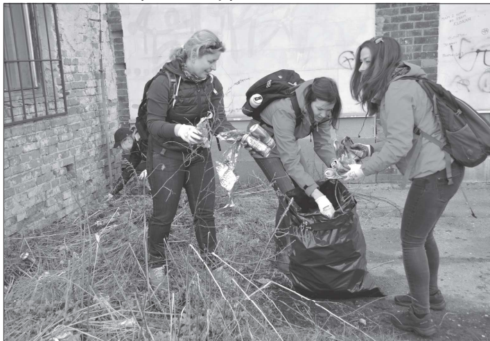
V odloženém termínu vyrazili do ulic města i okolní přírody uklízet odpadky také pracovníci kopřivnické radnice. Během pár hodin nasbírali 58 pytlů odpadu.

O den později se uklízelo opět v Lubině. Tentokrát se do terénu vydali členové Myslivého spolku Hůrka Lubina, a to do lesíku Vrchovina, území vedle JZD ve směru na Hájov a do břehy Lubiny od železného mostu k Orinoku a k budově bývalé firmy Bonok a další území v Lubině. „Naplnili jsme asi 30 pytlů odpadu a k tomu