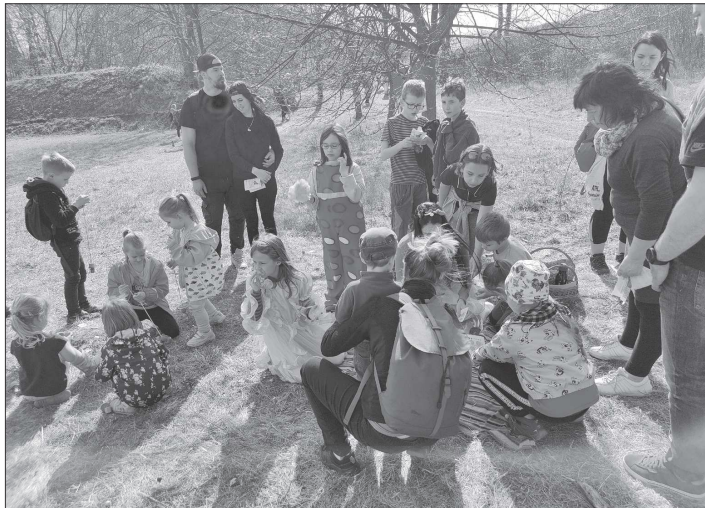
Pěkné počasí přilákalo v sobotu odpoledne na trávu Pohádkového lesa, společně organizovaného Kopřivnicí a Štramberkem, stovky dětí s doprovodem.