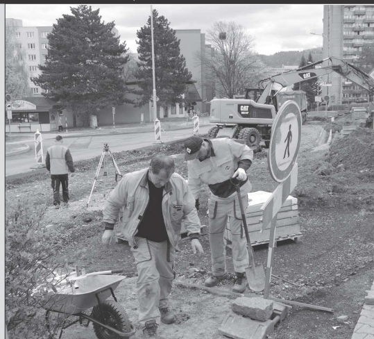
Kritizované přerušení stavby kruhového objezdu způsobilo mělce uložení plynovodu. Nyní už práce znovu pokračují.