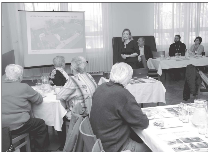
V rámci domovní schůze se obyvatelé domu s byty zvláštního určení číslo 650 mohli seznámit s návrhem úprav zahrady, které budou realizovány ještě letos.