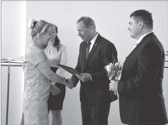
Na Den učitelů proběhlo setkání oceněných pedagogických pracovníků s vedením města. Poděkování z rukou starosty a místostarosty obdrželo 24 kantorů.

V úvodu poděkoval oceněným pedagogům za jejich záslužnou práci nejen starosta města Miroslav Kopečný, ale i místostarosta René Lakomý, jenž je garantem školství. Poté předali oceněným dárek.