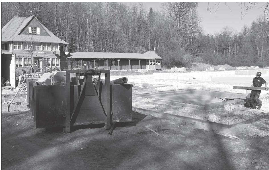
Pokračují práce na rekonstrukci libotínského koupaliště. Zároveň běží jednání o formě jeho budoucího provozování. Jednou z variant je i fungování pod hlavičkou Správy sportovišť Kopřivnice.