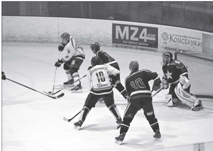
V utkání o vítězství v I. lize daly první branku Nebory (v tmavých drescích), hokejisté Predators však nakonec zvítězili 3:2 po nájezdech.

Z druholigových mužstev na tom byl po základní části